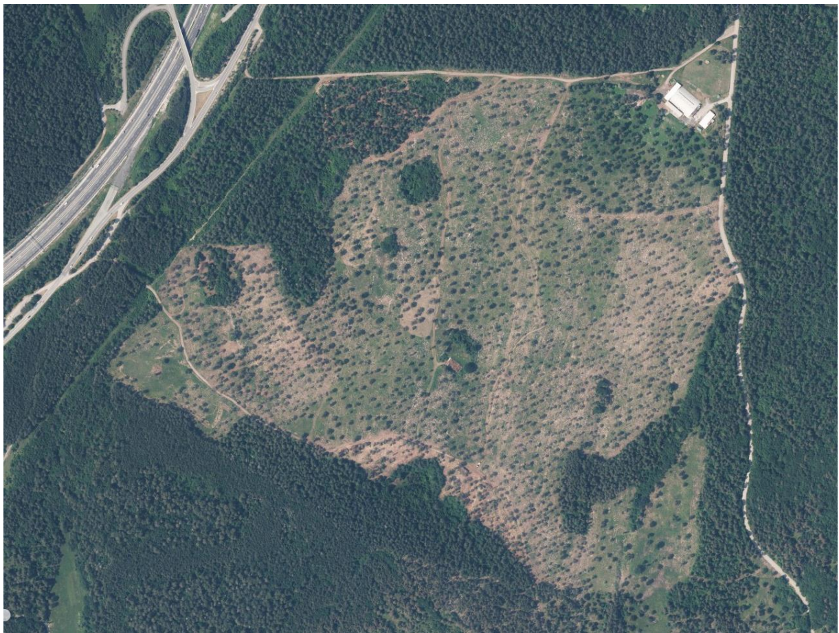
Posnetek letošnje krčitve pri hlevu CSR Vremščica (Gabrče 30, 6224 Senožeče)