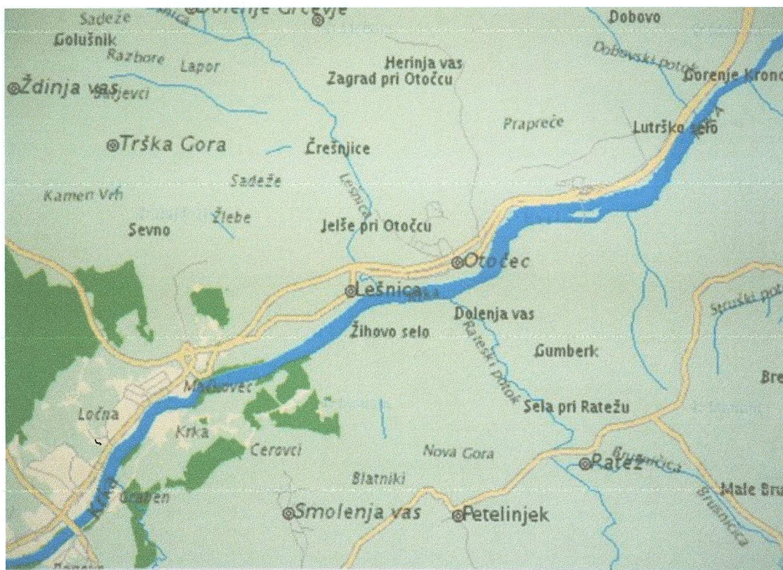
SLIKA 1: ŠOLSKI OKOLIŠ OŠ OTOČEC

V skladu z Zakonom o osnovni šoli ustanoviteljica šole zagotavlja brezplačni prevoz za vse učence, ki imajo stalno prebivališče oddaljeno od šole več kot 4 km, ali pa je njihova pot nevarna, kar potrdi Svet za preventivo v cestnem prometu.