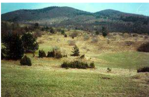
Vasišče- opuščena vas