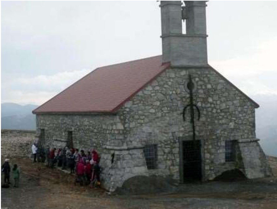
Obnovljena cerkev – obnova v letih 2000- 2010

Čeravno se niso več opravljale sv. Maše gori, je moral, kakor pripoveduje ljudstvo, trnjski cerkvenik vsako soboto hoditi luč prižigat, da je gorela v cerkvi. Sčasoma se je naveličal, kajti s Trnja se k sv. Trojici rabi skoraj dve uri. Da bi ne bilo več treba gori hoditi, bi bili radi streho raztrgali, da bi se cerkev prej podrla. Ker je bila cerkev krita s škodljami in so žebli zarjaveli, se ni streha dala razkopati. Trnjski gospod, tako pripoveduje ljudstvo, jim je dal nato svet, če se streha ne da drugače razkopati, naj jo pa zažgo. In res so jo zažgali. Ko je ljudstvo videlo, da gori cerkev sv. Trojice, je bilo razburjeno. Če bi bili takrat v roke dobili požigalce, bi jih vrgli kar v ogenj.«