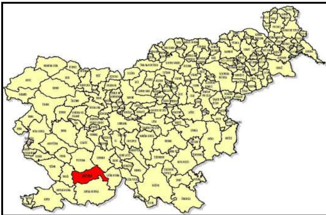
Karta 2.1: Lega občine Pivka v Sloveniji. Po velikosti spada med srednje velike občine Slovenije

Občina Pivka leži na jugozahodnem delu republike Slovenije in kot je razvidno iz karte občin Slovenije meji na občine Postojna, Divača, Ilirska Bistrica, Loška dolina in Cerknica. Po Melikovi klasifikaciji to območje spada med pokrajine v zaledju Koprskega Primorja. Občina Pivka je nastala konec leta 1994. Obsega 223.25 km 2 kar znaša 1,1% celotne površine Slovenije, in ima v 29 naseljih blizu 6000 prebivalcev ali prebivalstvo Pivške občine predstavlja 0,31% prebivalstva Slovenije. Leži na območju kraške Zgornje Pivke, dela gozdnatih planot Javornika in Snežnika, Košanske doline in doline Reke, delno pa seže tudi v Brkine.