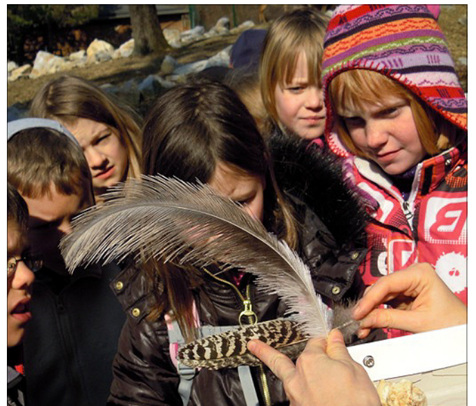
Noji ne letijo. Njihova peresa so drugačna od ptic, ki letajo.