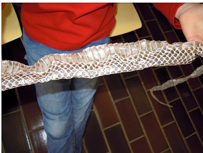
← Po oblačilu, ki ga žival menja nekajkrat letno, zdaj zagotovo že vsi prepoznate lastnika.