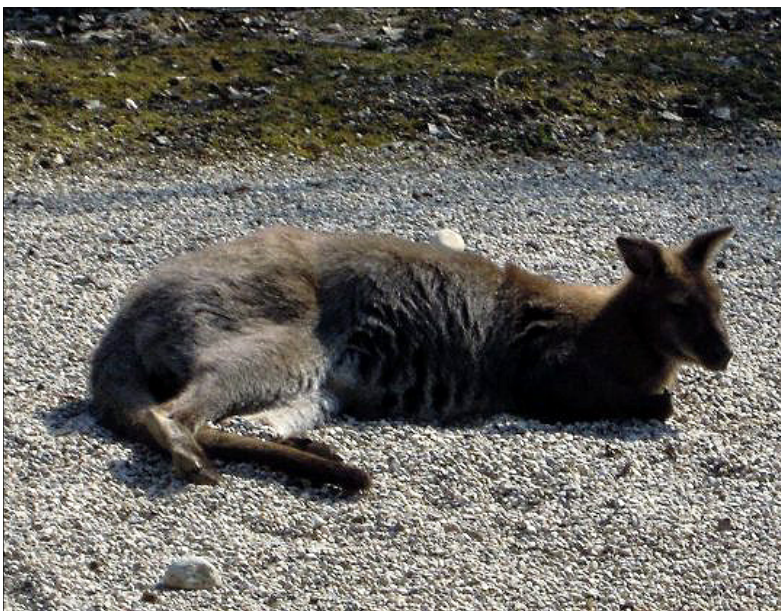
Kenguru počiva na soncu.