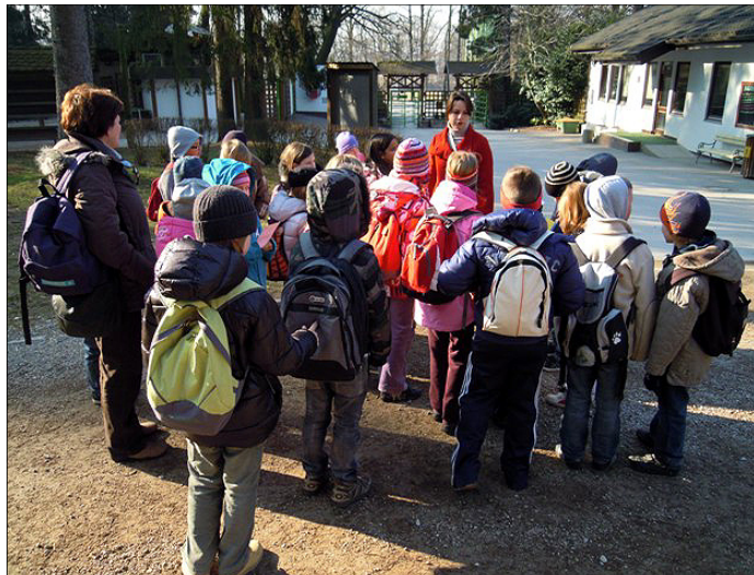
Prijazna vodička je b-jevce razveselila z novico, da obisk ZOO začnemo s spoznavanjem živali v učilnici.