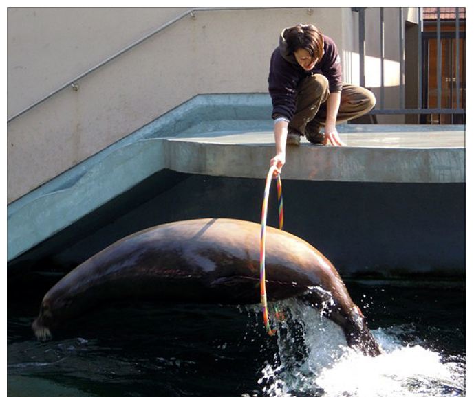
Hop, skozi obroč!