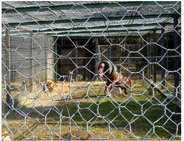
Lev je poginil. Levinji je zdaj malo dolgčas. Za družbo je dobila veliko igrabo, ki spominja na leva.