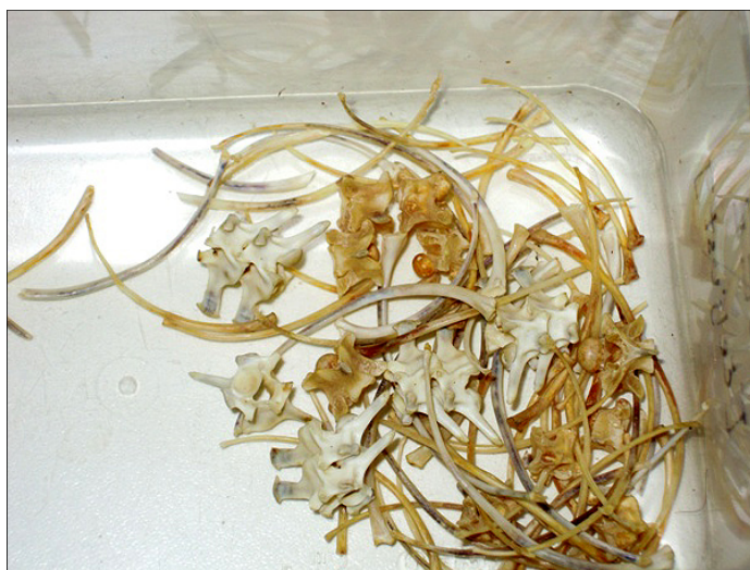
To so kosti nekega bližnjega sorodnika živali, ki smo jo kmalu lahko bolje spoznali.