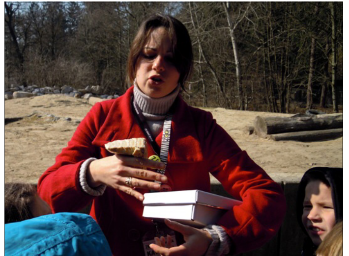
Sloni imajo velike zobe. To je menda le pol zoba.