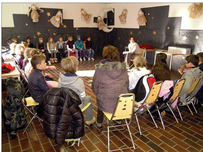
Pogovor o življenjskem krogu in nestrpno pričakanje, katero žival bomo spoznali v učilnici.