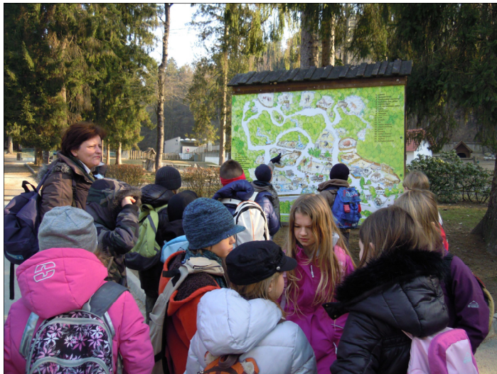
Zbrani pred tablo s prikazom poti po ZOO. Na sliki se ne vidi, kako zelooooo nas je zeblo.