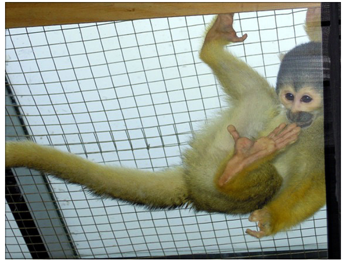
Je to mogoče gospod Ficko? Kje pa je Pika Nogavička?