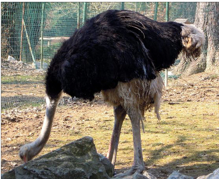
Saj ne verjamete, da bo glavo zakopal v pesek, kajne?