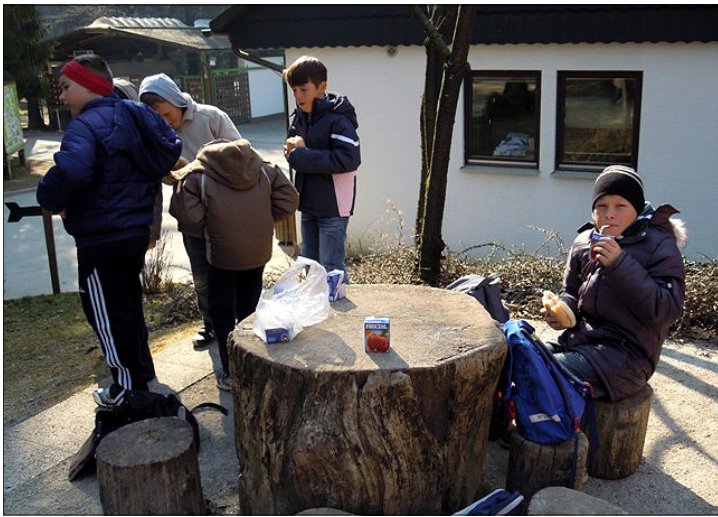
Čas za malico. Mraz nas tokrat ne moti, saj je lakota hujša od njega.