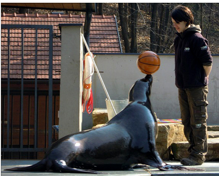
Morski lev nas je navdušil s svojimi cirkuškimi spretnostmi.