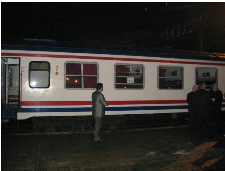
VLAK BALKAN EXPRESS (povezuje Belograd, Sofijo in Istanbul)

Sama pot z vlakom je trajala 35 ur, a nam je hitro minila, saj smo bili polni pričakovanj, hkrati pa se je tudi na poti dogajalo marsikaj zanimivega, tipičnega za »Balkan«, npr. stalne zamude, ustavljanje vlaka sredi polj, sicer prijazni sprevodniki, a z zelo omejenim znanjem angleščine ter nenazadnje bujenje sredi noči zaradi kontrole potnih listov. Tako so nas drugo noč na vlaku zbudili okoli tretje ure zjutraj in nas napotili v dolgo vrsto čakajočih na turške vizume. A tudi to smo prestali in čez par ur, z dvourno zamudo vendarle prispeli na postajo Sirkeci v evropskem delu Istanbula (Carigrada).