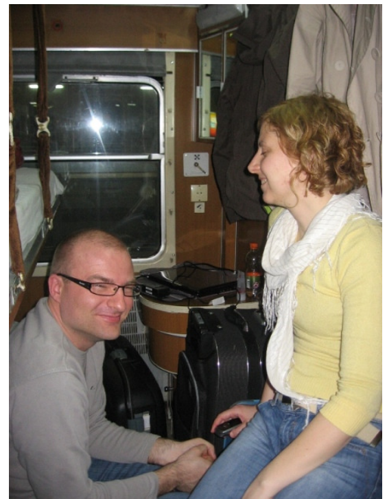
UČITELJA NA VLAKU DO BEOGRADA