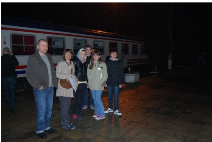
ČAKANJE NA TURŠKI VIZUM SREDI NOČI