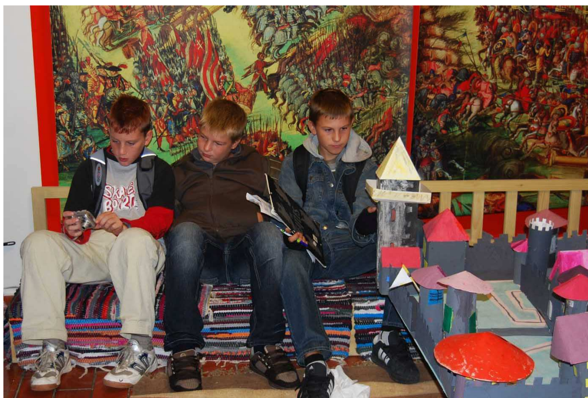
Počitek na preprogah po napornem dnevu. Bela krajina ostaja zabeležena v spominu in na slikah.