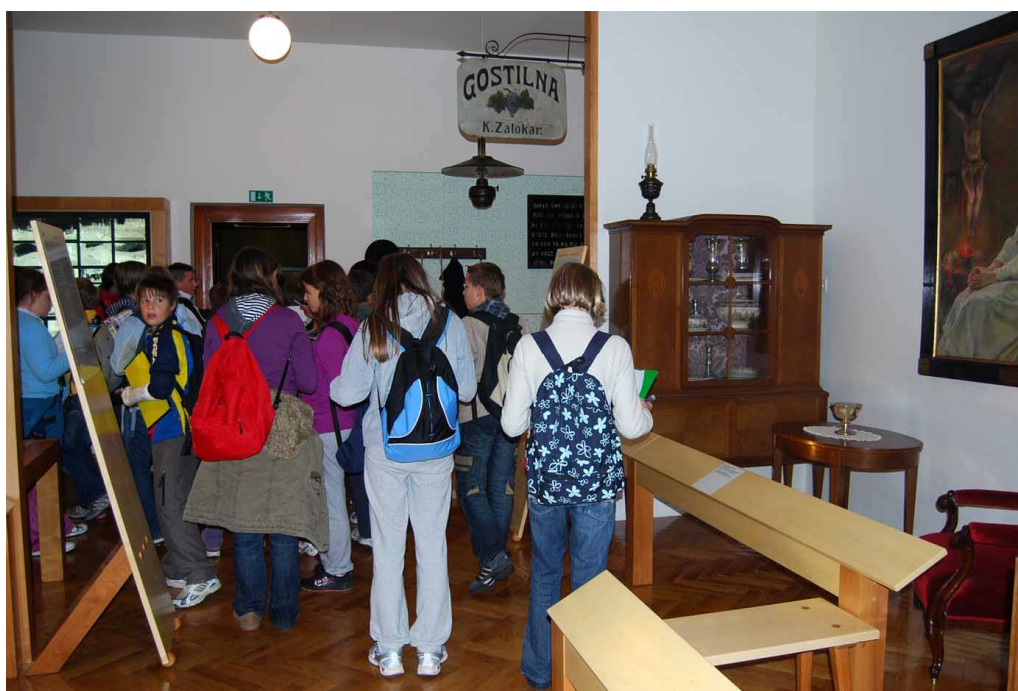
Življenje metliškega meščana.