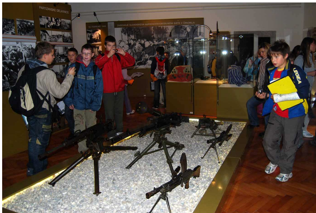
Osvobojeno partizansko ozemlje med drugo svetovno vojno.