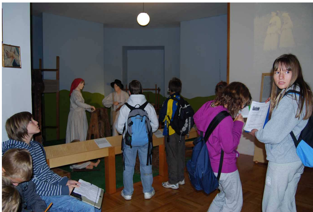
V njem smo si ogledali redne muzejske zbirke – tkanje platna.