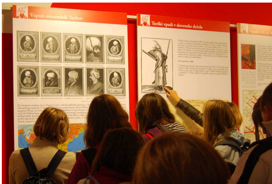
Turški vpadi v slovenske dežele.