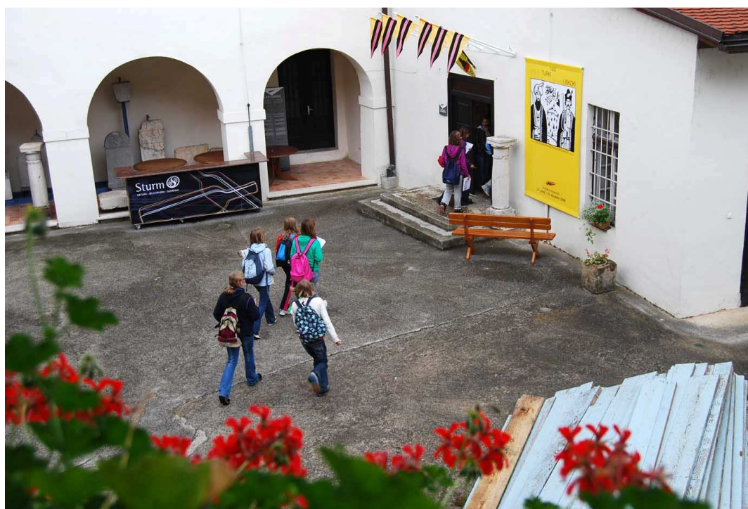
Na koncu smo videli tudi priložnostno razstavo Prišli so Turki – za njimi Uskoki.