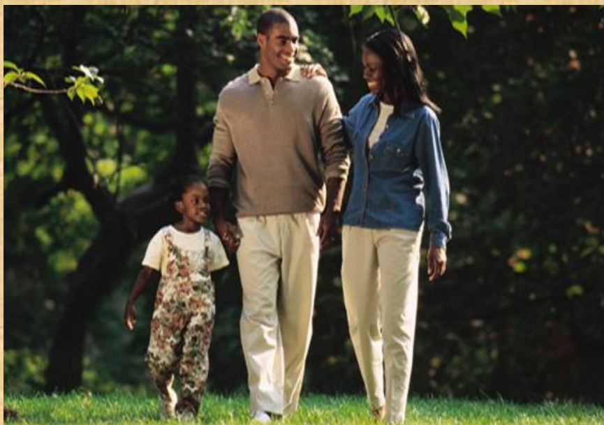
OŽJA DRUŽINA – TRIČLANSKA