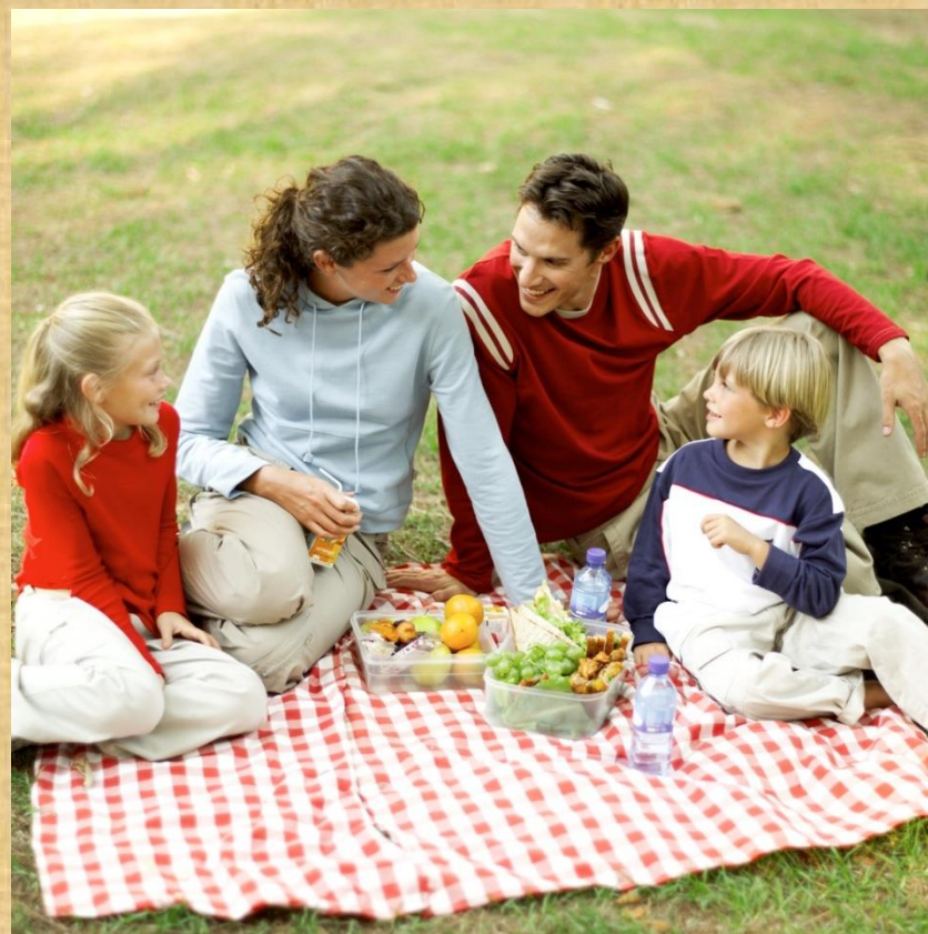
OŽJA DRUŽINA ŠTIRIČLANSKA