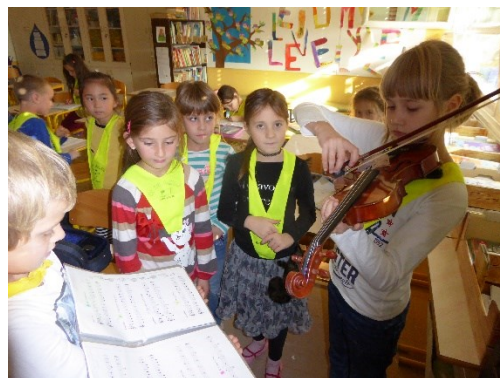
... ko poslušamo glasbo.