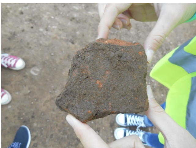
Košček 2000 let stare posode