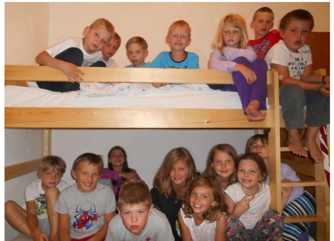
Učenci 3. a razreda