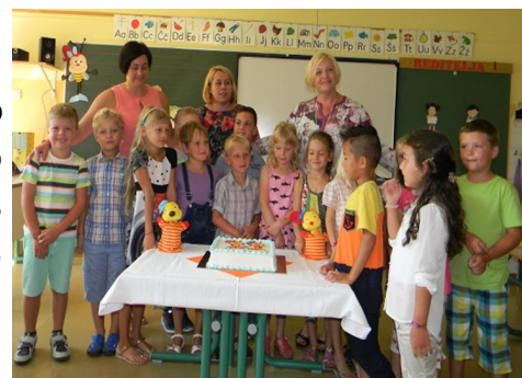
Učenci 1. b razreda z učiteljicami