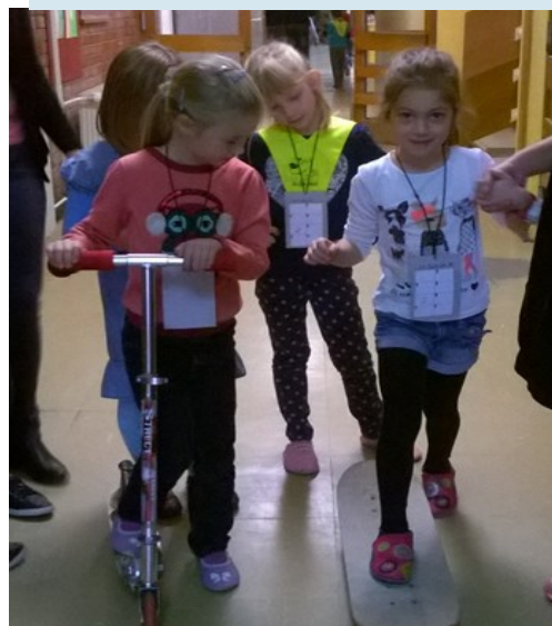
Vozimo se s formulo 1