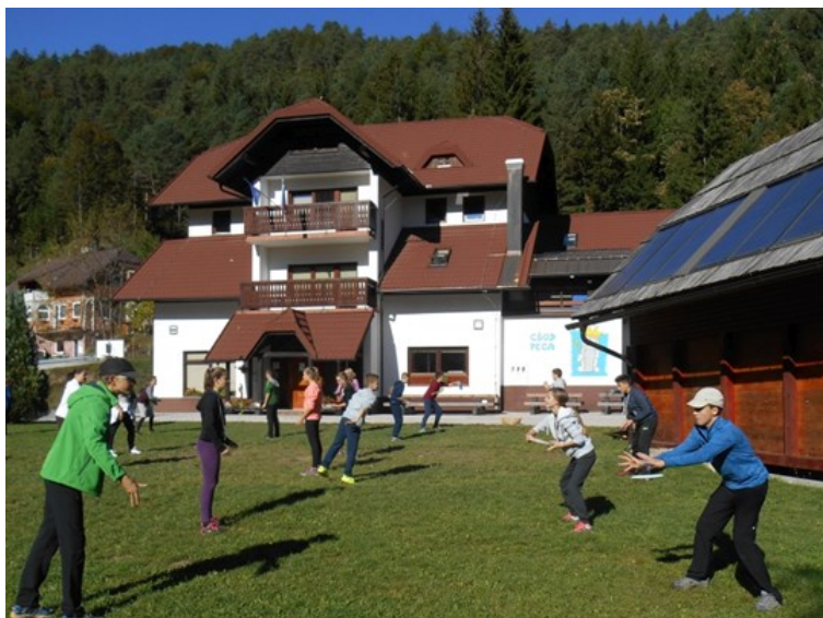
Pred CŠOD Peca smo bili zelo aktivni.