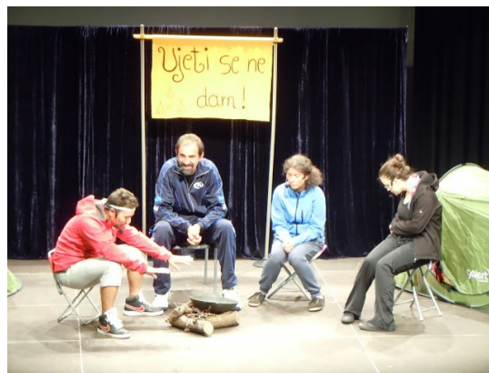
Gledališka predstava v izvedbi Društva za boljši svet

Teden otroka temelji na obeleževanju Svetovnega dneva otroka, ki ga je leta 1956 priznala generalna skupščina Združenih narodov. Po priporočilih Združenih narodov se Svetovni dan otroka praznuje prvi ponedeljek oktobra.