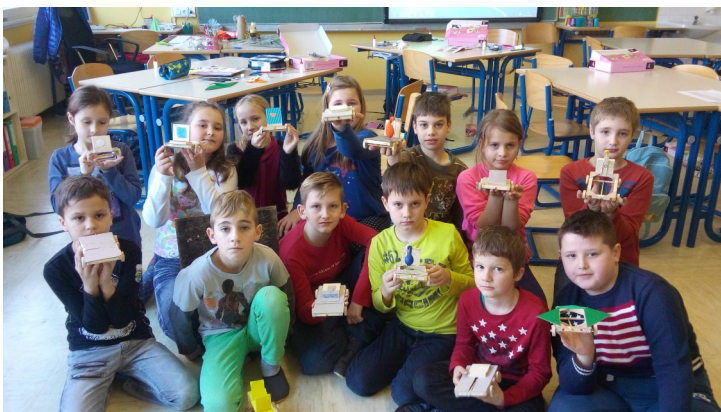
Učenci 4. b razreda