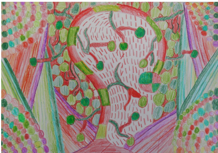
Anže Rakovič, 8. b