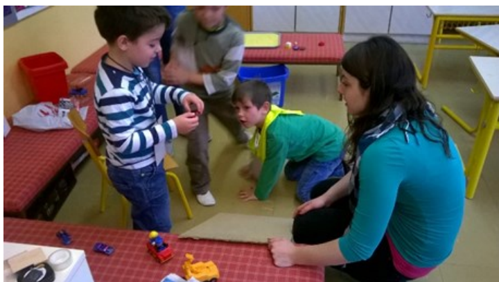
Študenti so nam pripravili naravoslovni dan

Res nam je lepo in zanimivo v šoli. Posebno zanimivo je takrat, kadar pouk poteka malo drugače. Najbolj smo uživali na plavalnem tečaju.