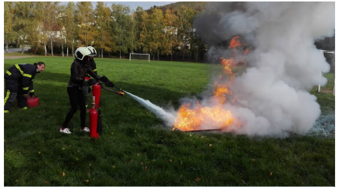
Prikaz gašenja požara.

V petek, 23. 10., smo imeli naravoslovni dan. V jedilnici se je začel širiti bel in gost dim. Nemudoma smo poklicali na številko 112 in pridrveli so gasilci in reševalci. Vedeli smo, da se moramo iz šole umakniti. Vsi smo tekli ven, vendar pa sta v učilnici ostali dve učenki. Prispel je tovornjak z dvizžno lestvijo in gasilec je ujeti učenki rešil skozi okno. Ko so požar pogasili, so mlajši učenci odšli v učilnice, starejši pa so ostali zunaj. Gasilci so nam pokazali še druge njihove spretnosti in opremo. Razložili so nam, s kakšnimi nevarnostmi se še srečujejo. Razkazali so nam notranjost gasilskega in reševalnega avtomobila, oblačila za razne reševalne akcije. Seznanili so nas, s čim lahko sami gasimo, kako uporabljamo gasilni aparat in kako varno ravnamo z vnetljivimi snovmi. Eden od gasilcev nam je teoretično razložil, kako lahko pride do požara, če nismo previdni. Zelo zanimivo je bilo, ko nam je pripovedoval o svojih dolgoletnih izkušnjah gašenja. Ko smo prišli iz učilnic, smo na igrišču zagledali avto, ki je bil ves v plamenih. Pograbili so gasilne naprave in začeli gasiti. Nabralo se je precej bele pene, ki je izgledala kot sneg. Po končanih aktivnostih smo si v gasilskem domu ogledali še ostala vozila. V spomin na ta dan, ki smo ga preživeli z njimi, smo prejeli fotografijo iz lanskih katastrofalnih posledic žleda. Slika je vseeno očarljiva.