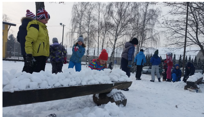
Učenci 5. razreda imajo veliko dela s snegom.