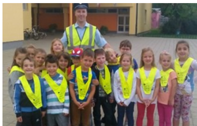
Obiskal nas je gospod policaj