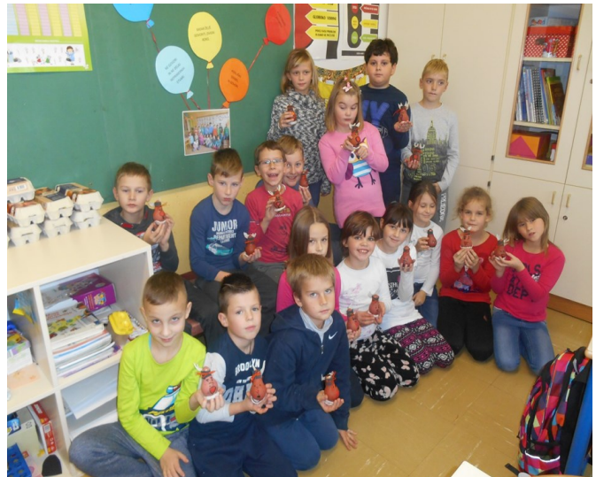
Učenci 3. b razreda