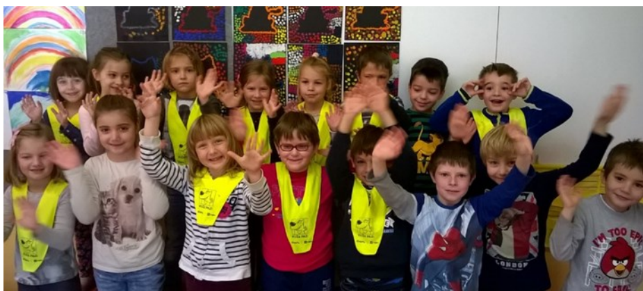
Učenci 1. a razreda

Pri nas se zmeraj dogaja kaj zanimivega. In komaj čakamo, da se naučimo pisati. Za naslednji časopis bomo že sami kaj napisali. Do takrat pa en lep prvo-šolski pozdrav.