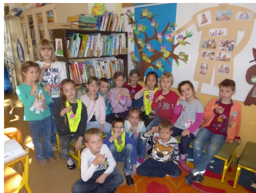
... se učimo in smo dobre volje.