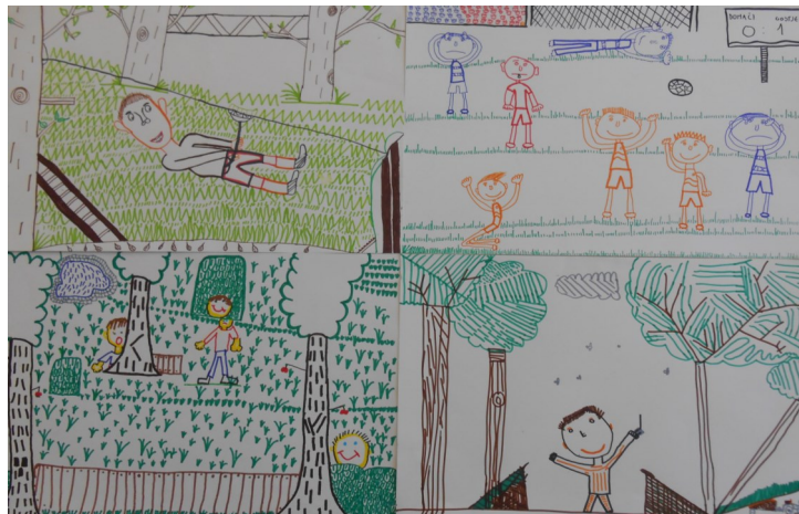
Til, Črt, Žan, Arne, 5. razred