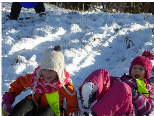
....ko kam gremo, se drsamo in sankamo.