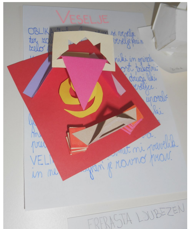
Vita Rosc, 7. b