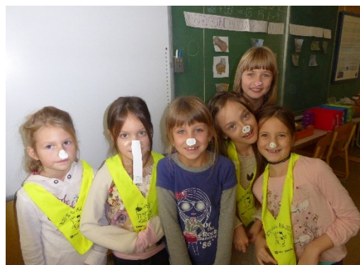
... ko imamo lepe noske...