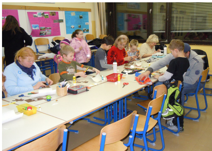
Skupno ustvarjanje učencev in staršev.

Okrog osmih zvečer se je ta nenavaden dan končal. Starši so si ga verjetno zapomnili po tem, da so bili po mnogih letih spet učenci v šolskih (m)učilnicah, mi učenci pa smo uživali v ustvarjanju skupaj s svojimi starši.