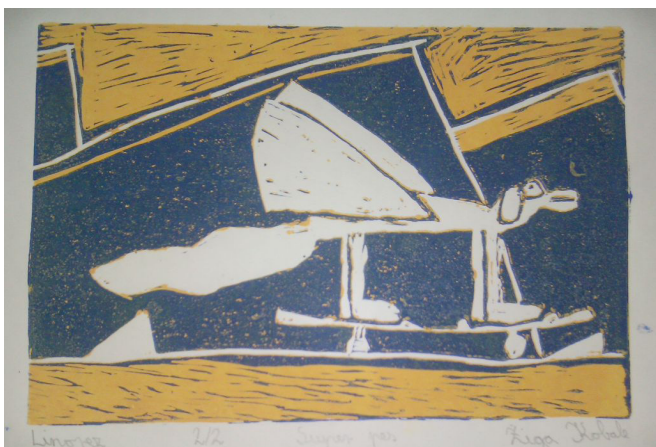
6 Super pes, Žiga Kobale, 7. a.