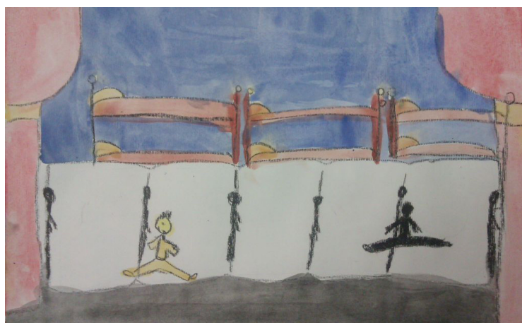
Baletne mojstrovine iz predstave, Brina Završnik, 4. b.