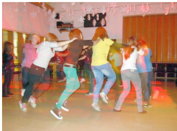
Utrinek s plesišča.

V petek, 9. 12. 2011, se je na Osnovni šoli Kamnica odvijal PRVI ŠOLSKI PLES v šolskem letu 2011/2012. Zbrali smo se ob 17. uri v avli šole. Ko je vseh 20 učencev prišlo so se ugasnile luči, vklopili so se reflektorji in zavrtela se je prva glasba. Sprva smo vsi posedali in se sladkali ob prigrizkih ter pili sladek sok. Kasneje pa se je ples razvil v pravo zabavo. Vsi smo plesali in se neizmerno zabavali. Kar hitro pa je bila ura osem zvečer in morali smo oditi domov. Najprej smo vse lepo pospravili, nato pa se žalostni odpravili domov. Ko sem povprašala udeležence šolskega plesa, kako je bilo, so bili nekateri nad njim navdušeni, nekateri pa so ga doživljali dokaj dolgočasno. Sama sem se zabavala in udeležila se bom tudi naslednjega šolskega plesa.