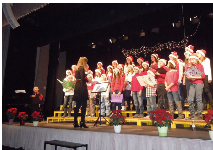
Mladinski pevski zbor OŠ Kamnica med koncertom.