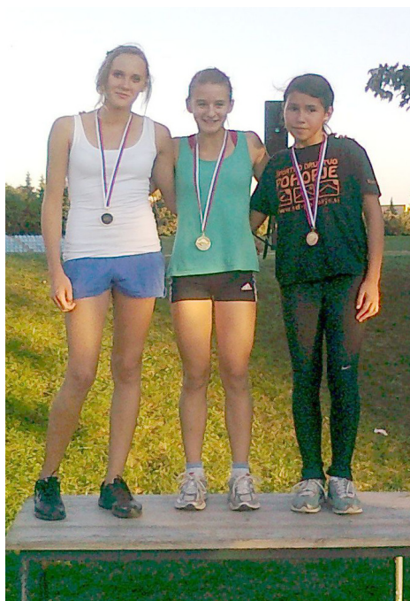
Na stopničkah po končanem jesenskem krosu.