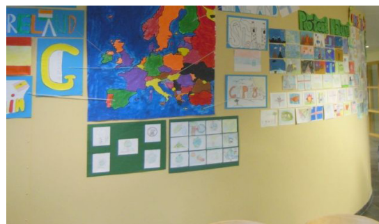
Oglasna deska v šoli Islandskoli.