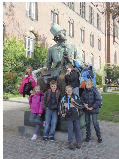
Pred spomenikom H. C. Andersena.