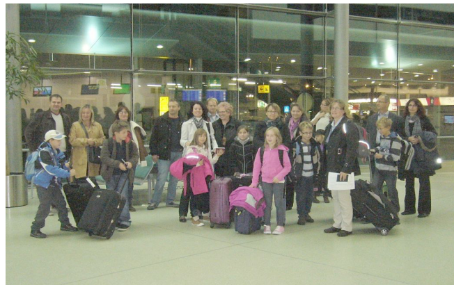
Skupinska slika na letališču.

Pričakovali smo, da bo dežela večja, presenetilo pa nas je tudi, da je le glavna cesta v Reykjaviku asfaltirana, vse ostale poti so kamnite in peskane.