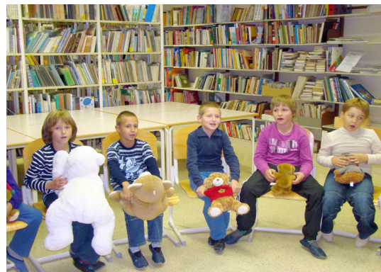
Učenci med poslušanjem pravljice.