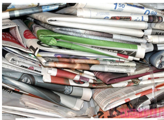
Akcijo bomo v začetku junija ponovili.

Skupaj smo zbrali skoraj 35 kg starega papirja na vsakega učenca. Akcijo bomo v začetku junija, torej ob koncu letošnjega šolskega leta ponovili, zato začnite z zbiranjem papirja že zdaj. Tudi takrat bomo najboljši razred nagradili.