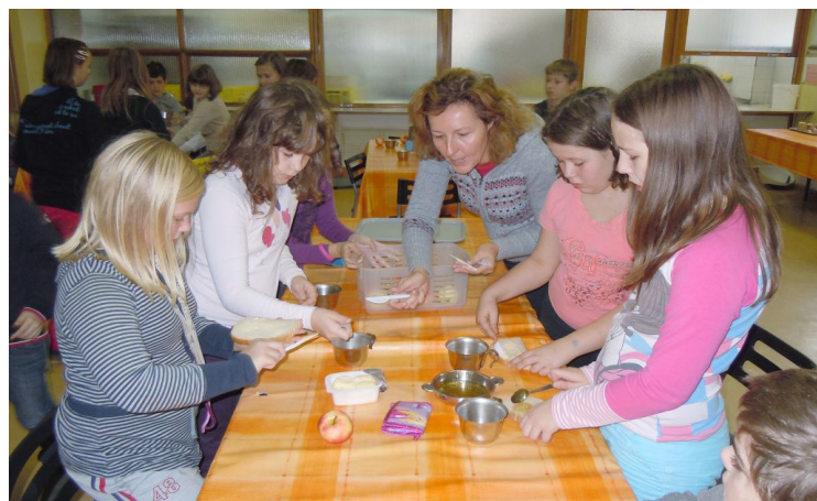
II. triada pri zajtrku.