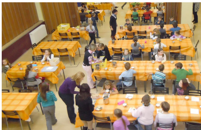
I. triada pri zajtrku.

Poslikali smo tudi panjske končnice, da bodo čebelnice imele lepe panje in še naprej izdelovale slasten med.