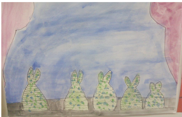
Morske deklice iz predstave, Gabrijela Kresal, 4. a.

Za konec pa naj dodam še to, da se za prihodnost mariborskega baleta ni bati.