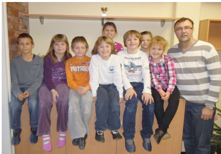
Skupinska fotografija s pokalom v ozadju.

Nekaj učencev iz 2. a, 2. c in 1. c se nas je udeležilo tekmovanja v igri Med dvema ognjema v okviru ŠKL. Tekmovanje je potekalo v Srednji lesarski šoli. Bilo je super in uspelo se nam je uvrstiti med dobitnike pokalov. Zasedli smo odlično tretje mesto. Z napetimi dvoboji pa smo naredili nekaj sivih las učiteljici Majdi in učitelju Siniši. Zapomnite si: ŠKL JE ZAKON!