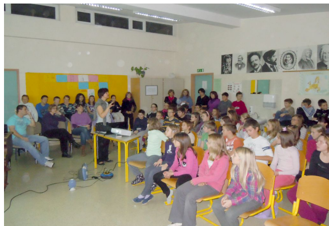
Zbor in razdelitev dela.