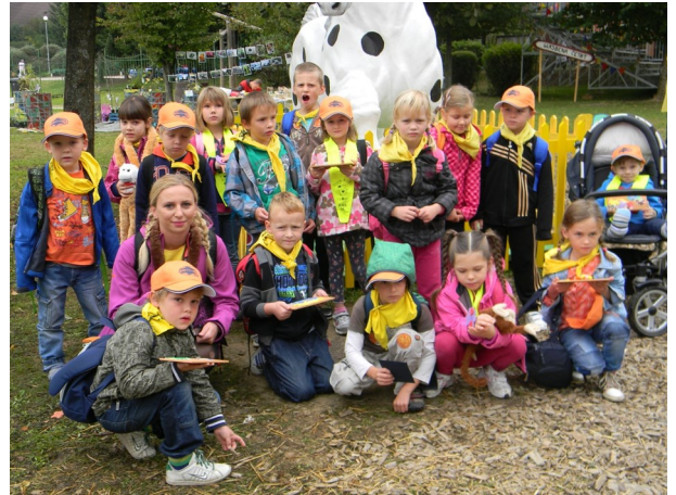
Prvošolci pri Piki.

V šoli je najboljši predmet slovenščina. Zelo všeč mi je bil Pikin festival. Moj najboljši dan pa je bil, ko smo gledali predstavo Janko in Metka.