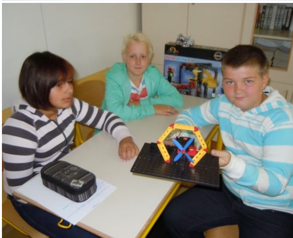
Utrinki s tehniškega dne