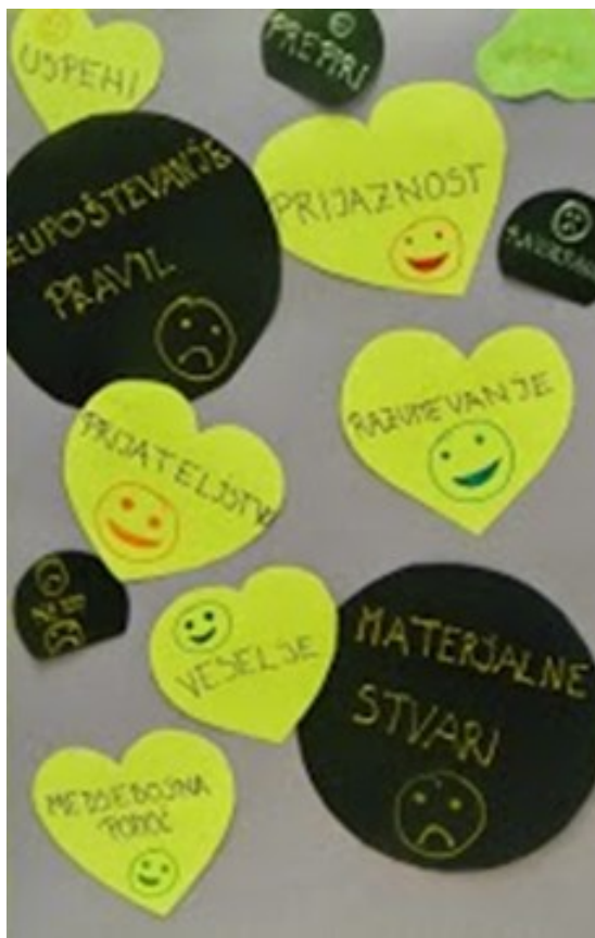
Izdelali smo plakate