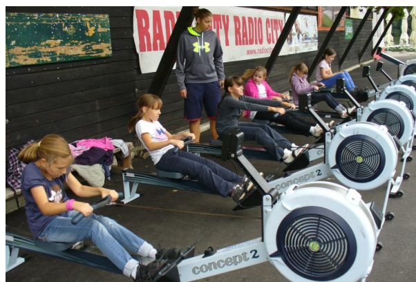
Učenci in učenke 5. razreda