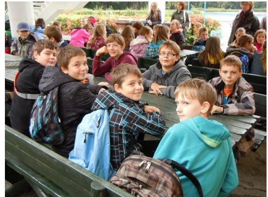
Mariborski otok je med nami zelo priljubljen

nemu drevesu, da ga je prepoznaval po tipu. Nato sta odšla do začetne točke in prvi je moral ugotoviti, pri katerem drevesu je bil.