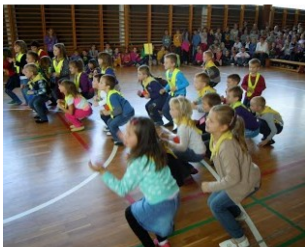
V šoli je veselo

Smo učenci 1. b razreda. Letošnje šolsko leto smo prvič zakorakali skozi šolska vrata in se posedli v šolske klopi ter podali v zanimivo in zabavno šolsko življenje, ki nam je v tem kratkem času, ki smo ga preživeli v šolskem okolju, postreglo z mnogimi dogodivščinami, ob katerih smo prejeli tudi kaneček znanja. Bili smo na Pikinem festivalu, spoznali Piko Nogavičko in z njo pekli izvrstne palačinke po njenem skrivnostnem receptu, ki nam ga je zaupala. Imeli smo tudi piknik in druženje s starši, popestrili pa so nam ga napihljivi tobogani, na katerih smo se zelo zabavali. Za bolj prijetno in domače vzdušje v razredu si ob pomoči učiteljic okrasimo