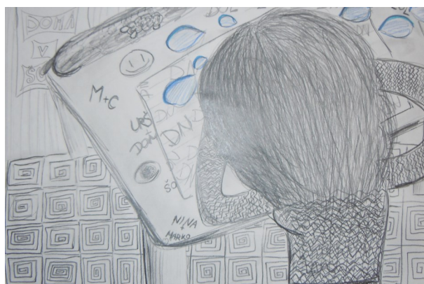
Ana Rajšp, 8. b

Časopis izhaja dvakrat letno