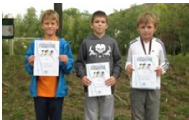
Najboljši učenci 4. razreda na šolskem krosu