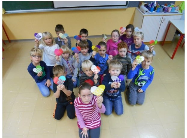
Učenci 2. a so izdelali srčke in se postavili v obliko srčka

Hospic je srce, ki povezuje generacije. Ko se en rojeva, drugi umira. V hospicu se ne rojevajo, prihajajo pa mladi.