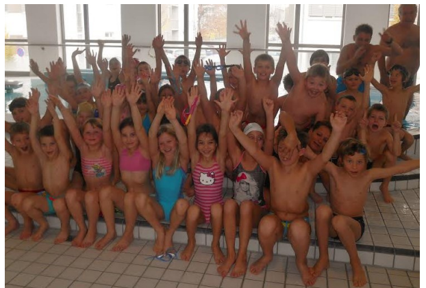
Plavalci ob bazenu.

Juhu, pa smo vsi uspešno zaključili plavalni tečaj. Dva tedna smo vsak dan pridno vadili in v petek pokazali, koliko smo se naučili. Najbolj nam je bilo všeč igranje v malem bazenu, plavanje v olimpijskem bazenu in skakanje s stolpa. Škoda, da nas niste mogli videti, kako pogumno smo skakali z velike skakalnice!