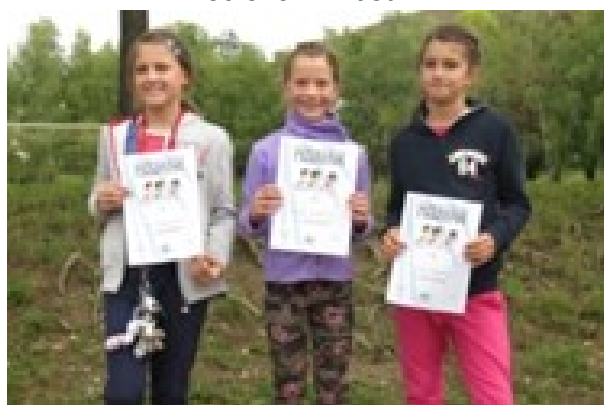
Najboljše učenke 4. razreda na šolskem krosu