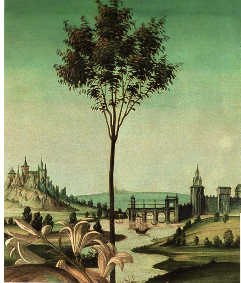
Sandro Botticelli, Oznanjenje (detajl), 1489, Uffizi, Firenze.