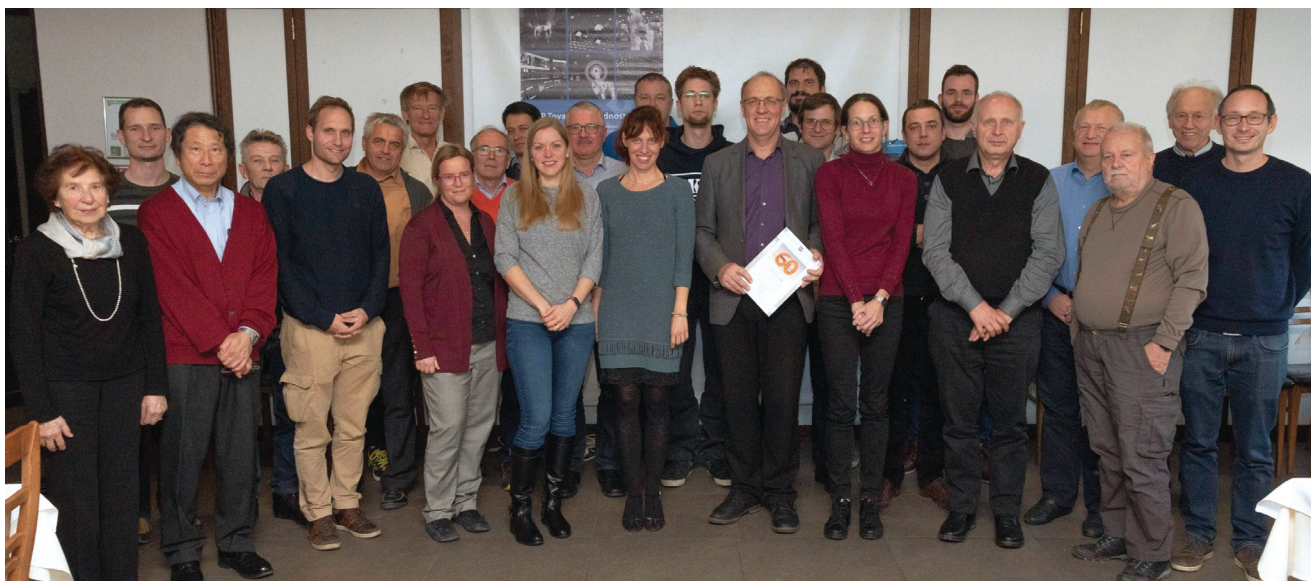
Udeleženci občnega zbora DVTS in proslave ob 60-letnici društva