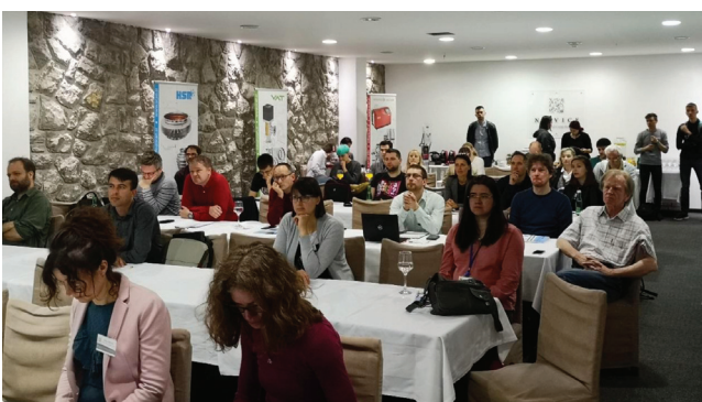
Slika 2: Udeleženci srečanja med spremljanjem predavanj