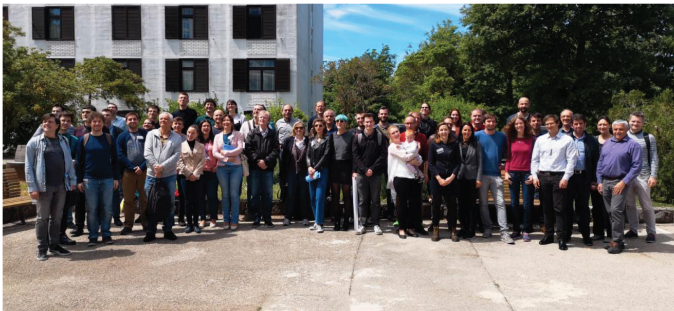
Slika 5: Skupinska fotografija udeležencev 26. sestanka »Vakuumska znanost in tehnika« v Njivicah na otoku Krku