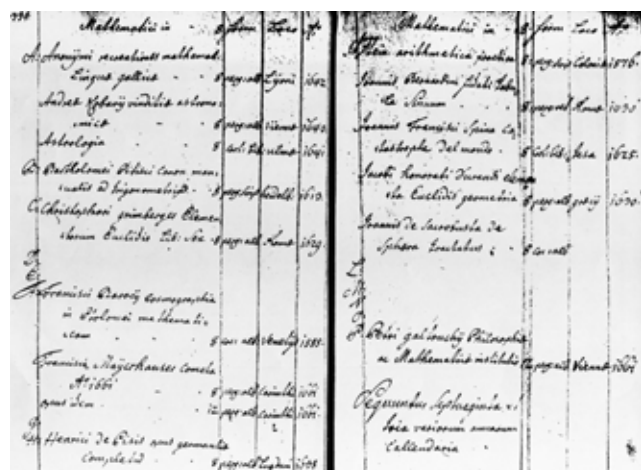
Slika 6: Predzadnja stran popisa matematičnega dela knjižnice prvga kranjskega vakuumista, kneza Turjaškega, in njegovega brata. Na drugem mestu levo navaja Kobavovo knjigo (ibid., 334–335)

vilna Portajeva dela, njegovo Magijo je imela kranjska družina Rechbach celo v dveh različnih natisih.