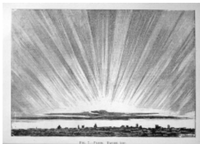
Hallersteinov severni sij iz leta 1770, kot ga je narisal opazovalec v Parizu (Angot, 1896, str. 24/25)

Leta 1776 je Tirnberger poročal o opazovanju severnega sija v Gradcu pri 47^\circ 4' severne širine. Opazoval je devet mesecev pred Hellom in Hallersteinom. 14. 12. 1769 je začel opazovati ob 21. uri, 27. 12. 1769 pa pol ure prej, 30. 12. 1769 je začel meriti ob pol šestih zjutraj in opazovanja nadaljeval naslednjo noč, 31. 12. 1769. Drugače kot Hell in Hallerstein ni opazoval le svetlobe, temveč je pojav meril tudi z magnetno iglo. Igla se je premaknila proti vzhodu, ko so ob močnem vetru hudourni oblaki prekrili nebo nad gorovjem. S posebno napravo je