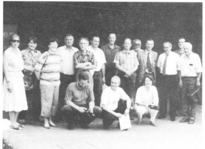
Slika 1. Skupinski posnetek pred vhodom v tovarno SAES Getters

Inštitut za tehnologijo površin in optoelektroniko