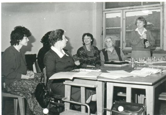
Študijski krožek novinarstva na Filozofski fakulteti, 1987

Ko smo leta 1984 ustanavljali takrat še Šolo za tretje življenjsko obdobje in kasneje prvo UTŽO v Sloveniji, smo imeli precej manj znanja, kot ga imate danes vi. 1 Delali smo korak za korakom, spoznavali prednosti in napake, ki smo jih vse brez odlašanja nemudoma pričeli popravljati! Pa ne le napake, tudi vse dobre zamisli smo ohranili in jih brez odlašanja vnesli v svoj sistem delovanja. Npr. takrat, leta 1984, smo hodili od trgovine do trgovine, od enega zdravstvenega doma do drugega, se pogovarjali z odgovornimi, jih prepričevali, da bi smeli obesiti plakat, ki je vabil potencialne študente. Obesili smo jih, plakate, in ostali brez odziva. Potem pa smo se prebili v prvo radijsko oddajo in zdaj vemo, da je to dobro storiti. Pa tudi jutranji program nacionalne ali lokalne televizije je za nas pomemben, pa spletne Senior Mavrične