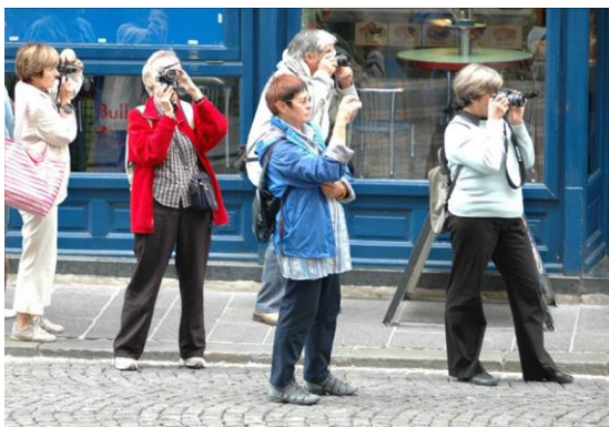
Študijski krožek za fotografijo, UTŽO Ljubljana