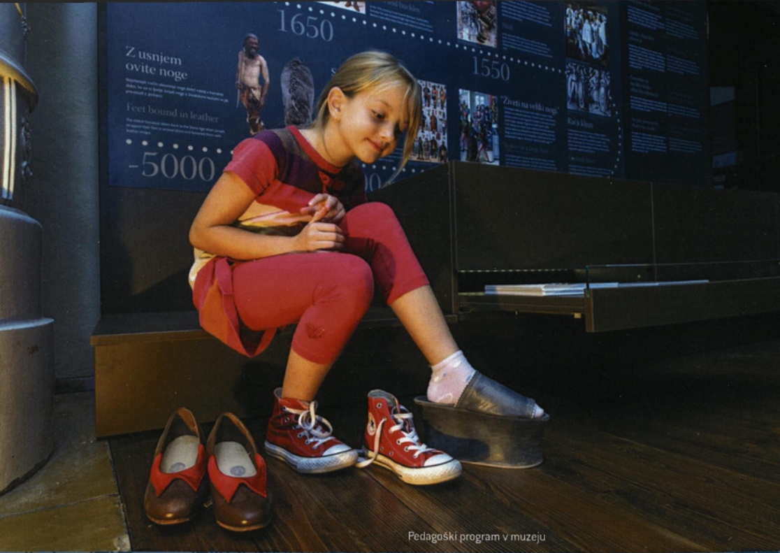
Pedagoški program v muzeju