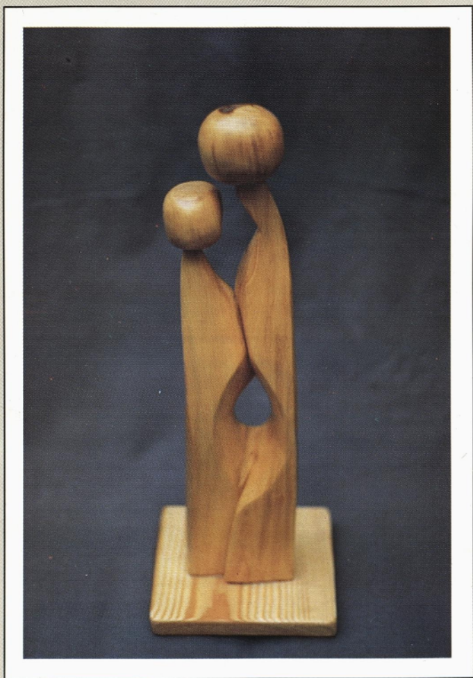
Dvojica, les, 1991