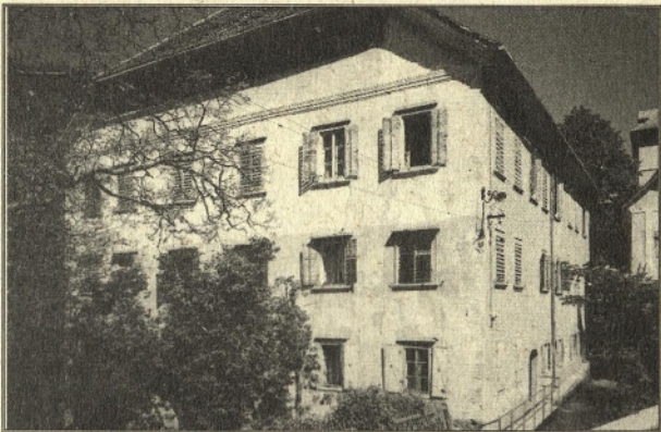
Zgornja kajža - stavba, ki jo je muzejsko društvo pridobilo l. 1955 in v njej uredilo svoje prve zbirke.

Muzejsko društvo je vzkliklo in delovalo v času vsesplošnega entuziazma na eni, in močno omejenih realnih možnosti za uresničitev obsežnih načrtov, na drugi strani. Leta 1964 je njegove uspehe in žulje podedoval Tržiški muzej, zato smo ob petdesetletnici organiziranja naših predhodnikov dokumentirali društveno zapuščino in raziskali, kdo so bili ljudje, ki so ustanovili muzej in se jim na ta način zahvalimo v imenu vseh domačinov.