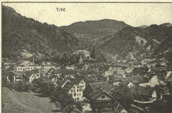
Področje delovanja Društva prijateljev Tržiškega muzeja l. 1952 je bilo območje mestne občine Tržič.

Društvo prijateljev Tržiškega muzeja je zraslo iz muzejske sekcije Turističnega društva Tržič l. 1952. Njegovo poslanstvo je bila ustanovitev Tržiškega muzeja, kar mu je po dvanajstletnem prizadevanju tudi uspelo.