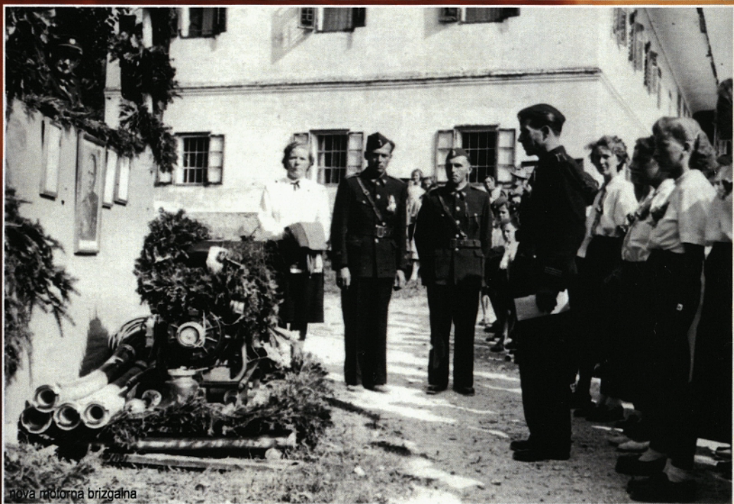
nova motorna brizgalna