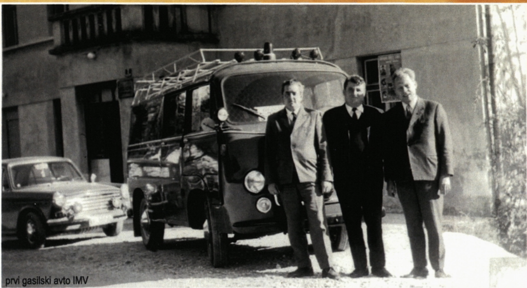
prvi gasilski avto IMV