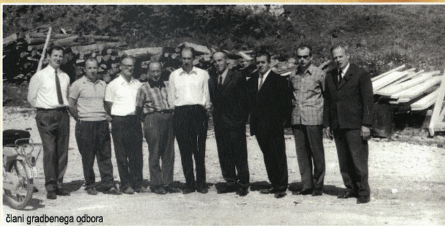
člani gradbenega odbora