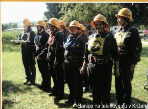
članice na tekmovalju v Križah