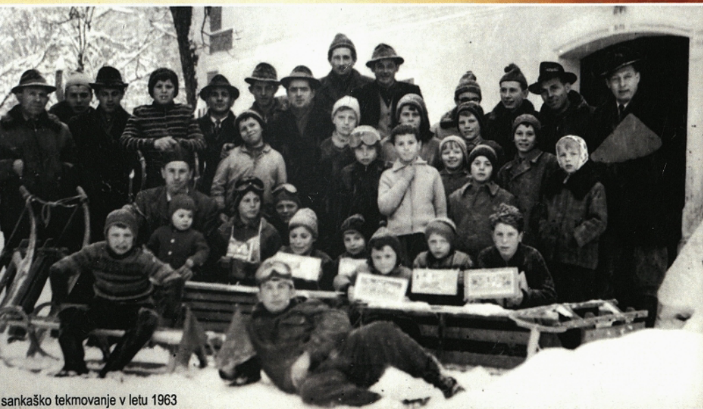
sankaško tekmovanje v letu 1963