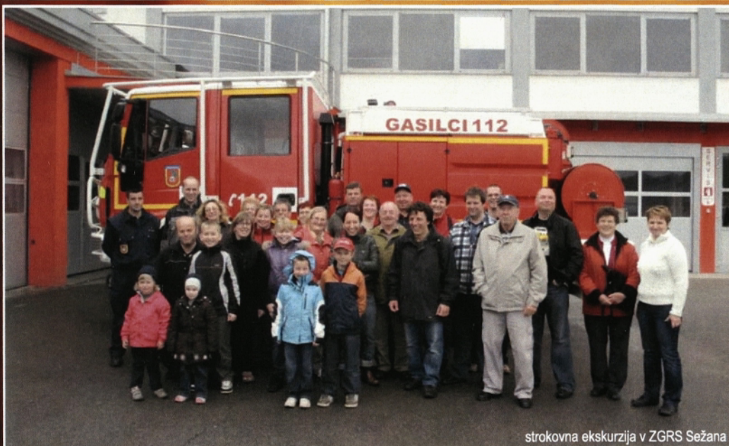
strokovna ekskurzija v ZGRS Sežana