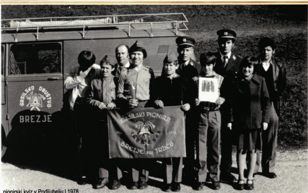
pionirski kviz v Podljubelju I.1978