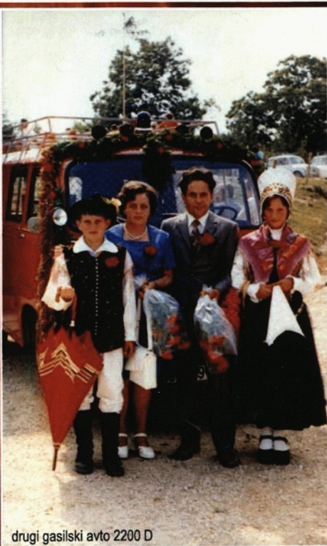
drugi gasilski avto 2200 D