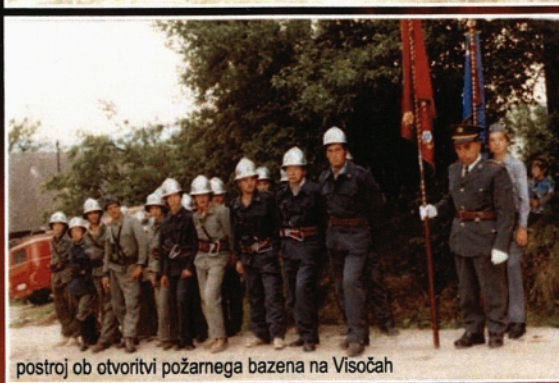
postroj ob otvoritvi požarnega bazena na Visočah