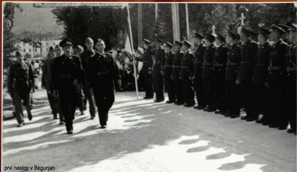
prvi nastop v Begunjah