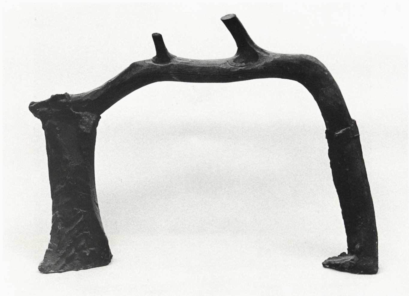
iz cikla conceptus vividus les, beton 1985 54 x 70 x 14 cm