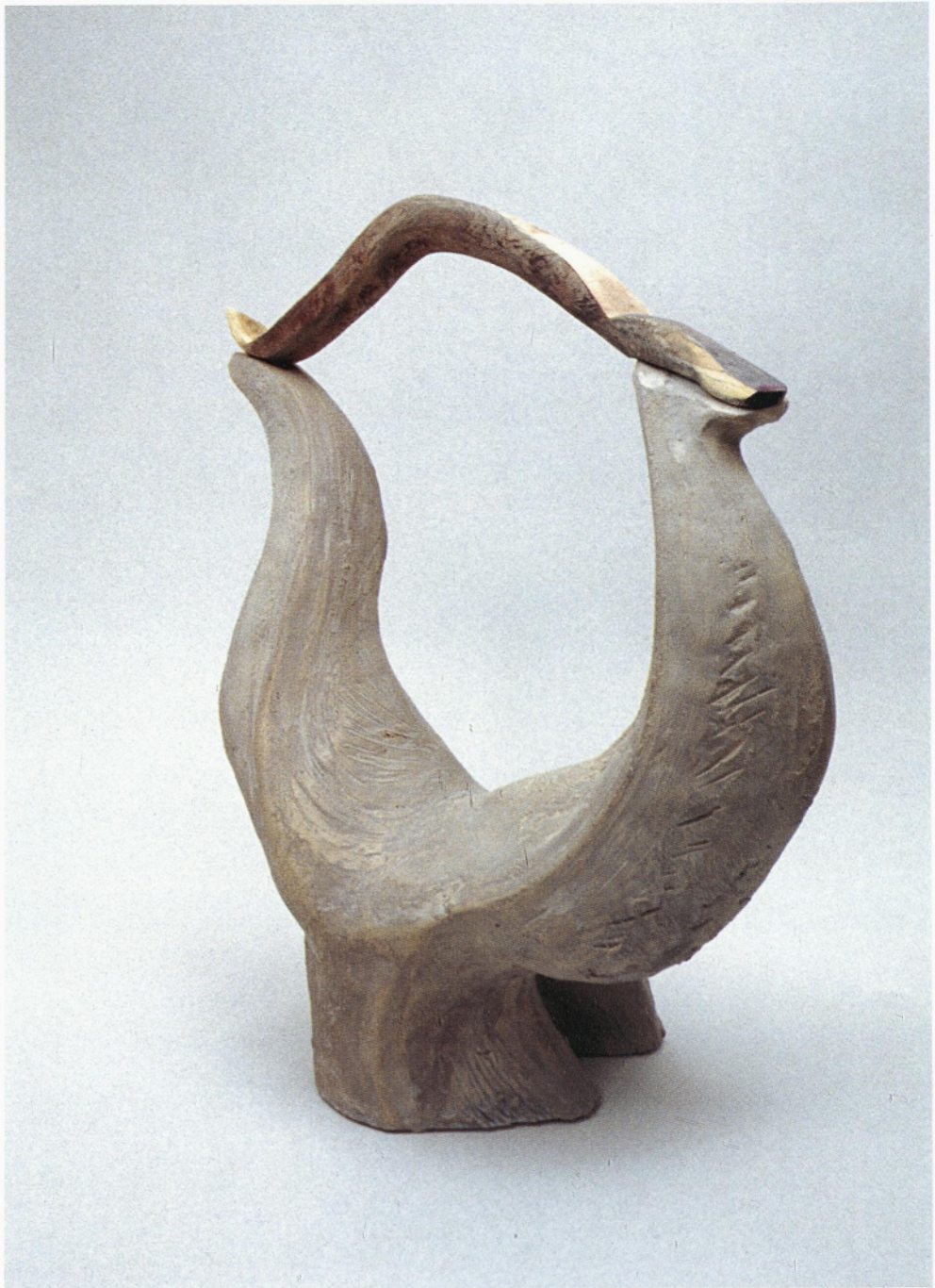
iz cikla conceptus vividus les, žgana glina 1995 45 x 41 x 21 cm