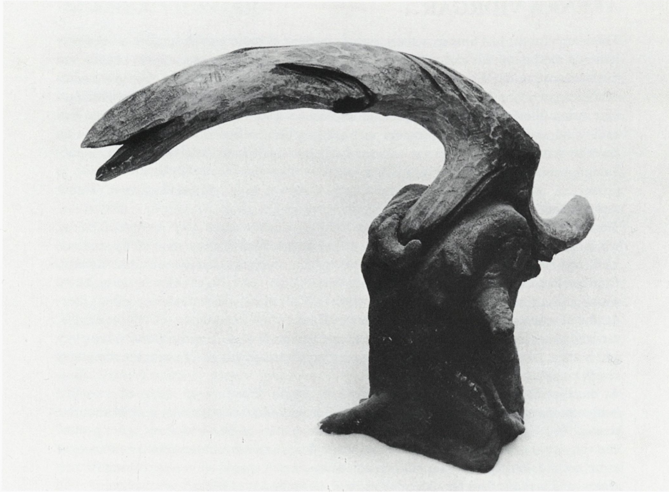
iz cikla conceptus vividus les, beton 1985 46 x 50 x 18 cm