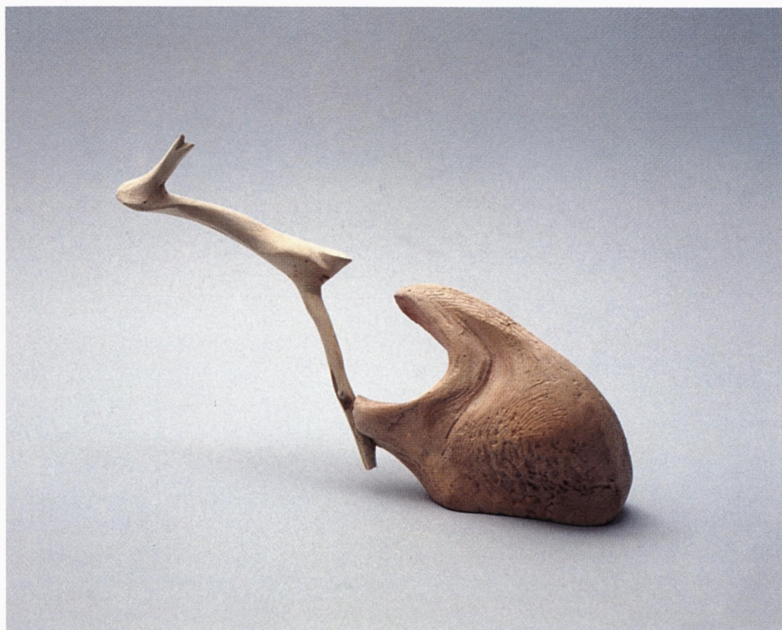
iz cikla conceptus vividus les, žgana glina 1995 12 x 17 x 7 cm