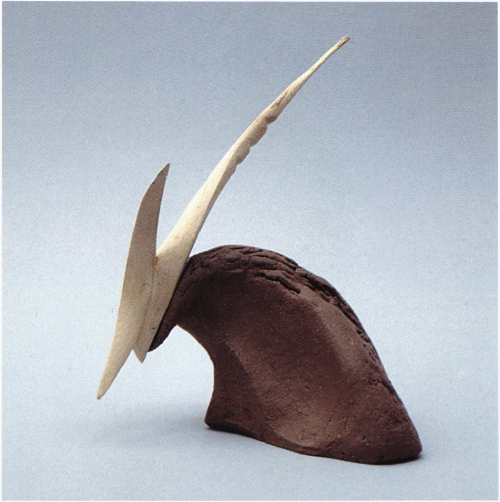
iz cikla conceptus vividus les, žgana glina 1996 15 x 13 x 9 cm