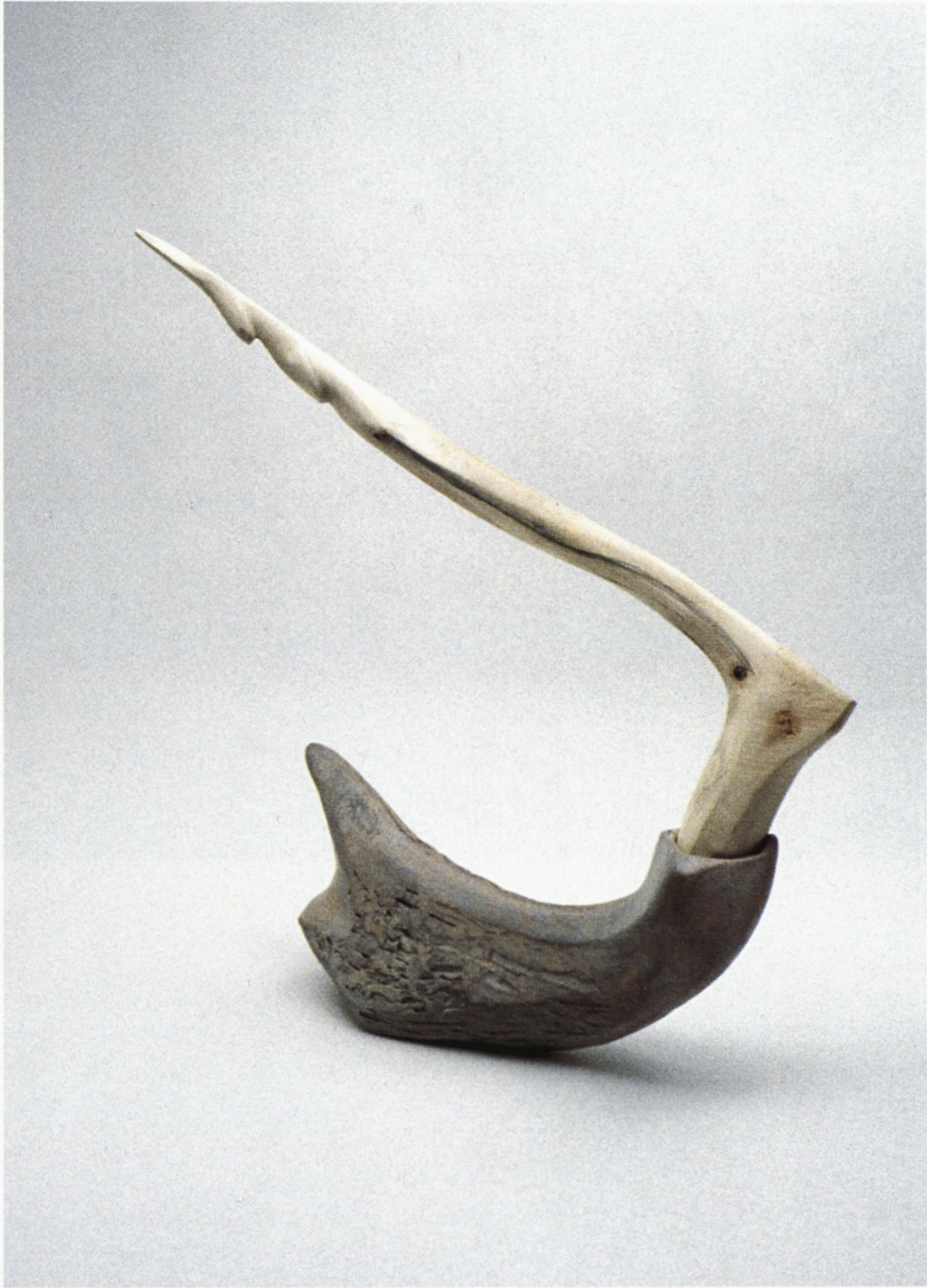
iz cikla conceptus vividus les, žgana glina 1995 49 x 41 x 13 cm