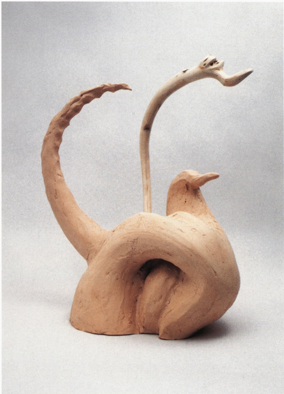
iz cikla conceptus vividus les, žgana glina 1996 53 x 45 x 26 cm