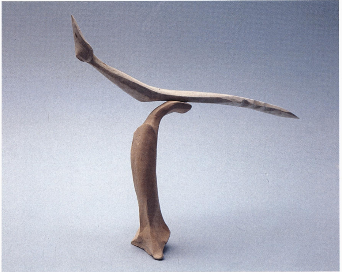
iz cikla conceptus vividus les, žgana glina 1995 17 x 19 x 5 cm