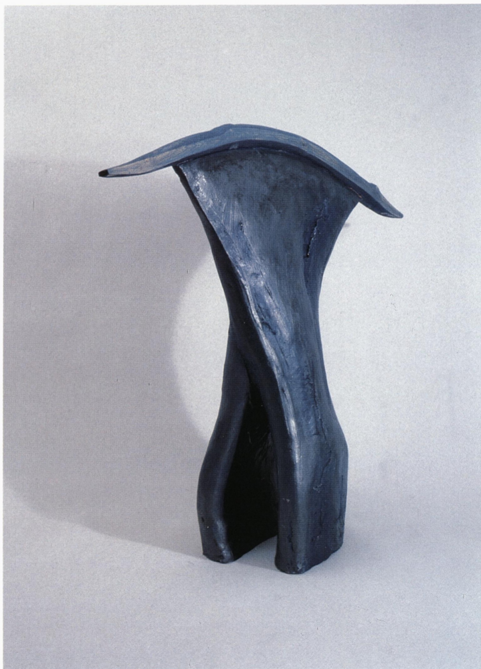
iz cikla conceptus vividus les, grafit, žgana glina 1995 51 x 57 x 16 cm