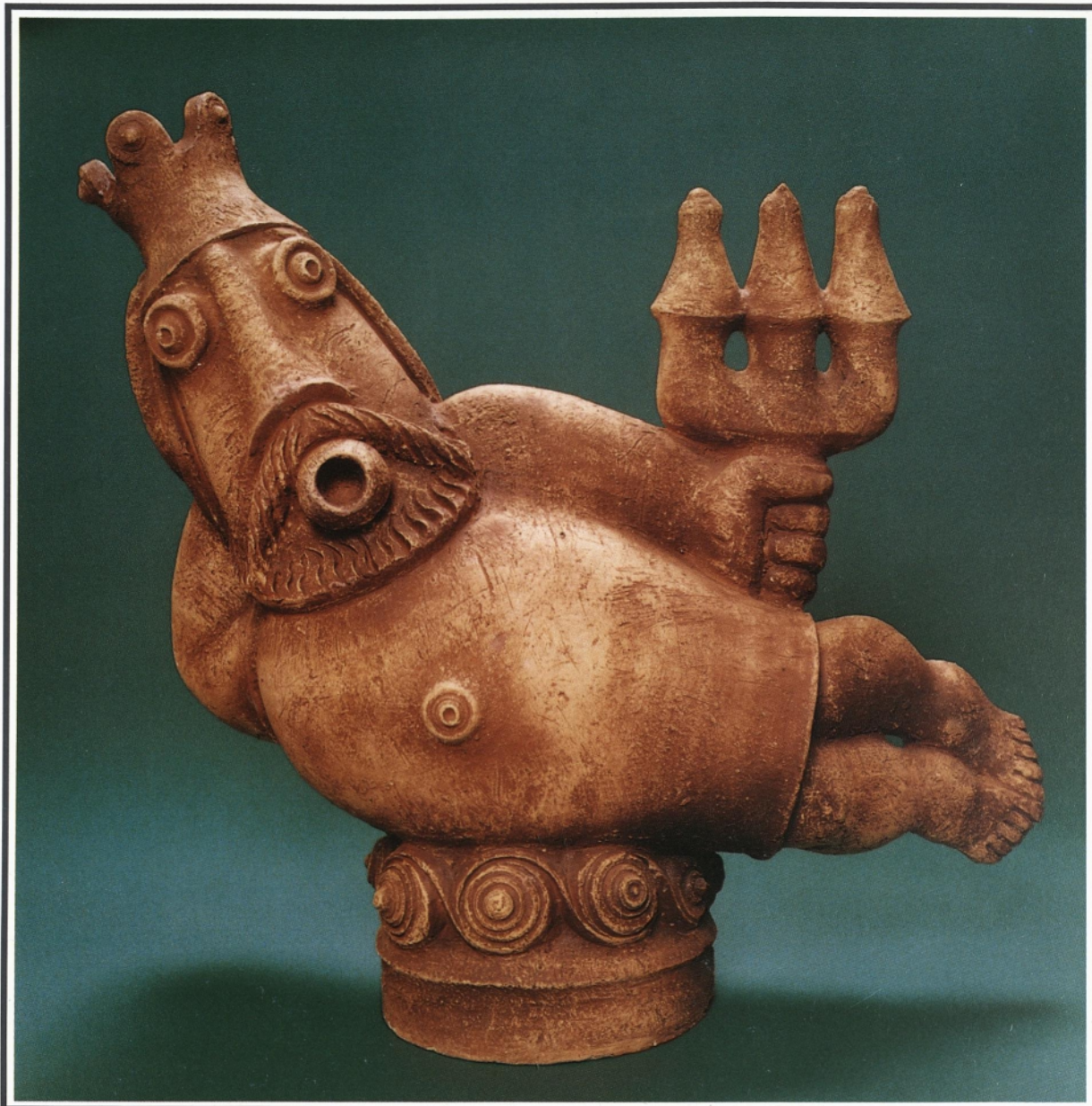
POSEIDON 1990, šamot z glinenim premazom, višina 65cm, privatna lastnina