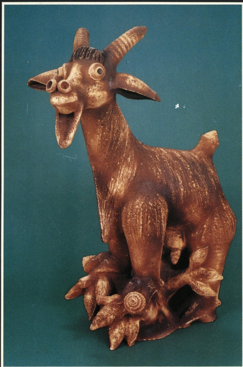
KOZA 1993, šamot s premazom, 88cm, privatna lastnina