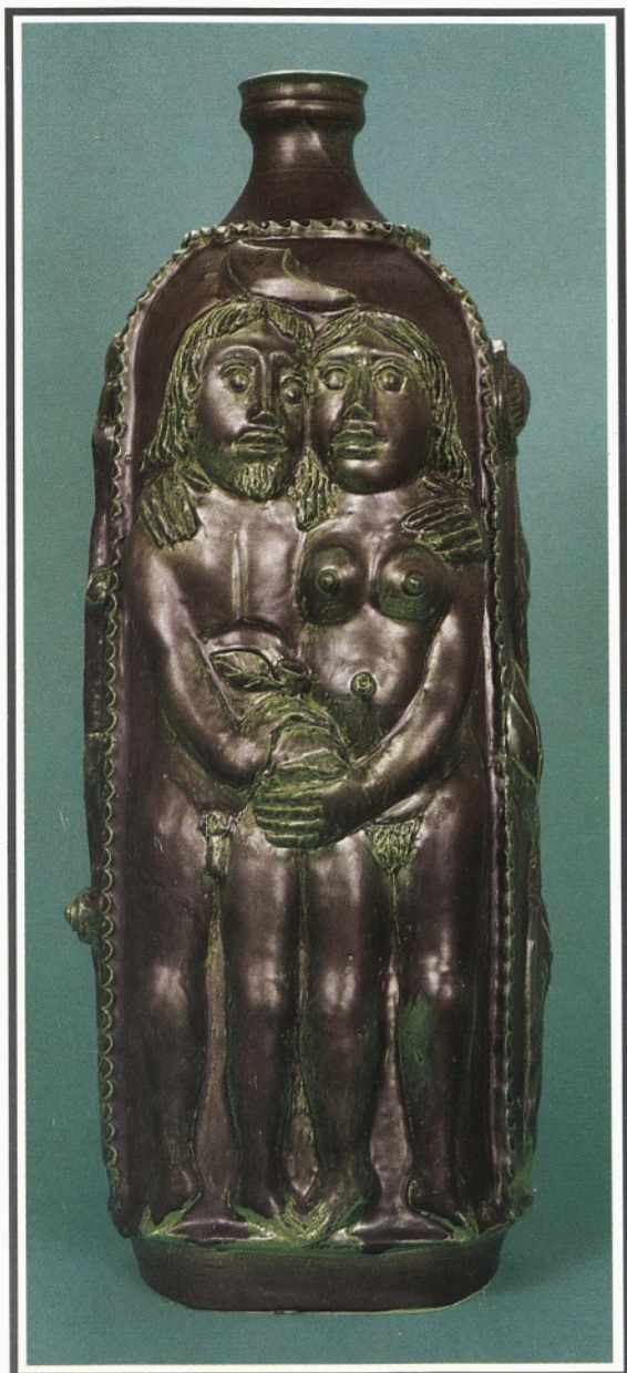
ADAM, EVA VRČ 1993, keramika z gornjim premazom, višina 55cm, privatna lastnina

ÁDÁM, ÉVA KORSÓ 1993. Matt fedőmázazs kerámia, magassága: 55cm. Magántulajdon