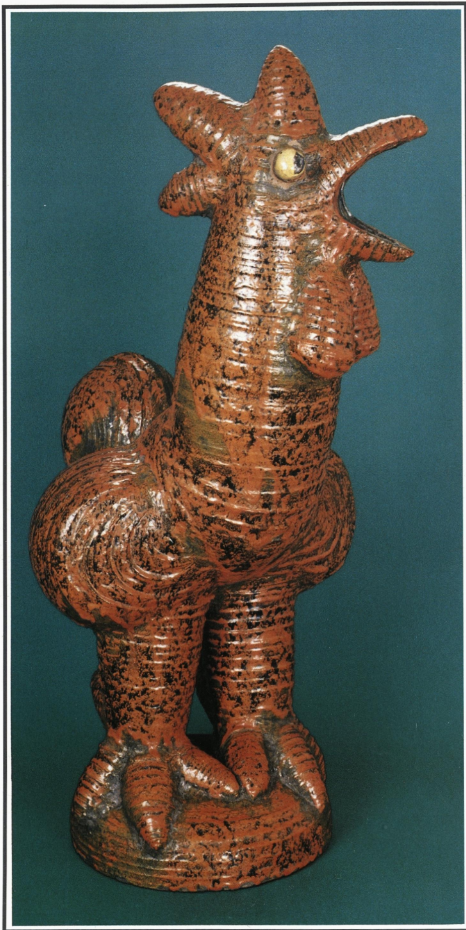
PETELIN 1959, keramika z gornjim premazom, višina 78cm, last Muzeja za oblikovanje