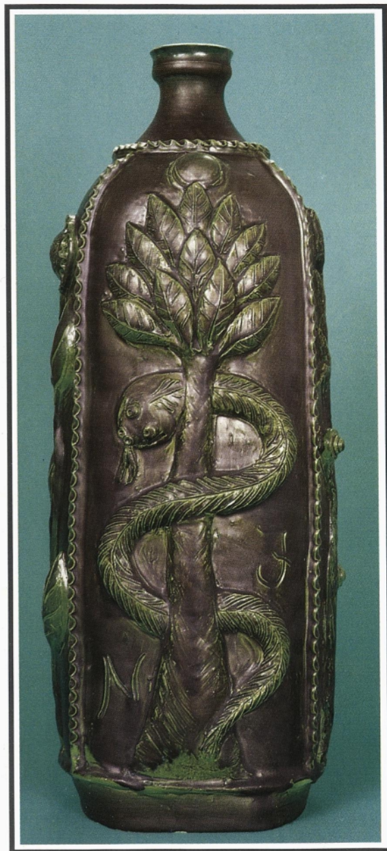
ADAM, EVA VRČ, hrbtna stran DREVO S KAČO

ÁDÁM, ÉVA KORSÓ 1993. Matt fedőmázazs kerámia, magassága: 55cm. Magántulajdon