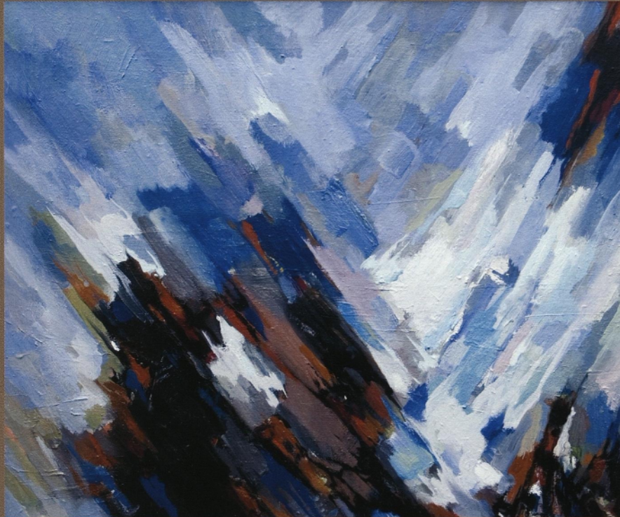
La Tache VIII., 1980, olje na platno, 80 x 100 cm

skladen red razmeščene likovne prvine tvorijo vtis prostora. Raznoliki elementi se zlivajo v enovit avtorski kozmos, med osrednjim predmetnim motivom in nepredmetnim ozadjem vlada harmonija. Likovna napetost je pogosto pogojena s svojevrstno analitično razčlemba motiva in postavitvijo iluzijsko določene figure v igriv splet barvnih ploskev, ki se zaradi temnejših kontur približujejo videzu vitraža. Pretanjeno usklajevanje barvnih mas, lis in ploskev je prisotno tudi pri zadnjih slikarjevih abstraktnih kompozicijah.