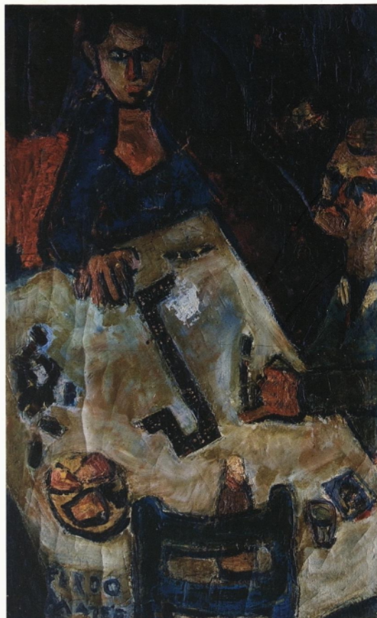
6. Duo-Domino, 1954, olje na platno, 116 x 72 cm