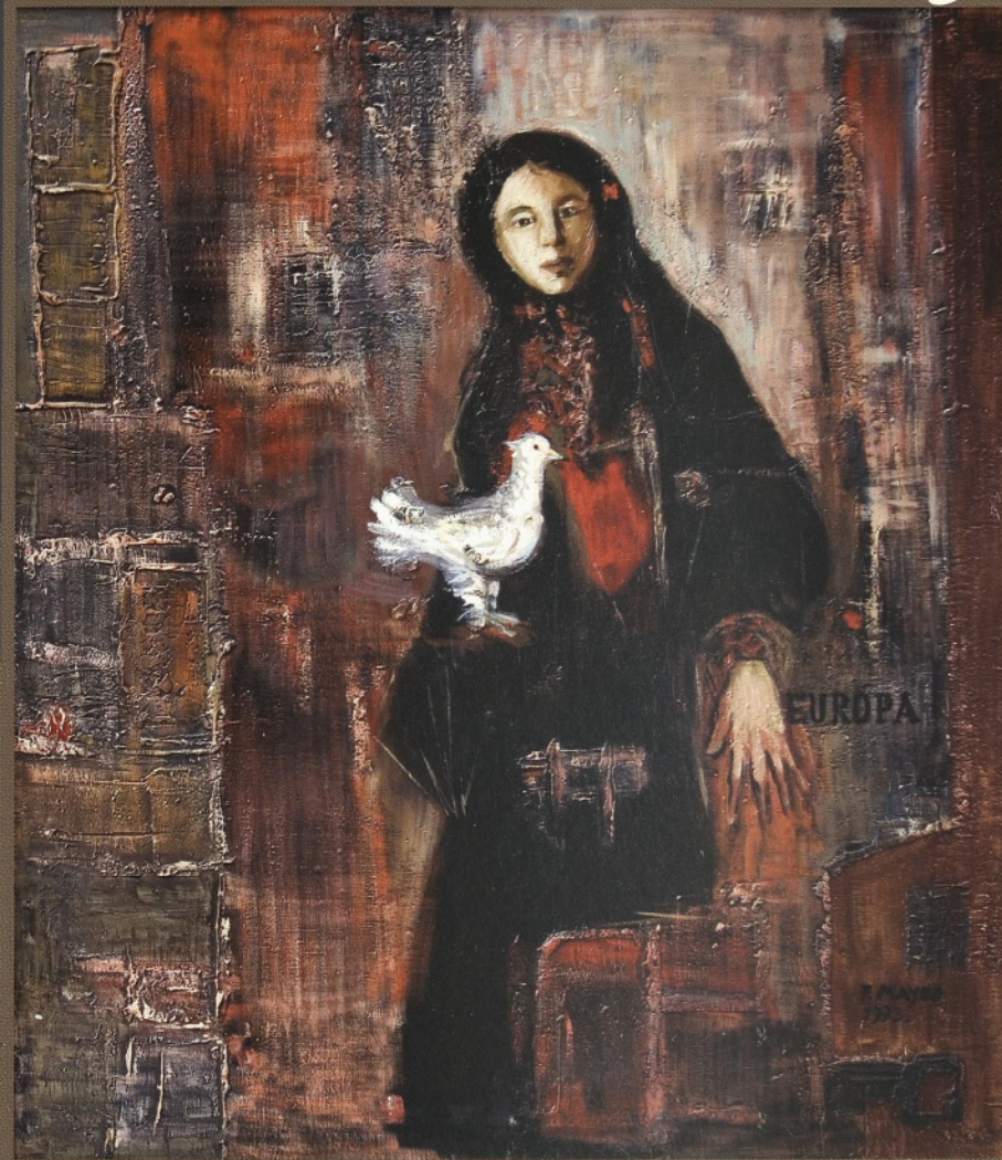
Evropa, 1973, olje na platno, 160 × 140 cm

zrelem ustvarjalnem obdobju Ferda Mayerja lahko sledimo zapovrstnim prebijanjem med abstraktnim likovnim jezikom in konkretno likovno pripovedjo ter iskanjem njune sinteze. Izbiro slikarskega pristopa, s katerim je Ferdo Mayer želel predstaviti videnje in občutenje sveta, je narekovala notranja ustvarjalna nujna. Izbajal je iz lastne narave, ki se je odrazila tudi v ustvarjalnem preoblikovanju motivov, na primer v stilizaciji in odstranitvi odvečnih elementov, v barvnem prevrednotenju na realistični pristop vezanih pejsažev in vedut. V trenutkih ustvarjalne napetosti in predavanja ustvarjalnemu zagonu ga je pritegnil abstrakten slikarski rokopol, medtem ko so realistični motivi pričali o bolj umirjeni, lirični plati slikarjevega značaja. Z Mayerjevo težnjo po odražanju lastne in zunanje narave si lahko pojasnimo nenadne preobrate v motiviki in formalnem pristopu k njeni slikarski obdelavi. Navkljub izbiri modernističnih likovnih prvin in prijemov je Ferda Mayerja zanimala zgolj po estetskih zakonitostih urejena kompozicija. Pri nepredmetnih in deloma pri predmetnih podobah so prisotni odmevi vsaj treh oblik abstraktnega slikarstva (lirična abstrakcija, abstraktni ekspresionizem in informel). Vebementni nanosi barv s čopičem ali slikarsko lopatico, široke poteze, bogate teksture, strukturna in večplastna gradnja bapitično občutenih slikanih površin spominjajo na informelovsko obdelavo. Ferdo Mayer se nikoli ni odpovedal iluzionistični funkciji slikovnega polja.