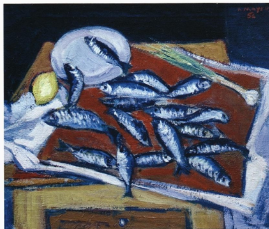
Tihožiče z ribami, 1954, olje na platno, 58 x 62 cm