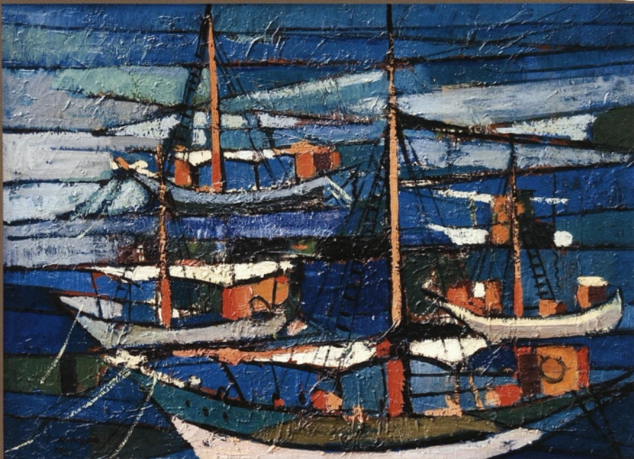
Jadrnice, 1957, olje na platno, 75 × 100 cm