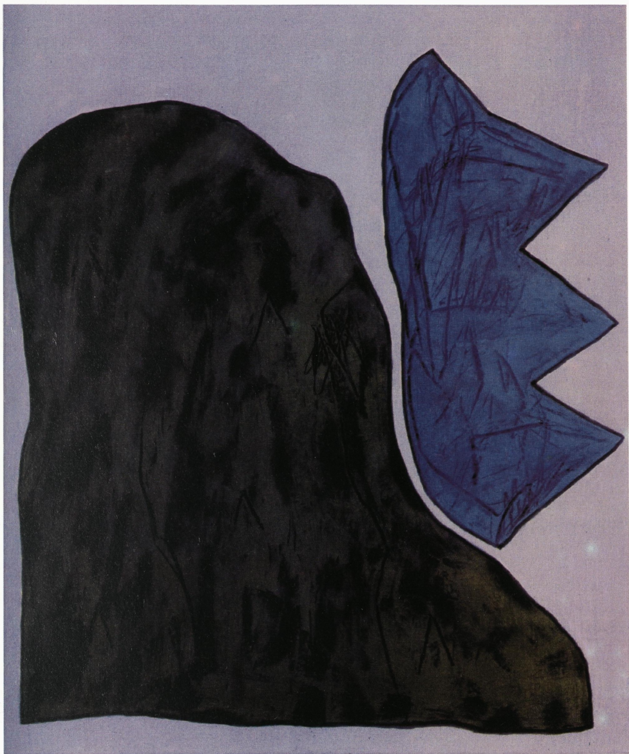
OBČR, 1987 olje na platnu /90 X 75 cm/