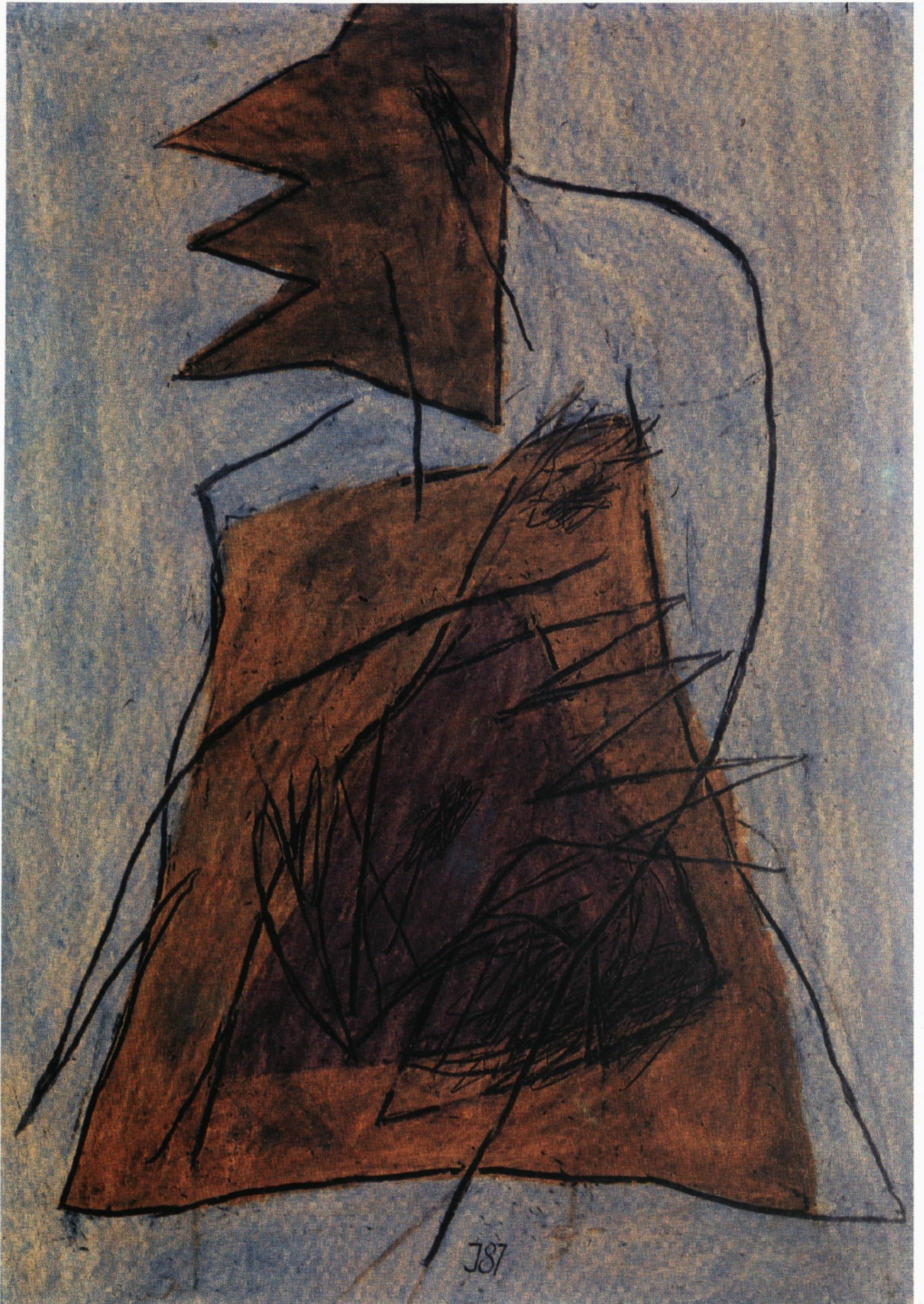
IZRJ VII 87, 1987 mešana tehnika na papirju /100 X 70 cm/