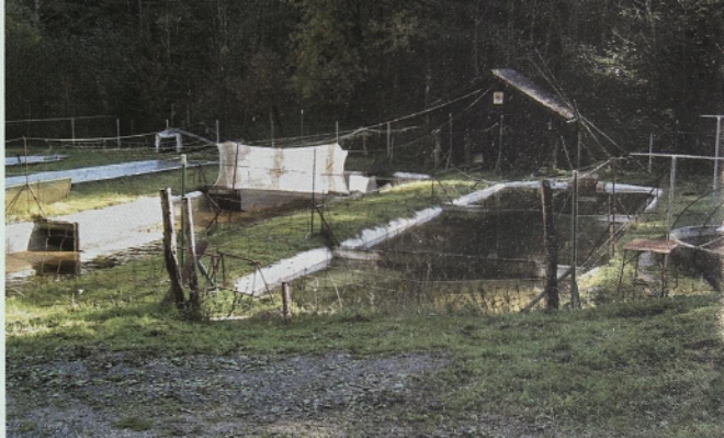
Del vzrejnih bazenov ribogojnice Besnica

Razpolagamo z dokumentom, na katerem so napisani prvi člani upravnega in nadzornega odbora.