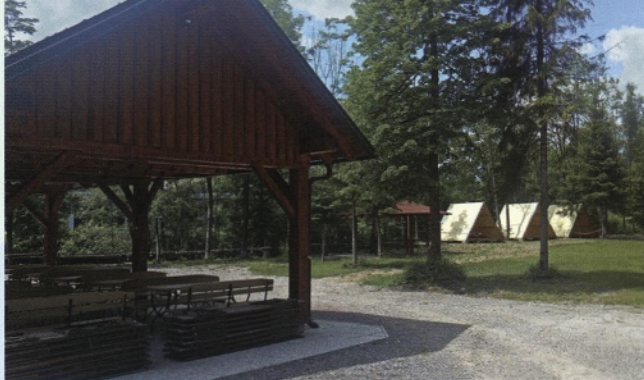
Piknik prostor – desni del z jurčkom in šotori

in turisti. Tudi stalež sulca v Savi je visok, zaradi česar smo pred nekaj leti povečali letno kvoto uplena sulca, letos pa smo dvignili še najmanjšo lovno mero. Z omejitvijo uplena potočnice in lipana želimo povečati njun stalež. Rezultati so vidni, saj so beleženi ulovi spoštljivih dolžin.