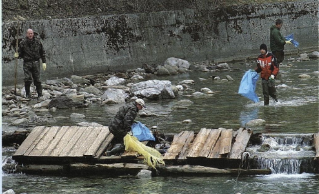
Čistilna akcija na reki Bistrici

Sedanje in preteklo isto vodstvo RD, ki jo vodi upravni odbor, si je zadalo nalogo, da izvede vsa zgoraj opisana dela in po preteku tega mandata preda vodenje mlajši generaciji, ki bo znala in imela dovolj energije za realizacijo zastavljenih ciljev v dobrobit naravi, okolju, društvu in širši populaciji našega ribiškega okoliša.