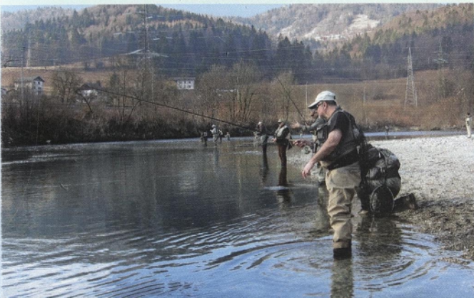
Prvi ribolovni dan 2016 na Savi v coni »A«

(in tudi med vojno) hude zime z obilico snega. Spomladanske odjuge pa so z hudourniškimi visokimi vodami dodatno preprečevale hitrejši razvoj rib v vodotokih. Po letu 1955 so se vode toliko opomogle, da je bil dovoljen v omejenem obsegu tudi športni ribolov. Stalež rib v Tržiški Bistrici in Mošeniku se je začel hitro povečevati z intenzivnim poribljavanjem iz ribogojnice Besnica. V 80. letih je bilo v Savi rib, da »so pokonci stale«. Predvsem lipana je bilo obilica. Žal je prihod kormorana v naše kraje dodobra izpraznil naše vode. Prav ribogojni ekipi gre zahvala, da so naše ribolovne vode zopet polne. V ponos nam je tudi gensko čista potočna postrv v zgornjem toku Mošenika – morda zaklad za naše zanamce.