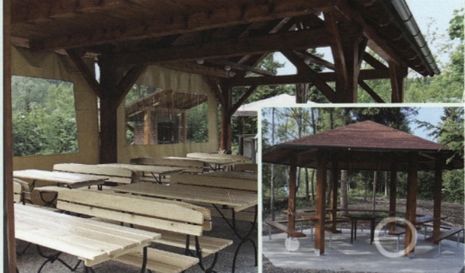
Nova podoba nadstreška za piknike v ozadju kamina in paviljon