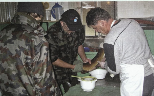
Smukanje iker potočnih plemenk