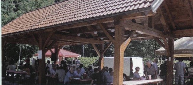
Piknik članov konec avgusta 2015

... in predpriprave na piknik – delovna ekipa