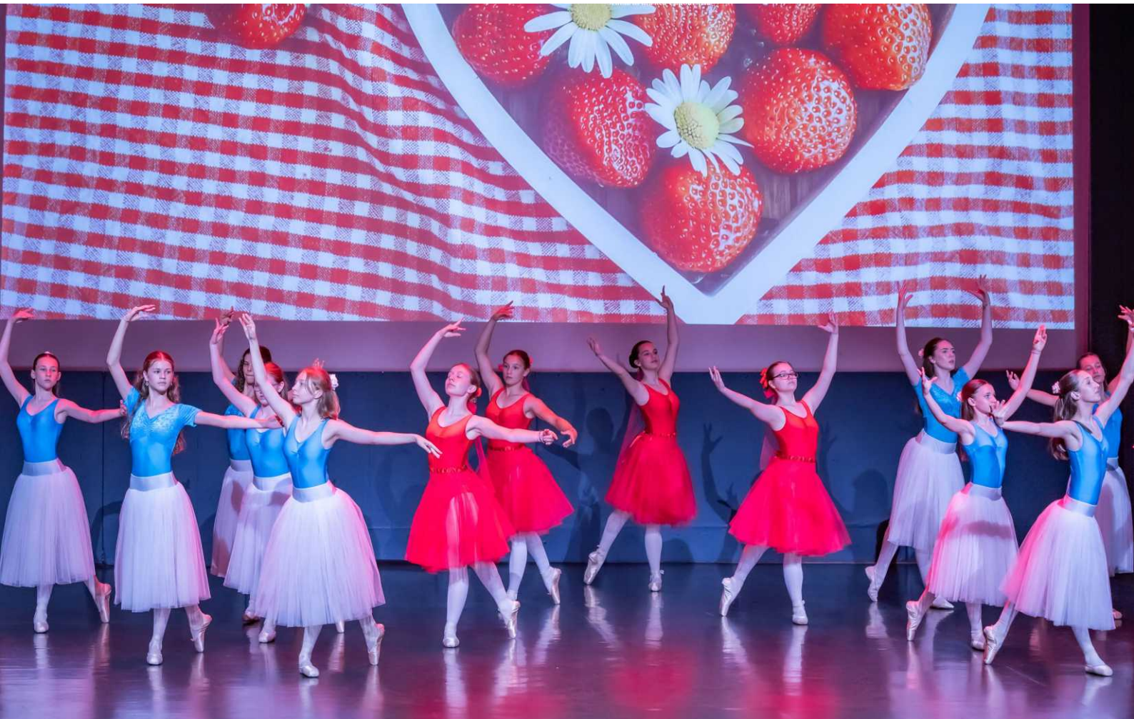
Baletni nastop v Avditoriju Portorož