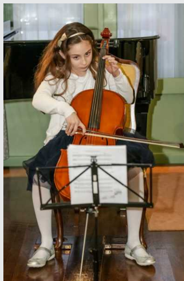
Nastop najmlajših učencev Glasbene šole Koper - podružnice Izola