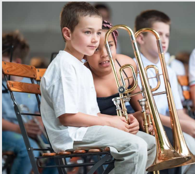
Zaključni nastop učencev trobil in tolkal KIP

vodi ravnatelj. Strokovni kolegij sestavljajo vodje strokovnih aktivov, vodje šol in pomočnika ravnatelja.