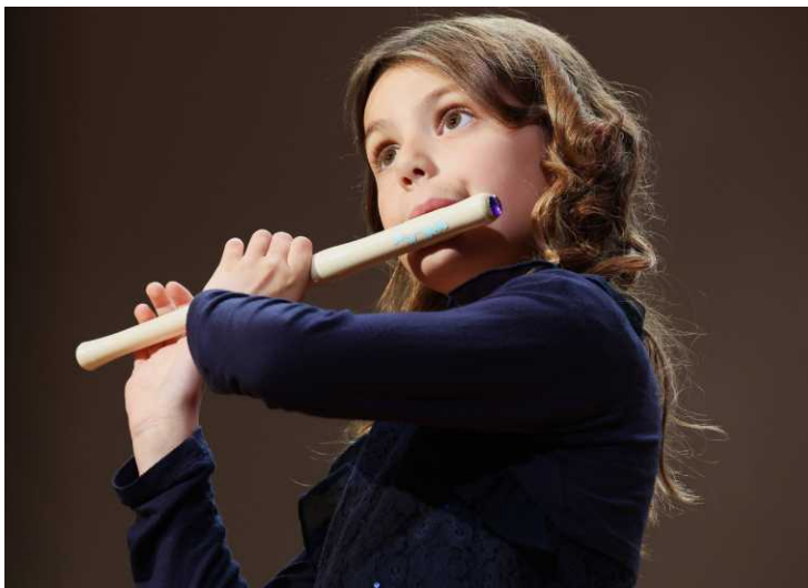
Nastop najmlajših učencev Glasbene šole Koper - podružnice Piran

Razumevanje in izražanje glasbene govornice zahteva ustrezno zbranost. Vzgajanje otrok k poslušanju koncertne glasbe je med prednostnimi cilji šole, zato vas vljudno vabimo na naše nastope. Zahtevnost nastopa stopnjujemo od razrednih, javnih nastopov, nastopov za vrtce in osnovne šole, samostojnih večerov, nastopov na seminarjih učiteljev, srečanjih glasbenih šol, do tekmovanj in koncertov. Najuspešnejši učenci pogosto nastopajo tudi na nastopih izven šole. Hvaležni smo jim za njihovo prizadevnost, saj z glasbenimi točkami, ki so po navadi deležne velikega navdušenja občinstva, utrjujejo ugled naše ustanove v javnosti in popestrijo marsikateri dogodek v našem okolju.