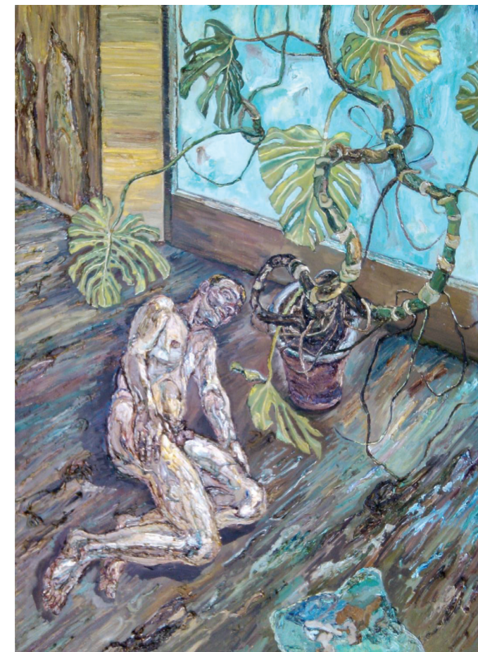
Akt , Olje na platnu 200 x 146 cm, 2012-13