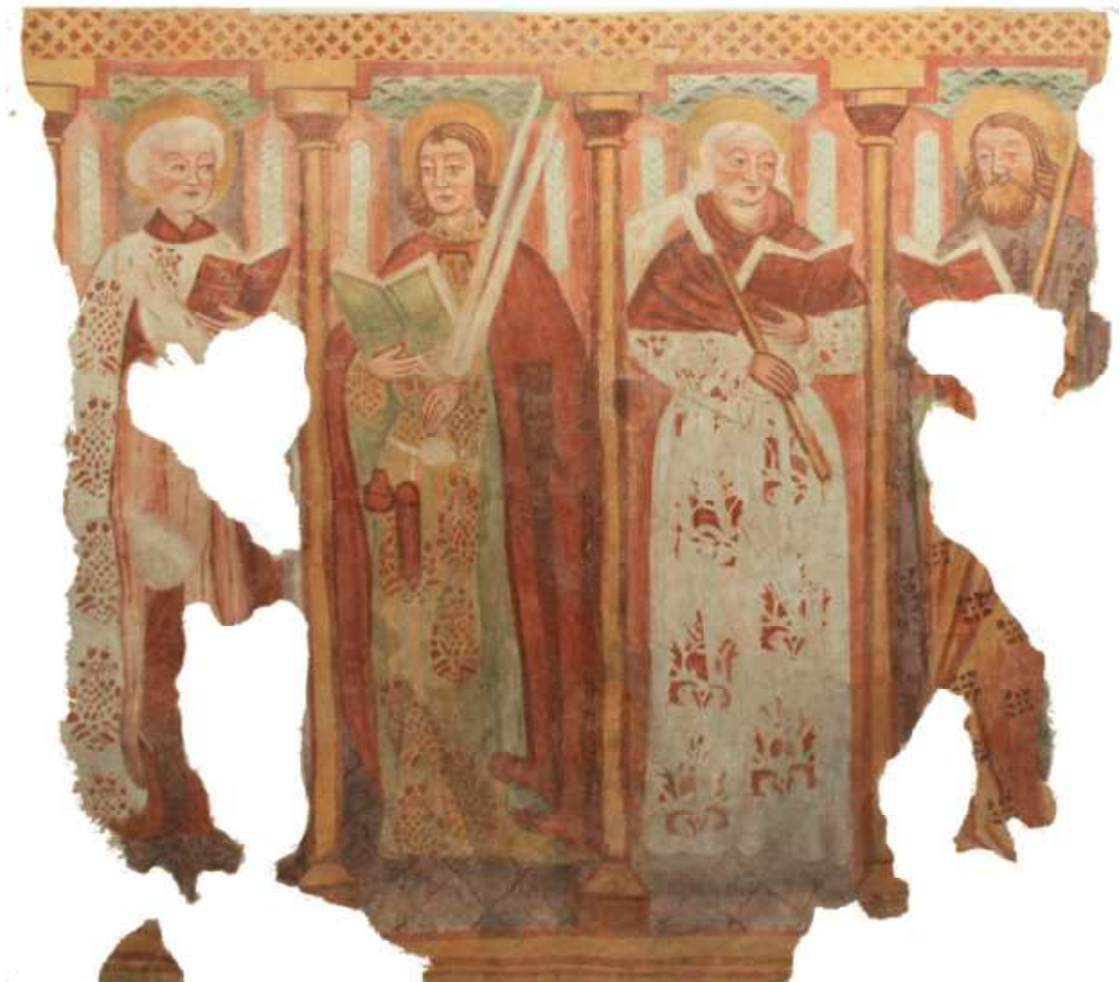
Ohranjena poslikava s figurami apostolov pod oknom na JV steni prezbiterja.