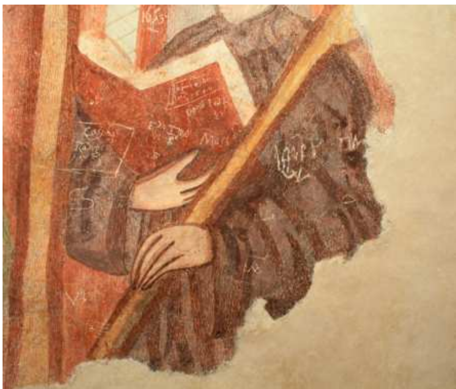
Detajl apostola na V steni prezbiterija med in po retuši.