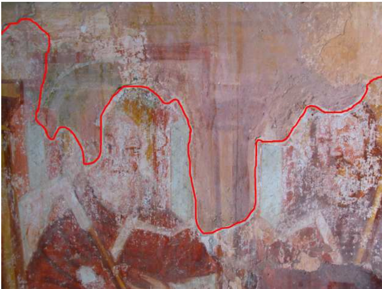
Neustrezno kitanje in retuša Mateja Sternena (nad rdečo črto).

Leta 1911 je slikar Matej Sternen poslikave zasilno restavriral. Freske je le delno odkril, manjkajoče dele je na grobo in nad nivo originalne poslikave pokital, ponekod tudi čez original, ter pokitane dele pobarval z barvami, sorodnimi originalu. Velik del fresk – predvsem v zgornjem delu je ostalo neodkritih.