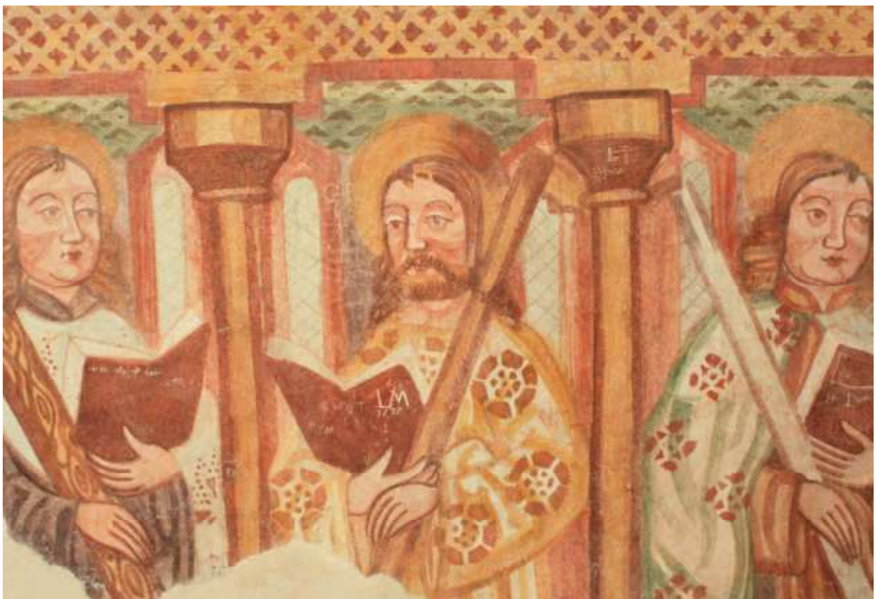
Detajl apostolov pod oknom na V steni prezbiterja pred in po restavratorskem posegu.