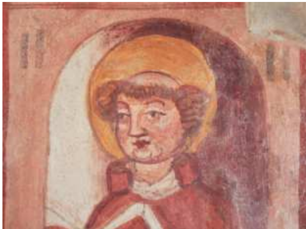
Dopolnjevanje manjših predvidljivih detajlov, detajl svetnika na špaleti okna med in po posegu.