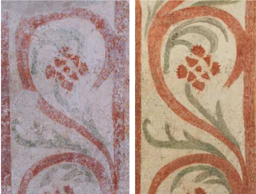
Detajl rastlinskega ornamenta med in po restavratorskem posegu.