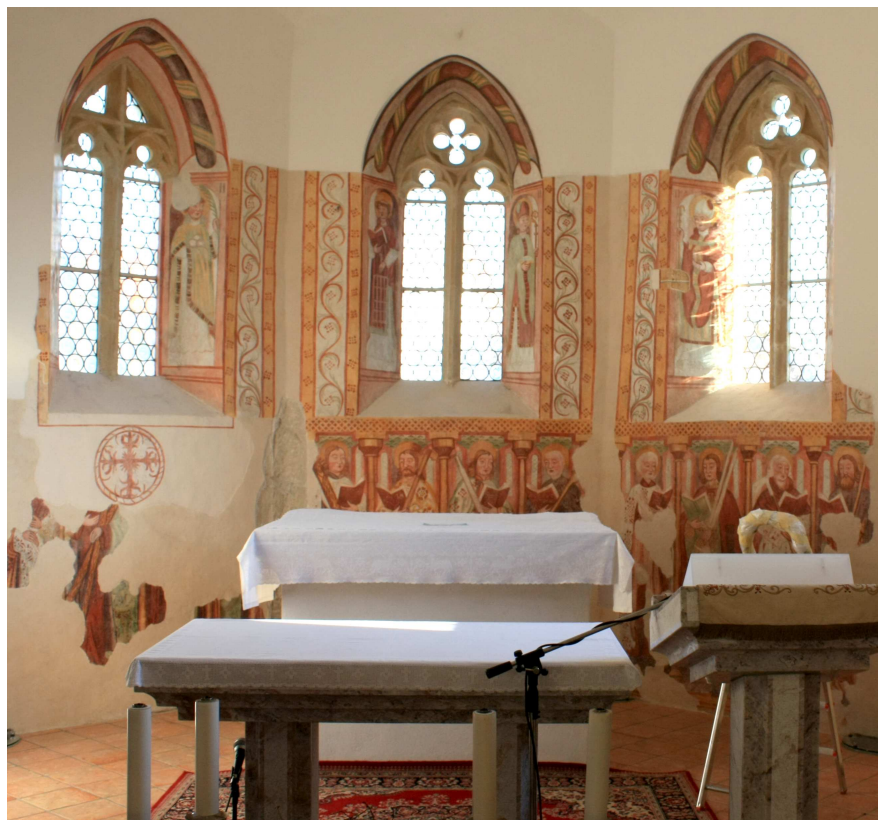
Pogled na prezbiterij pred in po restavratorskem posegu. Vidna neustrezna rumena zasteklitev, ki je barvno moteče vplivala na freske.