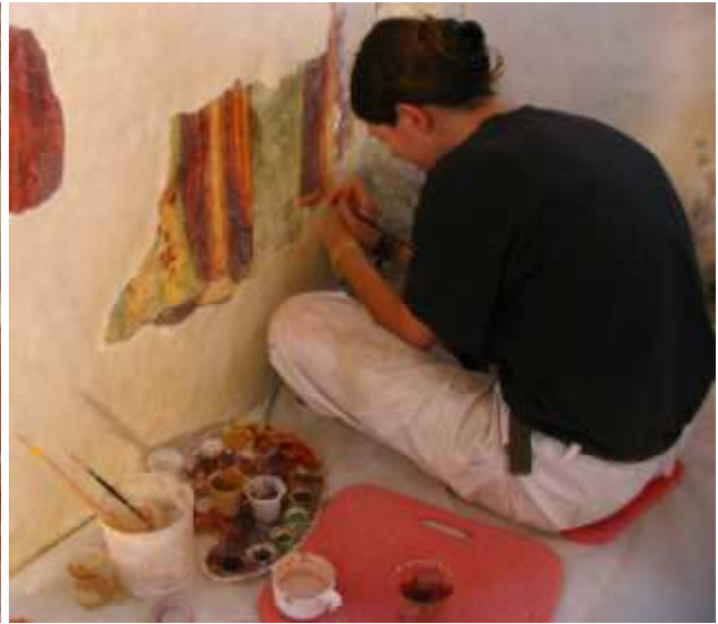
Retuširanje poslikav v tehniki črtkanja.