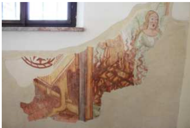
Toniranje na novo narejenih ometov (levo). Tonirani novo narejeni ometi okoli prezentiranih fresk (desno)