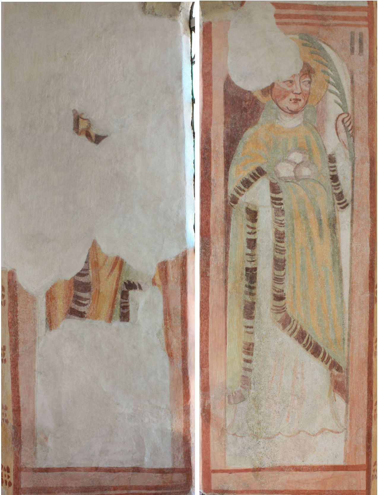
Okenski špaleti SV stene prezbiterija po restavratorskem posegu.