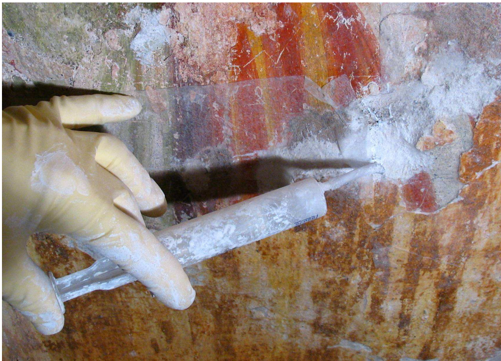
Zaščita barvne plasti z japonskim papirjem je med injektiranjem preprečila razpadanje.

V oktobru 2007 se je izvedla preventivna zaščita stenskih poslikav, saj so bile te na nekaterih mestih v tako slabem stanju, da je omet z barvno plastjo na dotik odpadal. S kitanjem se je na mestih poškodb in odpadlega ometa 'obšivalo' nestabilne dele poslikave, na najbolj ogroženih mestih pa izvedlo tudi injektiranje. S tem so se preprečile nove poškodbe, do katerih bi lahko prišlo pred začetkom konservatorsko restavratorskih posegov v letu 2008.