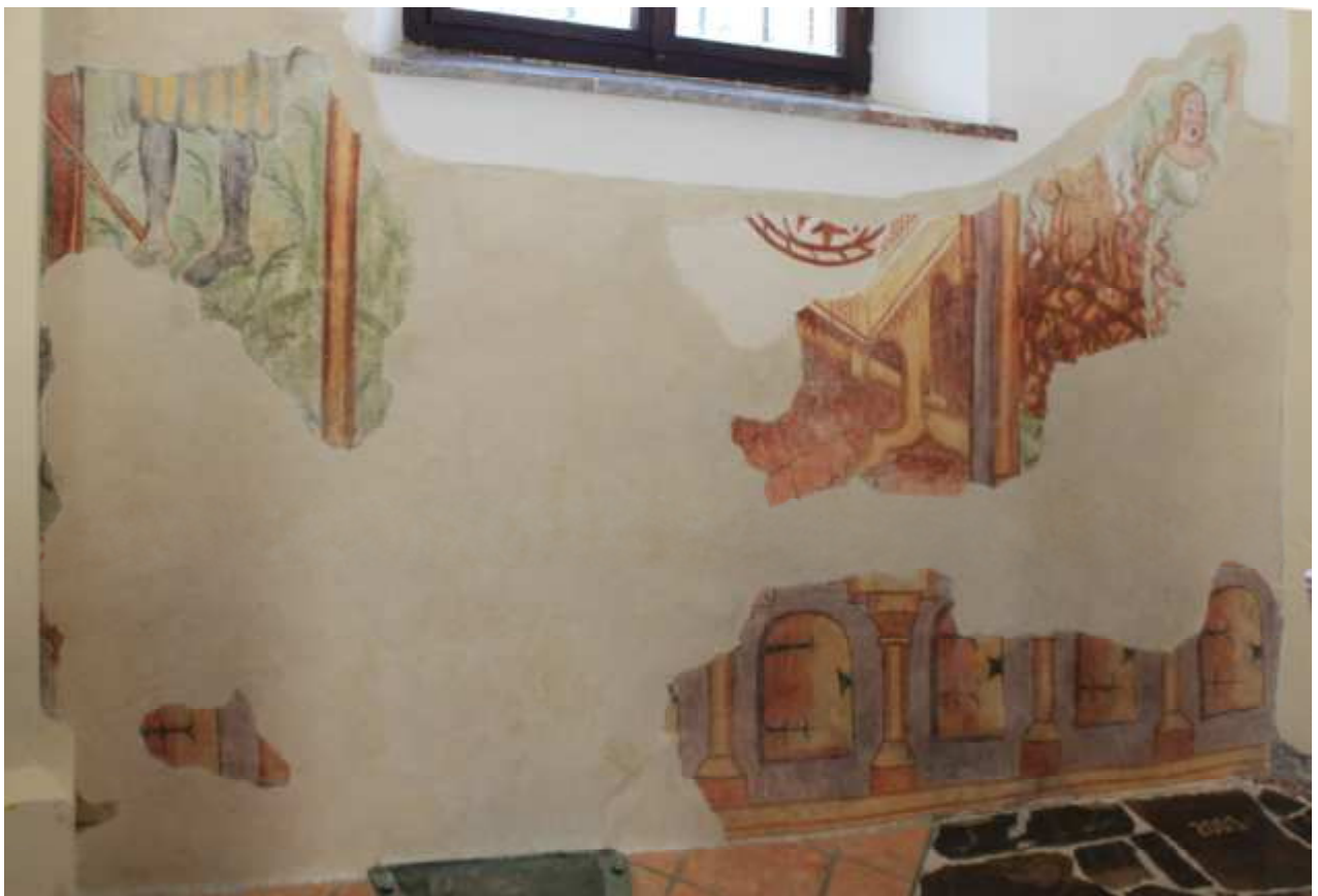
Južna stena prezbiterja med in po restavratorskem posegu.