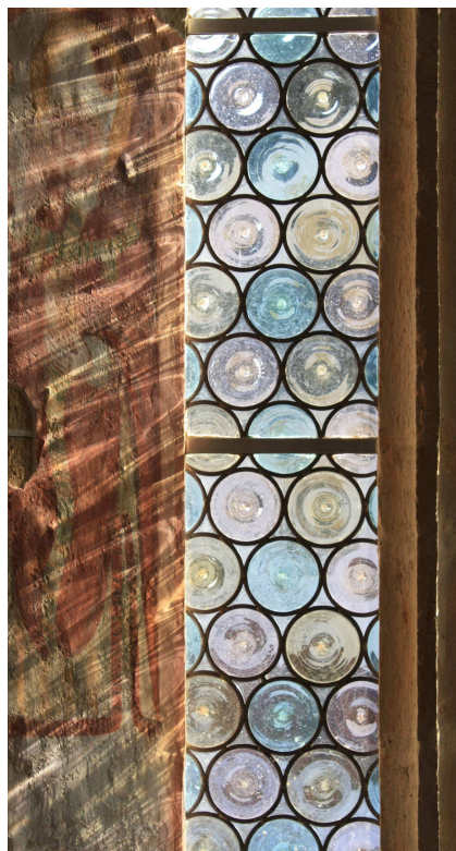
Okno na V steni prezbiterija pred (levo) in po zamenjavi zasteklitve in obnovi kamnitih elementov.