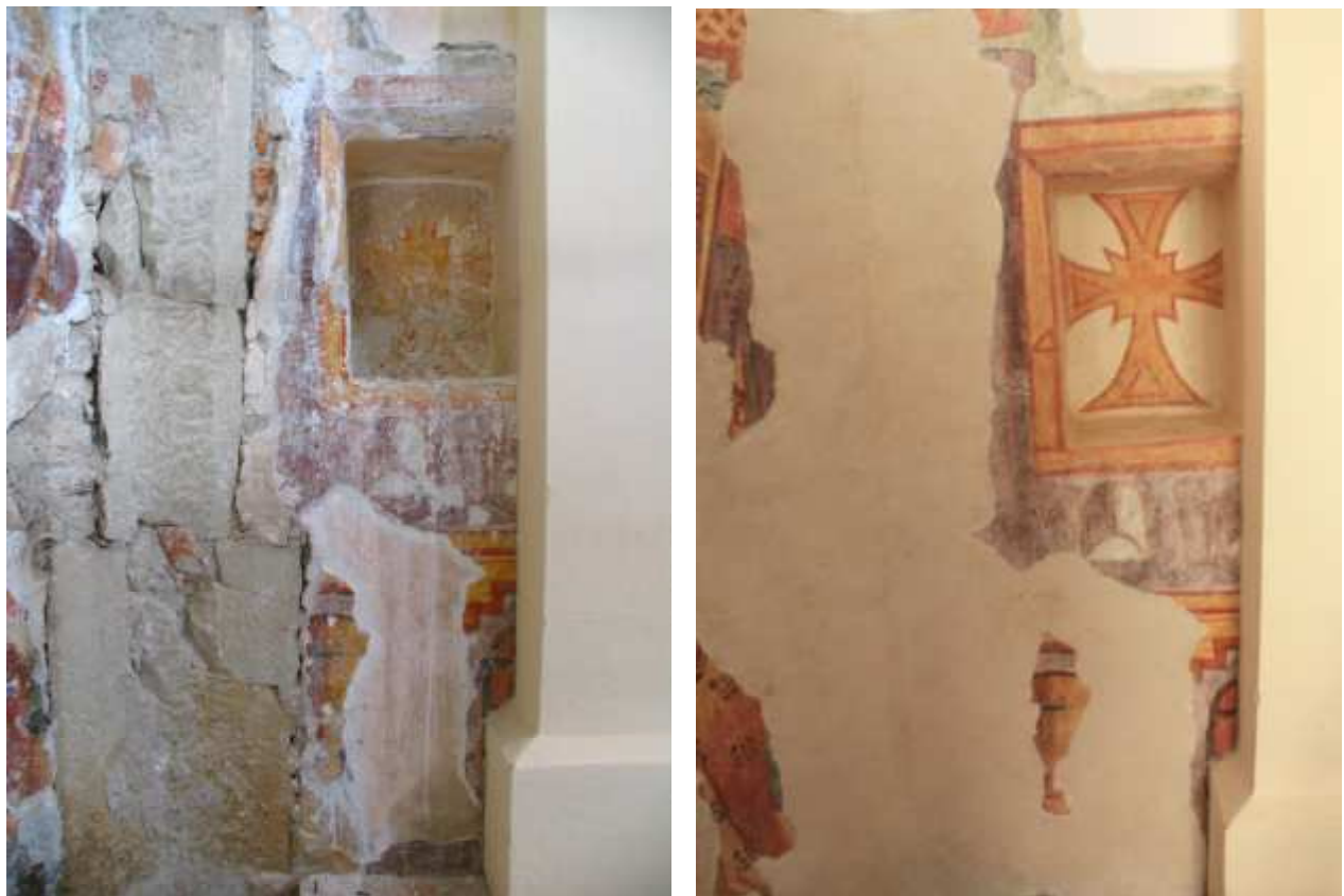
Vogal med V in JV steno med in po restavratorskem posegu.