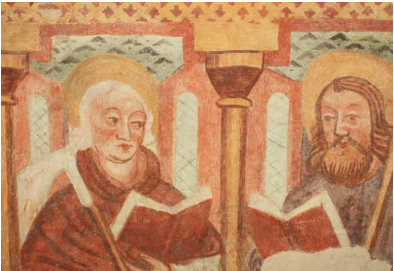
Detajl apostolov pod oknom na JV steni prezbiterja pred in po restavratorskem posegu.