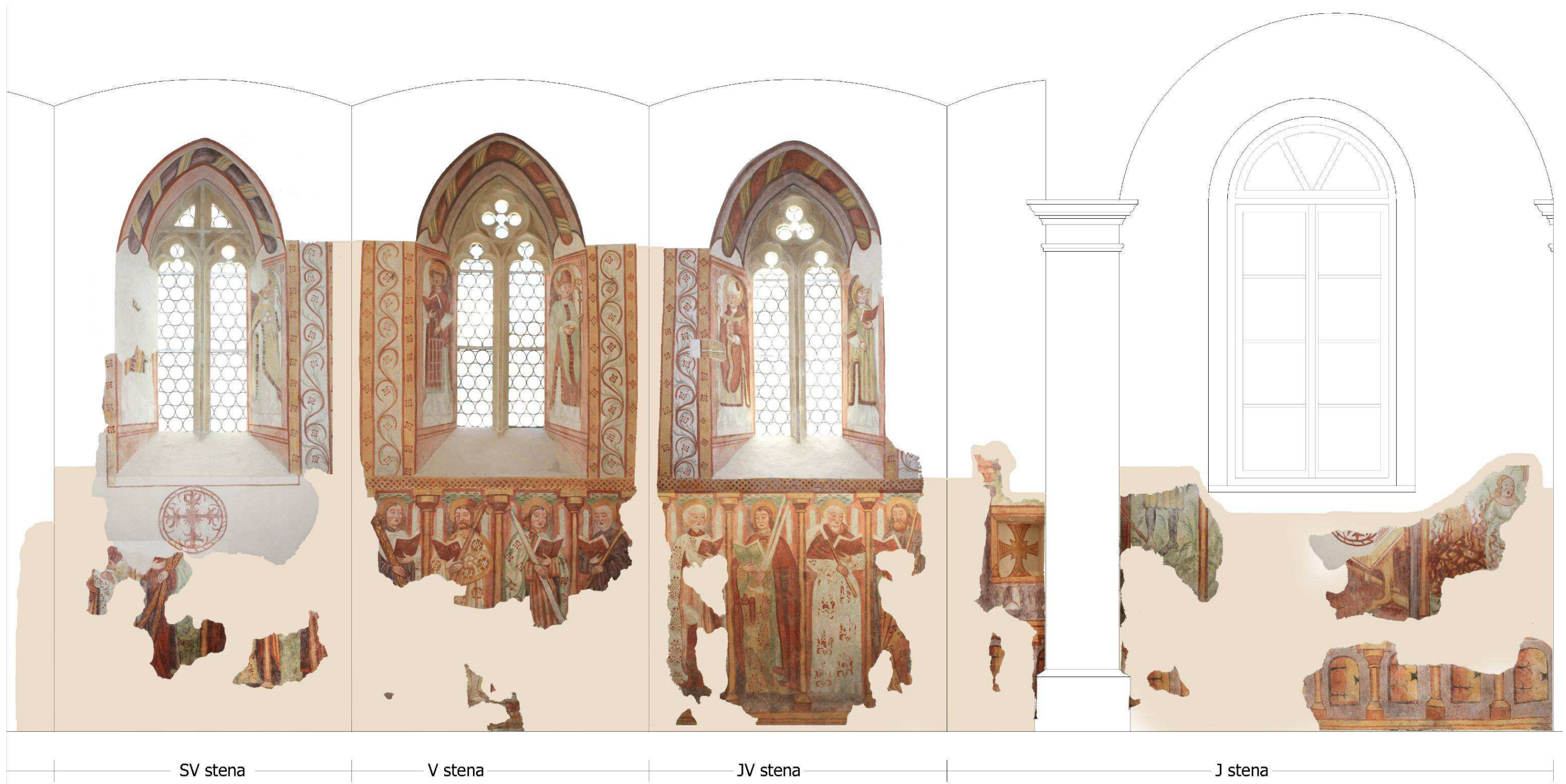
Izris ostenja s prezentiranimi stenski poslikavami