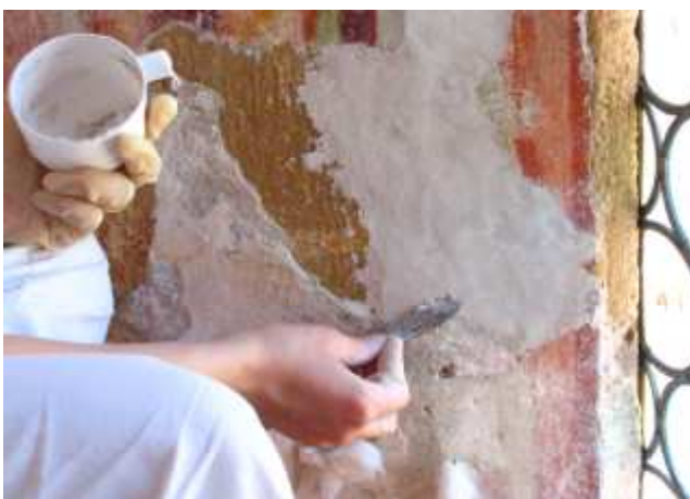
Odstranjevanje sige s skalpelom (levo) in kitanje na mestih manjkajočih oz. odstranjenih ometov (desno).

Mesta, kjer so nekoč stali kamniti služniki, so bila prekrita z več plastmi nestabilnih ometov. Ti ometi so bili odstranjeni, kamniti ostanki služnikov pa na novo ometani z grobo in zaglajeni s fino apneno malto. Le en kamniti ostanek služnika na vzhodni stranici prezbiterija smo pustili odprt, kot dokument o prisotnosti kamnitih služnikov v prezbiteriju. Prav tako so bili odstranjeni večji deli nestabilnih ometov, pod katerimi ni bilo ohranjenih fresk. Večje neposlikane površine so bile potem na novo ometane s klasičnim zaglajenim apnenim ometom.