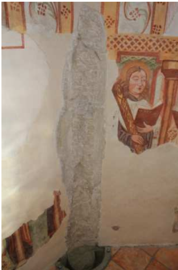
Prezentiran ostanek kamnitega služnika.

Celotno fotodokumentacijo v elektronski obliki hrani tudi naročnik.