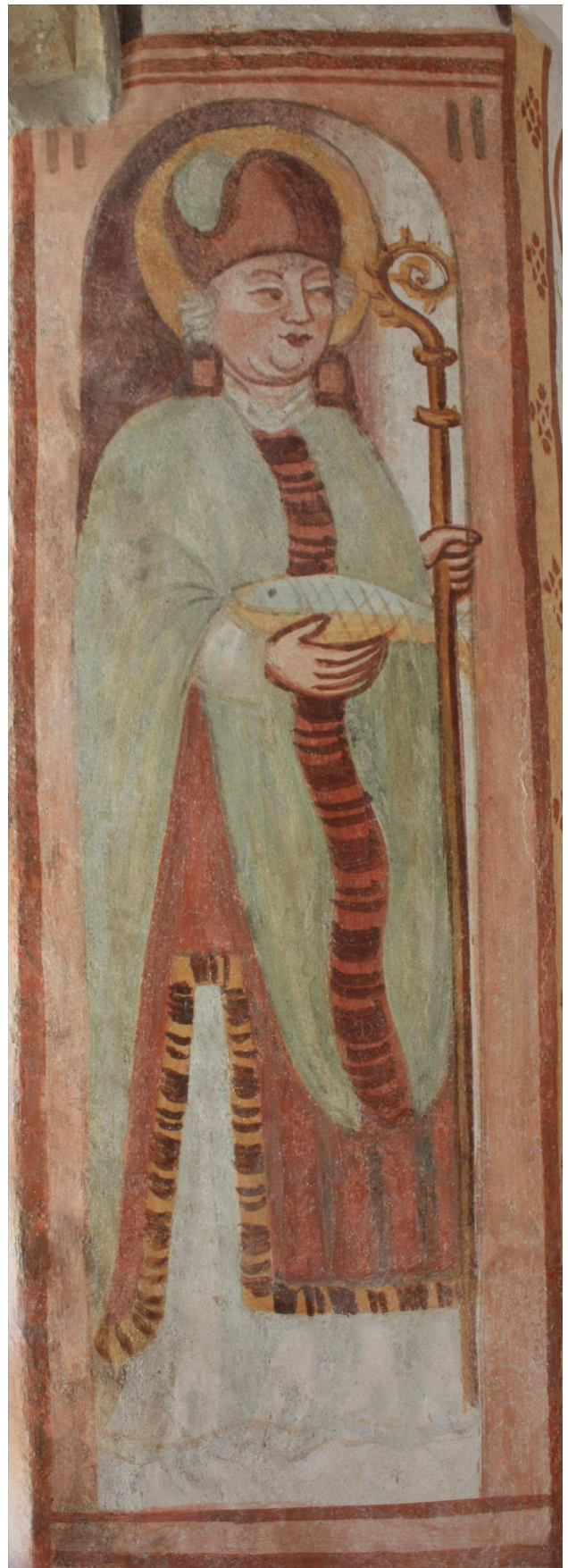
Svetnika na okenskih špaletah na V steni prezbiterja po restavratorskem posegu.