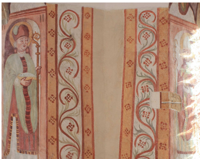
Rekonstrukcija manjkajočih ornamentov, ostenje med V in JV oknom prezbitterija med in po posegu.