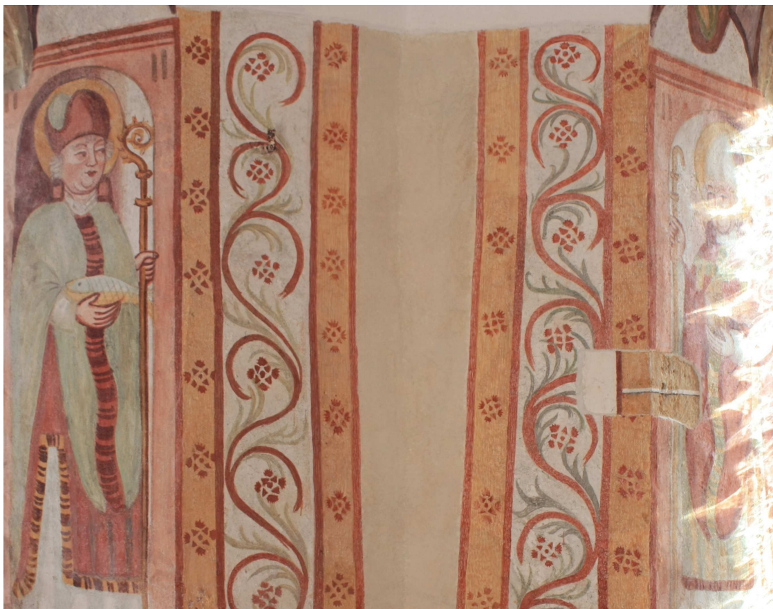
Vogal med SV in V steno prezbiterja med in po restavratorskem posegu.