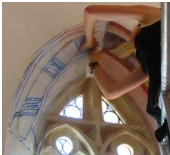
Rekonstrukcija manjkajočih, ornamentalnih (predvidljivih) delov poslikav.