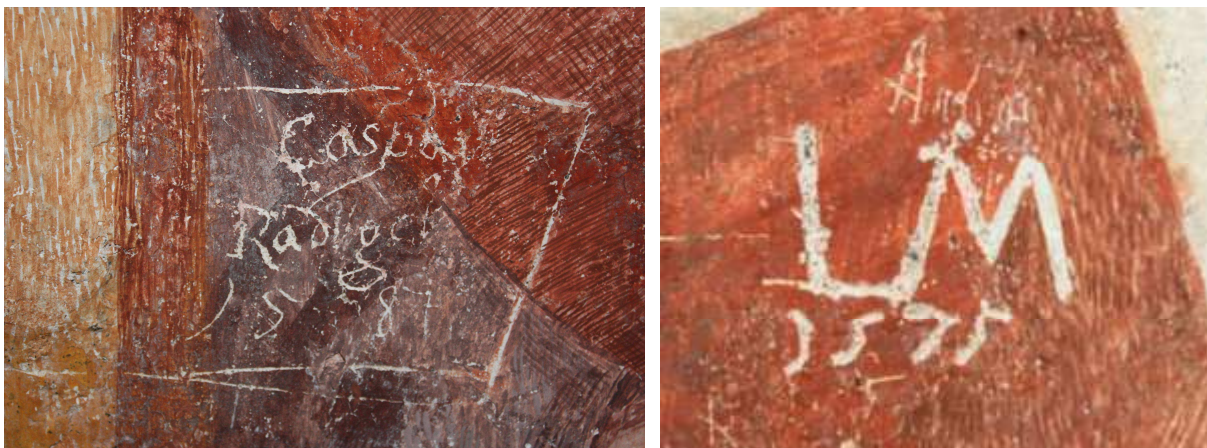
Grafita, vrezana v stenske poslikave (letnici 1587 in 1575).

Leta 1911 je slikar Matej Sternen poslikave zasilno restavriral. Freske je le delno odkril, manjkajoče dele je na grobo in nad nivo originalne poslikave pokital, ponekod tudi čez original, ter pokitane dele pobarval z barvami, sorodnimi originalu. Velik del fresk – predvsem v zgornjem delu je ostalo neodkritih.