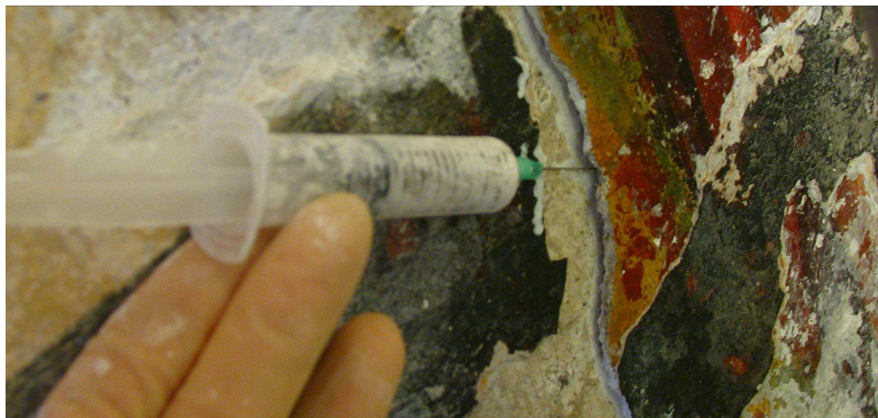
Mikroinjektiranje podmehurjenih delov je preprečilo odpadanje fresk med odstranjevanjem beležev, ki so prekrivali fresko.