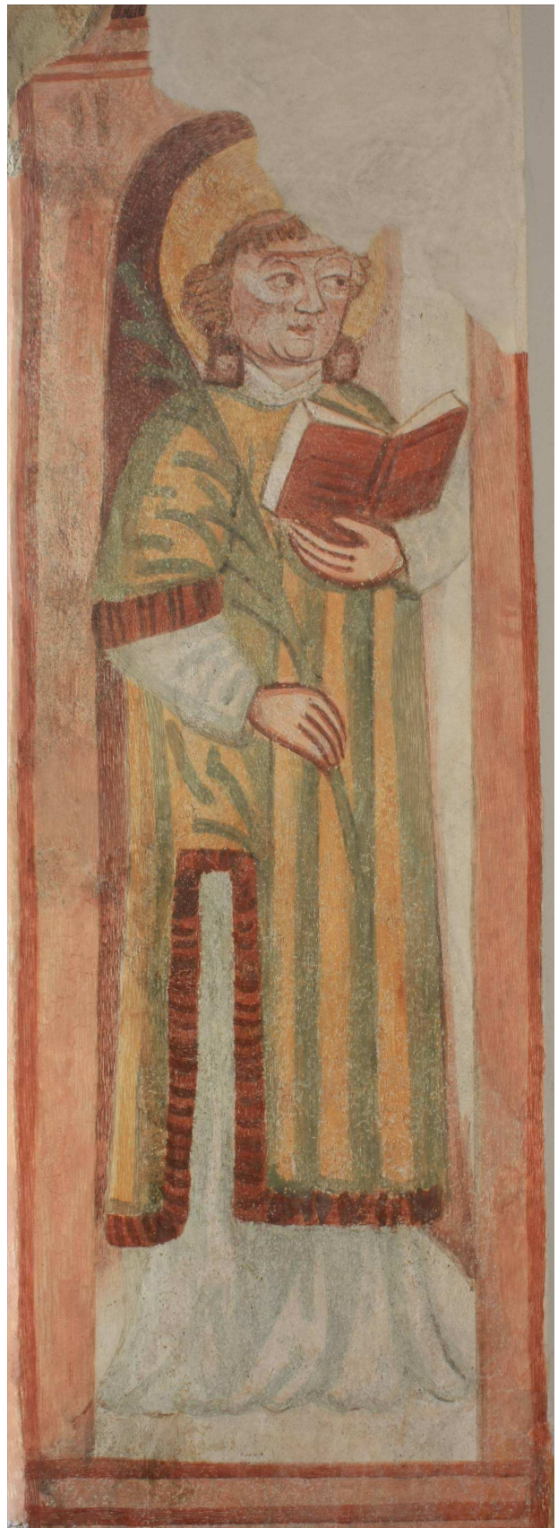
Svetnika na okenskih špaletah na JV steni prezbiterja po restavratorskem posegu.