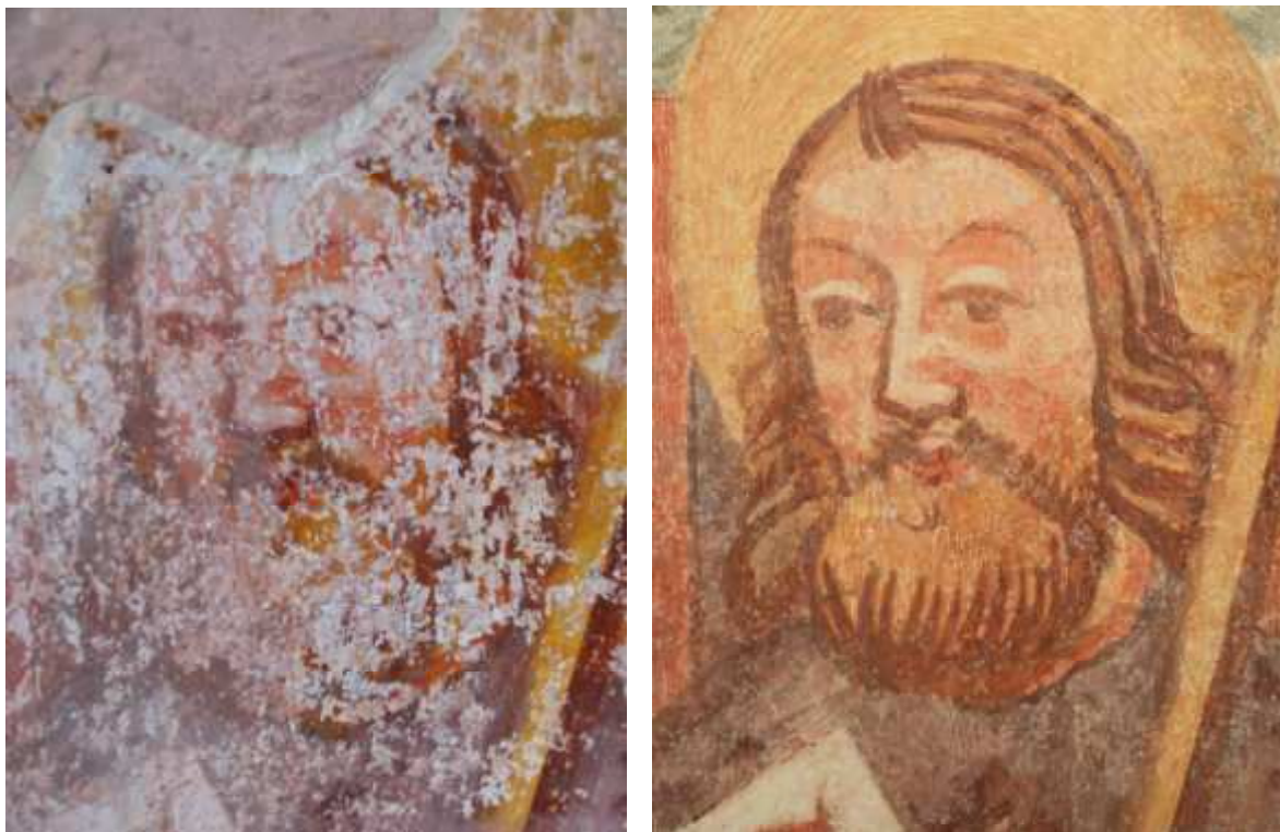
Detajl apostola na JV steni prezbiterija pred in po restavratorskem posegu.