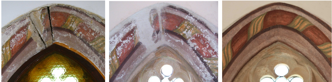
Gornji del okenske špalete pred, med in po restavratorskem posegu.