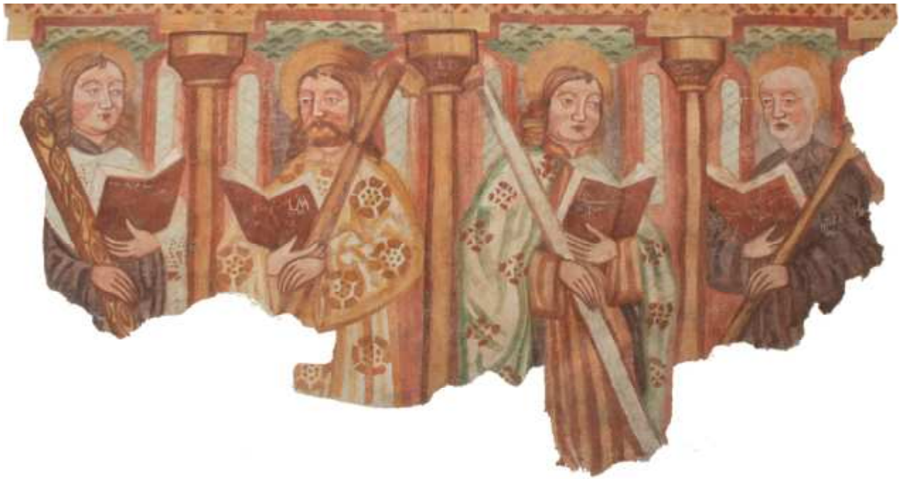
Ohranjena poslikava s figurami apostolov pod oknom na V steni prezbiterja.