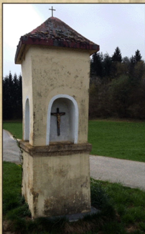
Na poti v Leščevje

Kot literarno predlogo je prebivalce obeh gradov (iz družine Födranspergov) uporabil tudi naš pisatelj, doma z Muljave, Josip Jurčič. Pojavljajo se v romanih Deseti brat, Cvet in sad, Domen. Pravzaprav ti liki oživijo s pomočjo igralcev in igralk v letnem gledališču na Muljavi.