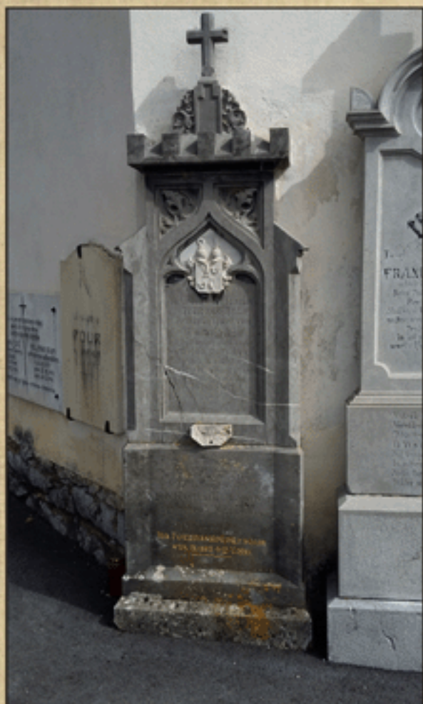
Nagrobni spomenik rodbine Födransperg v Stični