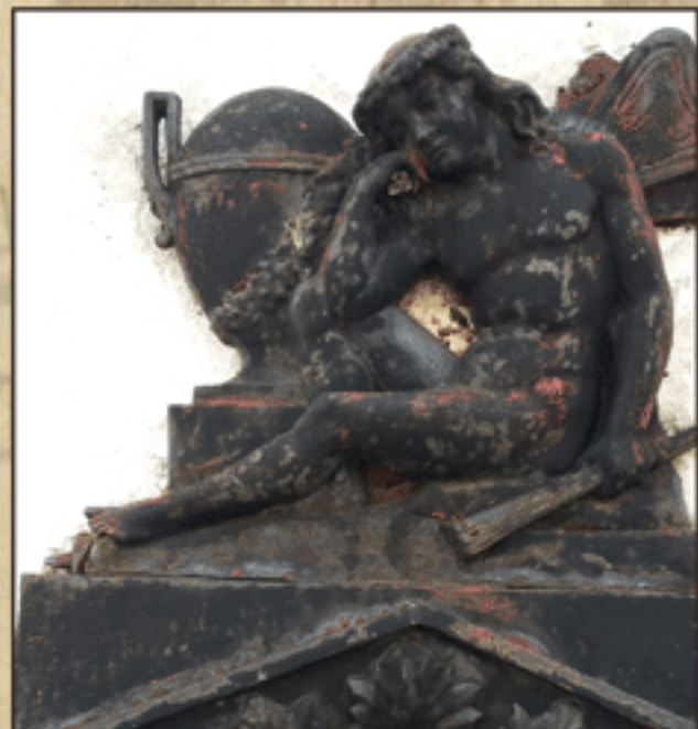
Nagrobnik Alojza viteza Födransperga v severni steni cerkve v Trebnjem