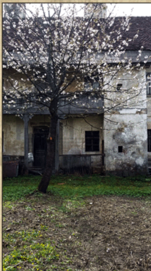
Razcvetela češnja na Födranspergovem vrtu

Pot smo nadaljevali po vrtu. Še vedno je videti železna vrata, ki v spremstvu mogočnih stebrov vodijo proti bazenu. Eden izmed njih je podrt ... Vidni so še sledovi drobnih vrtnic, ki se zbujaajo iz zimskega spanja in se pripravljajo na svoje prvotno poslanstvo – lepšati nekdanj skrbno urejen vrt, danes le še ostanke vložnega truda in znanja najetega vrtnarja.