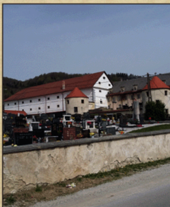
Samostan Stična – pogled s pokopališča v Stični