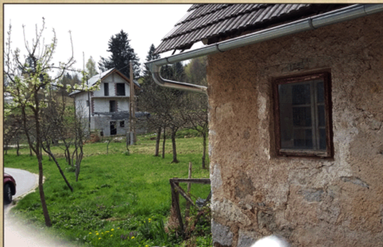
V Laškovcu – Ribnik je bil nekdanj v lasti Födranspergov, zdaj v tujih rokah