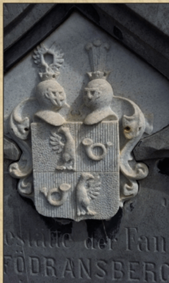
Grb rodbine Födransperg na nagrobnem spomeniku

Zraven pa smo odkrili še vdolbinico z jokajočim kamnitim angelom in ploščo z napisom: