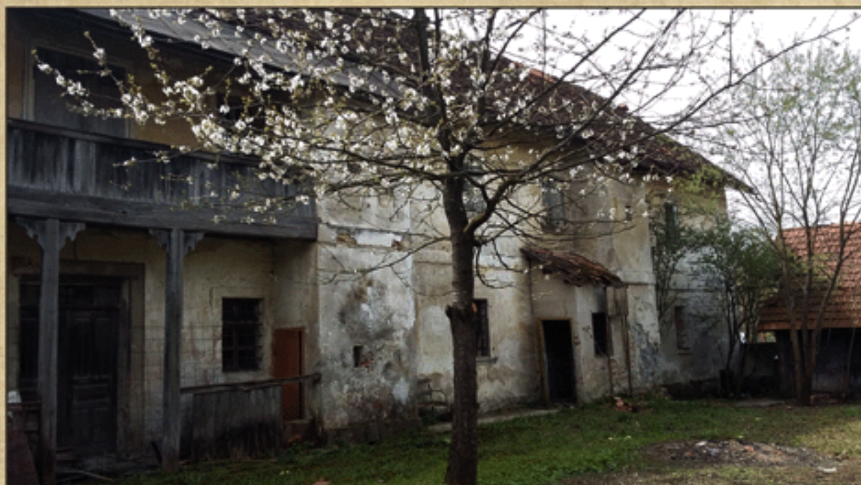
Lesen "gank" na zadnjem delu graščine