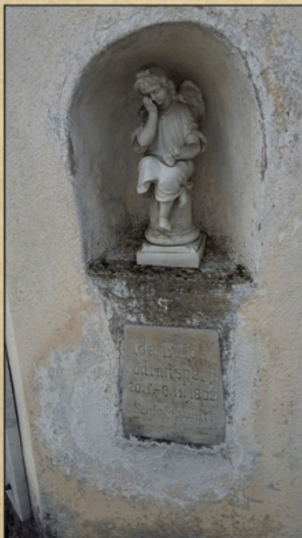
Vdolbina v kapeli na stiškem pokopališču z jokajočim angelom in nagrobno ploščo Ide Edle v. Födransperg

Zgodovino te veje Födranspergov bomo razložili v poglavju 4.