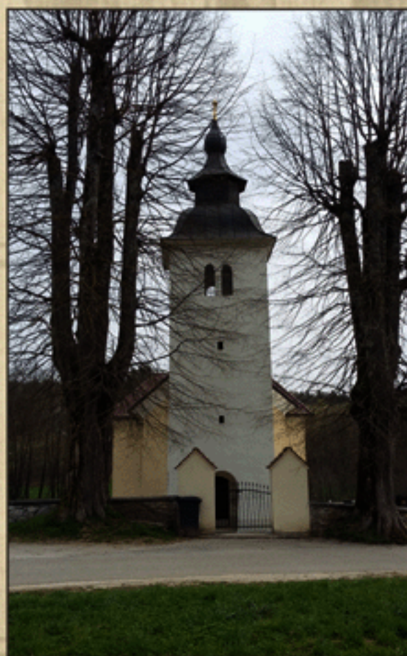
Cerkev sv. Janeza Krstnika v bližini nekdanjega gradu Kravjek