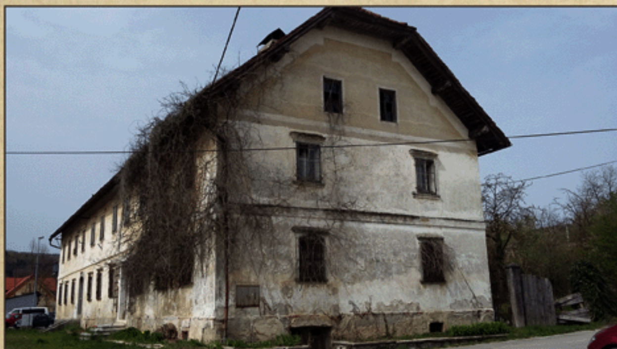
Fedranspergova graščina na Malem Hudem pri Ivančni Gorici

Pri našem raziskovanju nas je pot najprej vodila k Fedransbergovi graščini. Ob cesti Ivančna Gorica–Višnja Gora, v kraju Malo Hudo, stoji stara, podolgovata stavba, zapuščena in potrebna obnove. Videti je, da je bila nekoč gosposka.