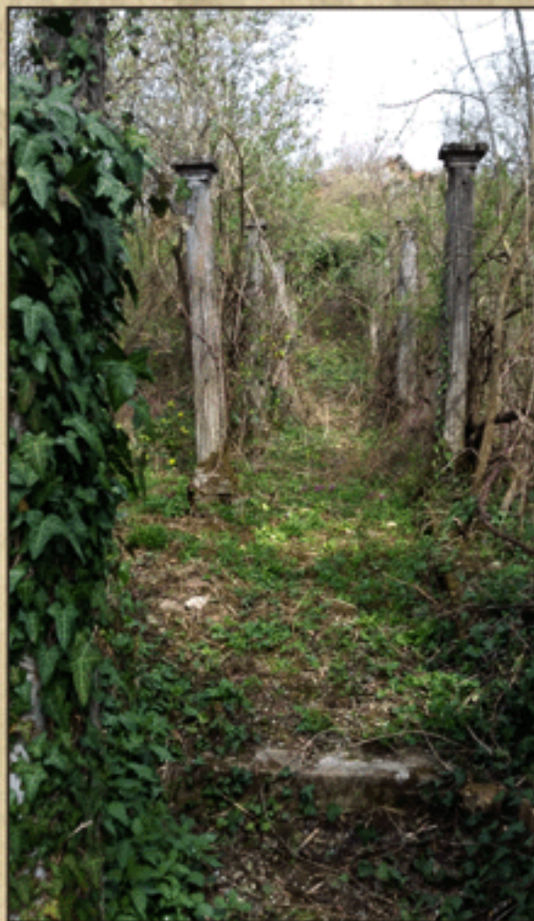
Spomini na nekdanji vrt za graščino

Ta vrt in hišo je človek res vedno lahko občudoval!«