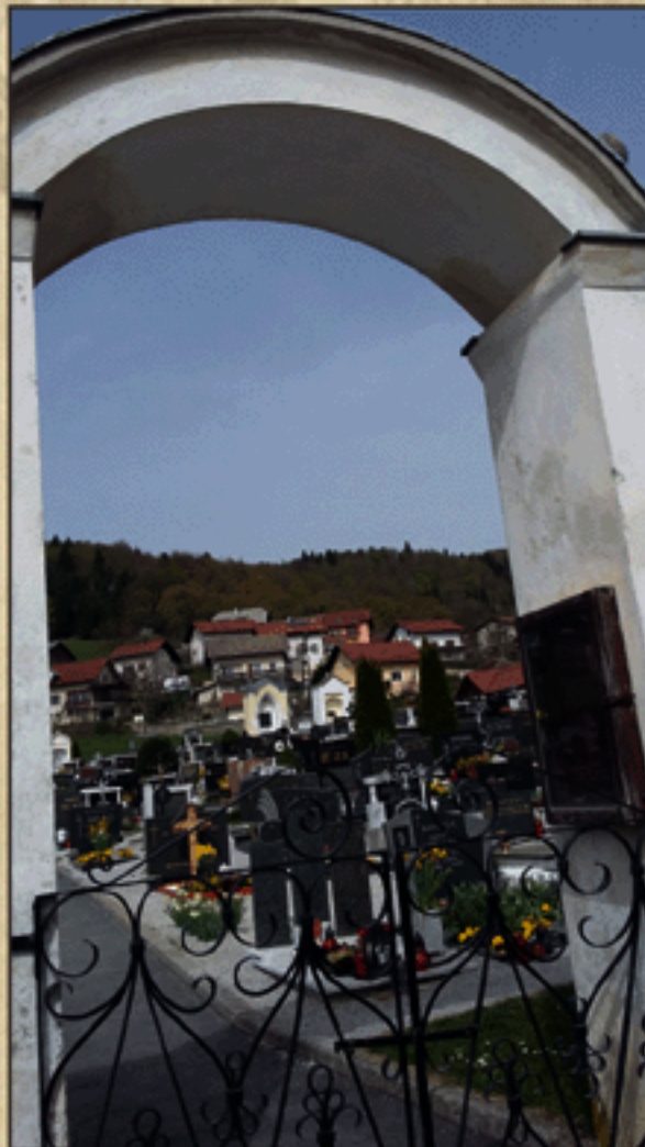
Vhod na pokopališče v Stični

A kaj, ko večina ni takoj razumela sporočila, pozneje pa so se nekateri zaradi dovtipa tudi hudovali.