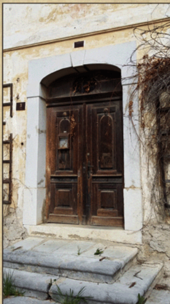
Vhodna vrata v prvi del Föderanspergove graščine