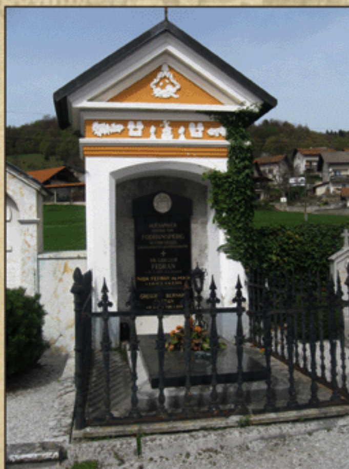
Grobnica družine Födransperg v Stični

Rodbinske povezave smo razložili v poglavju 4.