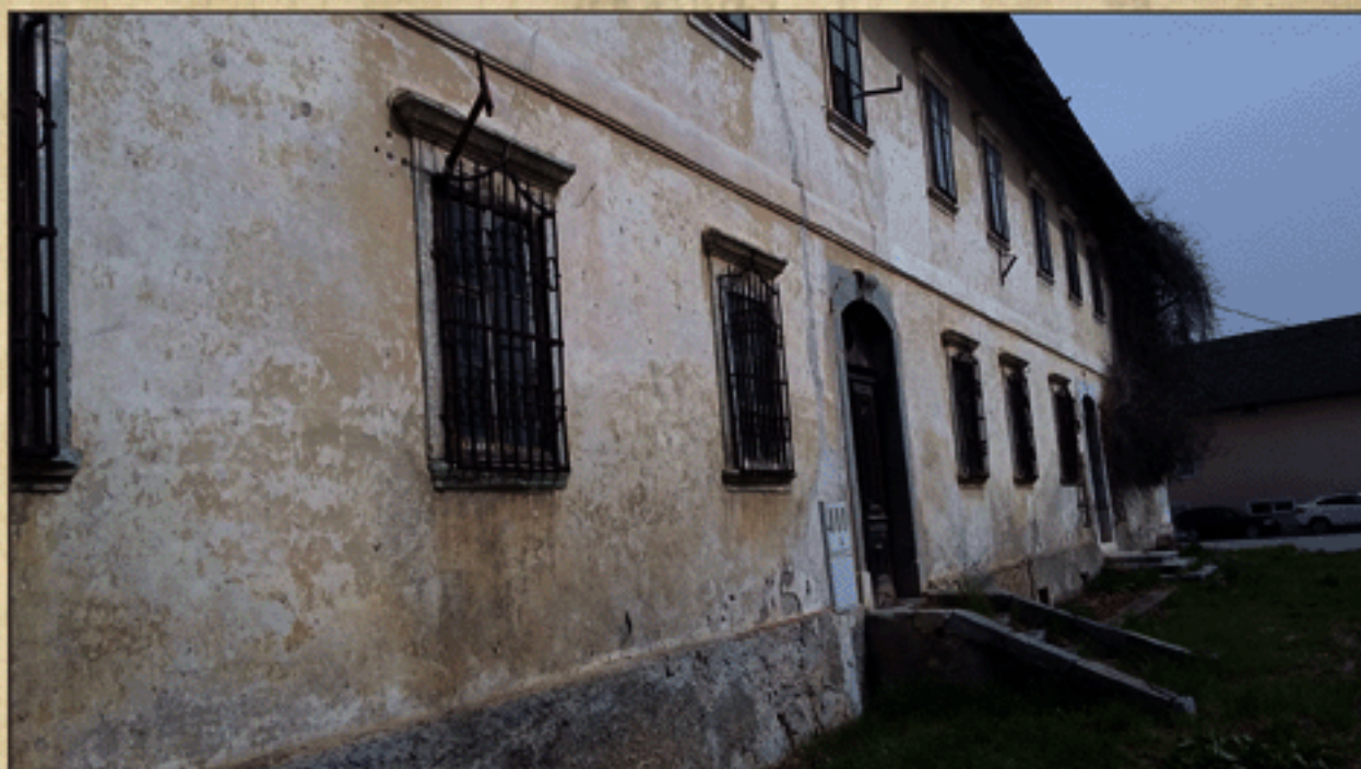
Okno z baročno kovinsko mrežo na Födranspergovi graščini

V stavbo vodita dva vhoda. Oba se začenjata s skrbno oblikovanimi kamnitimi stopnicami, nad vrata pa se bohoto bogat okrasek iz kamna. Vrata so lesena, mogočna. Na prvih vratih je še danes pritrjena medeninasta ploščica z napisom: