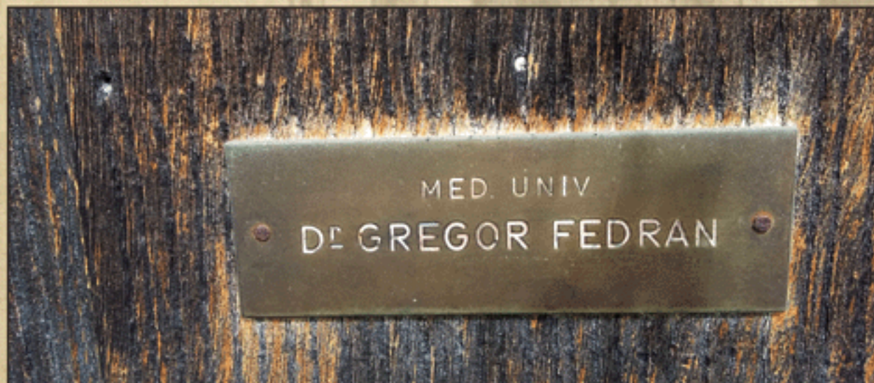
Medeninasta ploščica na vhodnih vratih na Födranspergovi graščini

V stavbo vodita dva vhoda. Oba se začenjata s skrbno oblikovanimi kamnitimi stopnicami, nad vrata pa se bohoto bogat okrasek iz kamna. Vrata so lesena, mogočna. Na prvih vratih je še danes pritrjena medeninasta ploščica z napisom: