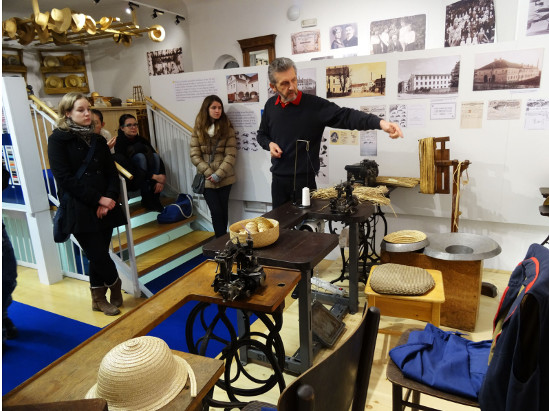
Proseablihanje za vedenje po Staničarjevem muzeju Domžale - končano junija 2014