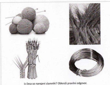
Iz česa so narejeni slamniki? Obkroži pravilni odgovor.