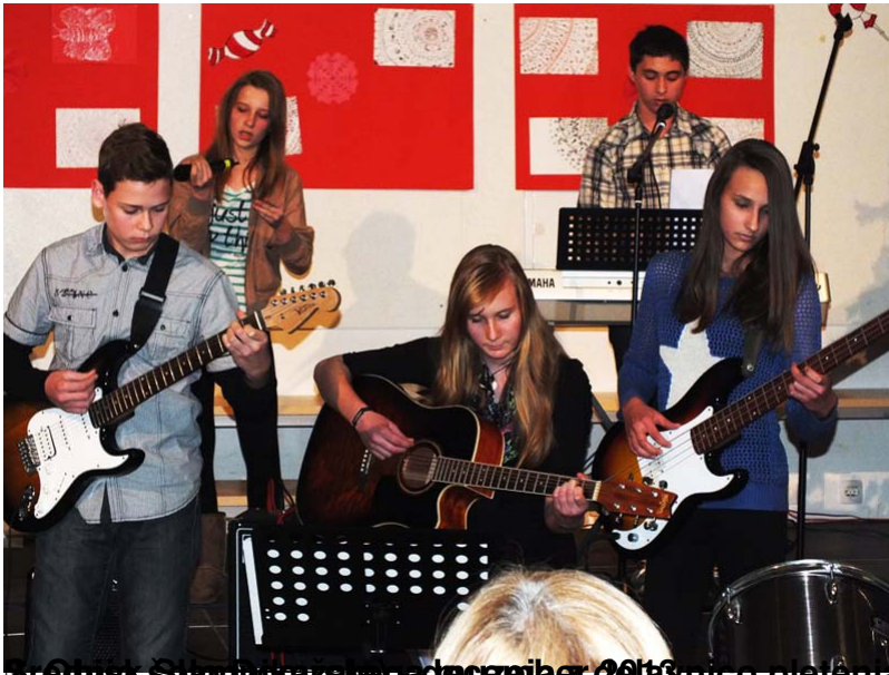
slamnatih kit (z OŠ Globoko in s