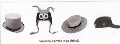
Prepoznavni slamniki in ga obkroži.