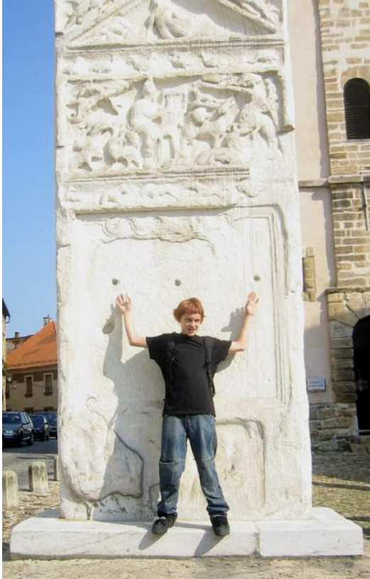
Na sramotilnem stebru