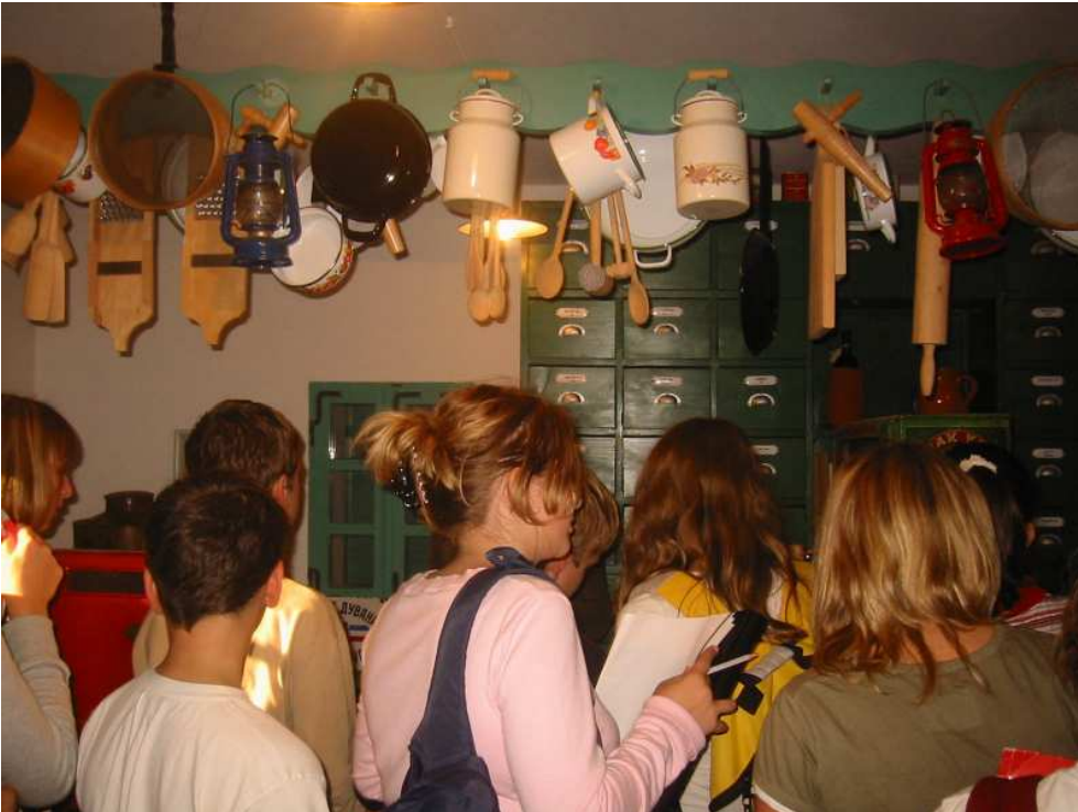
V »lodnu«, stari podeželski trgovini z mešanim blagom