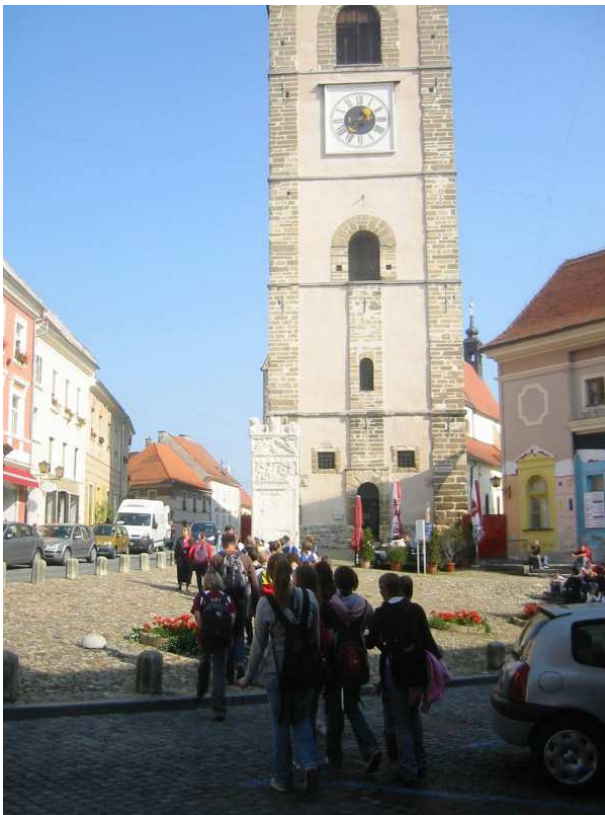
Prihod na glavni trg v starem delu Ptuja