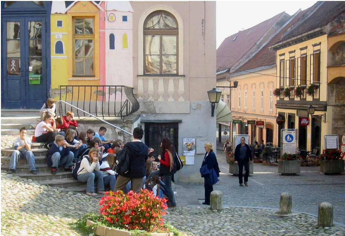
Pred gledališčem v središču Ptuja