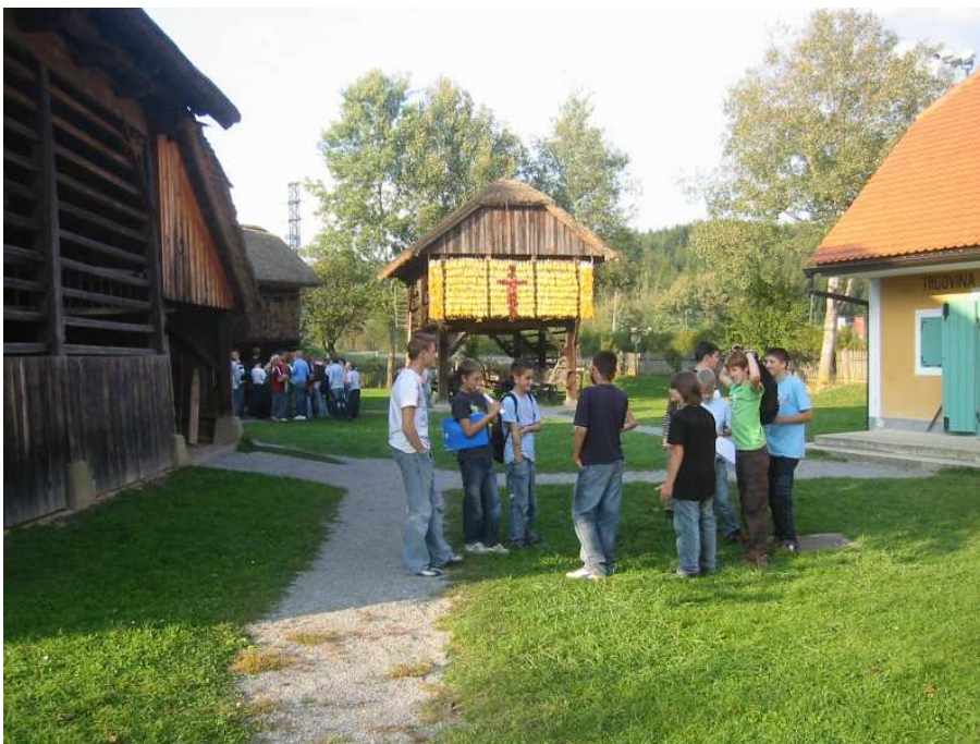
Muzej na prostem v Rogatcu