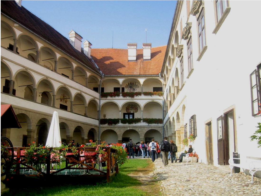
Prihod na ptujski grad

Na ekskurziji 11. oktobra 2006 so si učenci 8. razreda ogledali Ptuj, najstarejše slovensko mesto, ptujski grad in se razgledali po gričevnati in ravninski pokrajini Panonske Slovenije. Okrepčali so se v ptujskih toplicah (Terme Ptuj) in se skozi Haloze zapeljali v Rogatec, kjer so si ogledali muzej na prostem. Poleg zgodovinskih in geografskih zanimivosti bili pozorni na slogane kandidatov za bližnje lokalne volitve, ki so bili zapisani na številnih plakatih po slovenskih krajih.