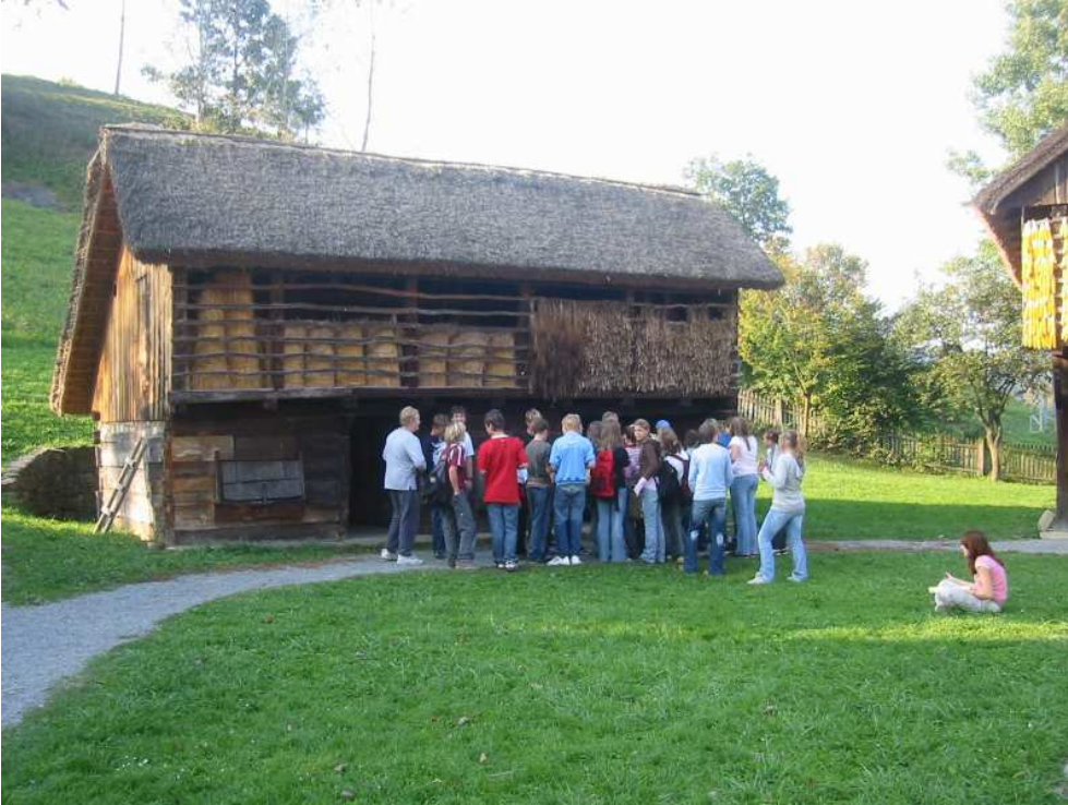
Pred gospodarskim poslopjem