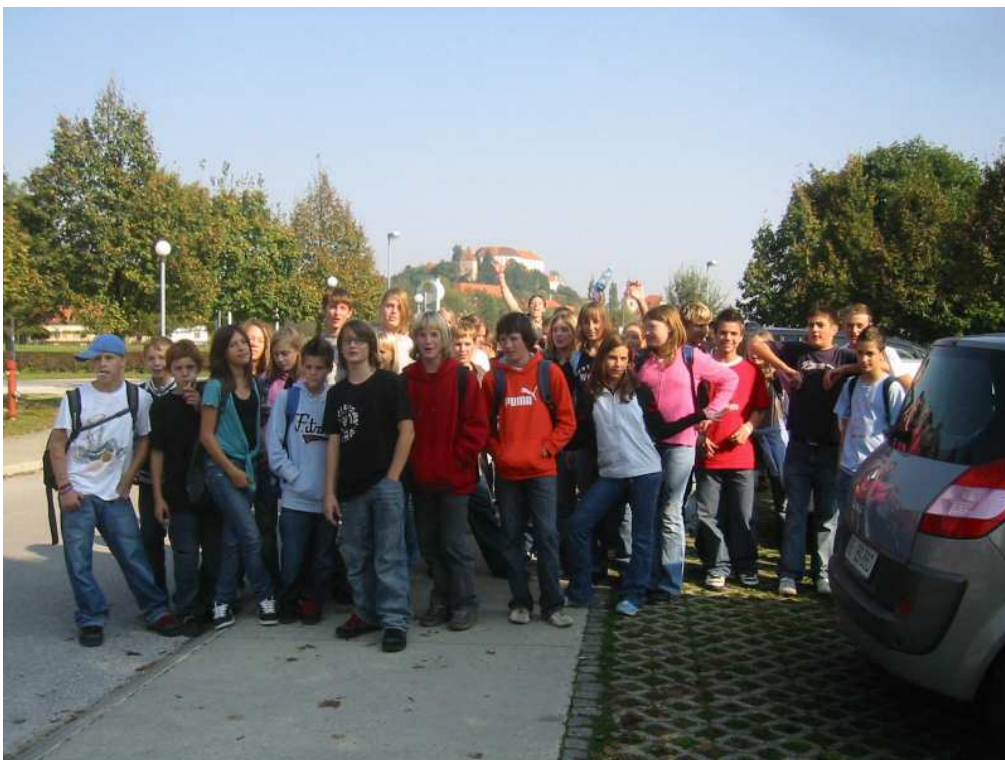
Na sprehodu po ptujskih toplicah, v ozadju ptujski grad