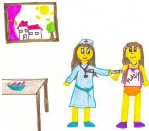
Anja Križnar, 5. b