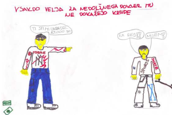
Rok Javornik, 7. b