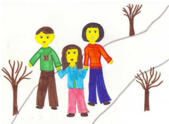
Anja Oršič, 5. a