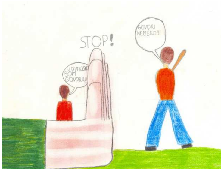
Tristan Kokalj, 5. a