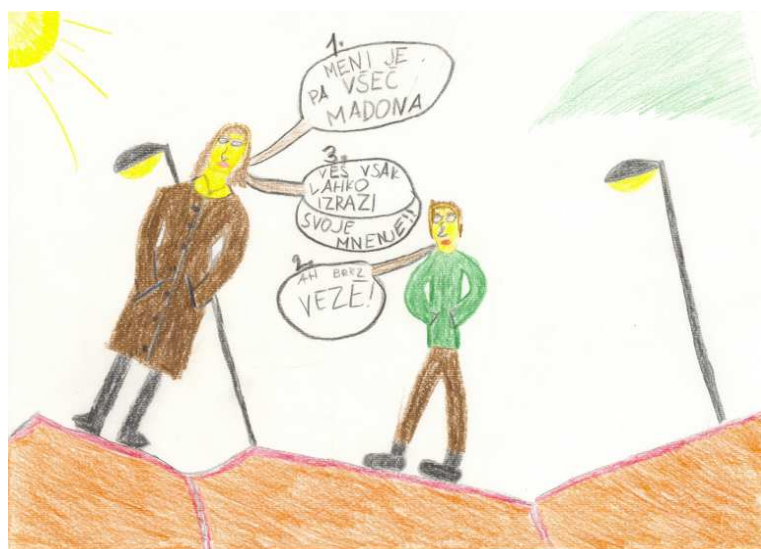
Urban Videmšek, 5. a