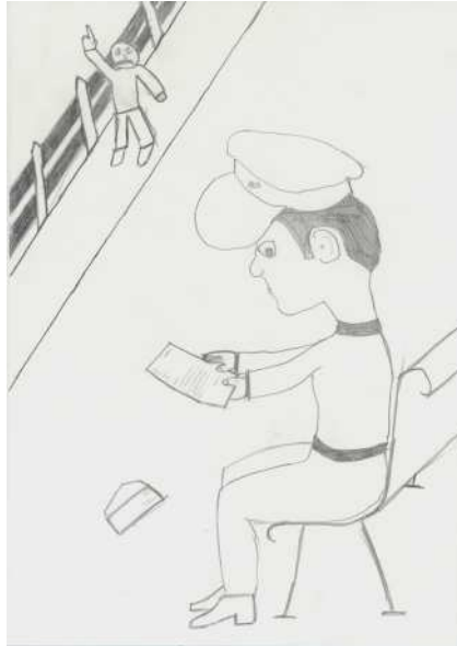
Tomaž Kastelic, 7. a