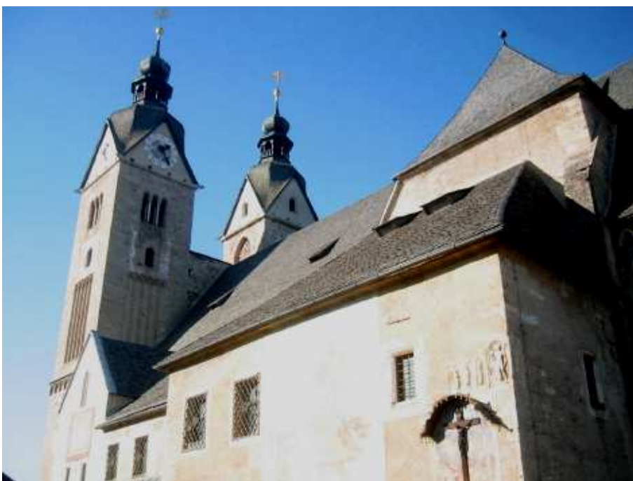
Cerkev Gospe Svete je pomembna od časa pokristjanjevanja (v 8. st.) dalje. Ogledali smo si njeno gotško zasnovo, baročno okrasje in gradbeni material (s številnimi rimskimi reliefi) iz bližnjega rimskega mesta Virunum.