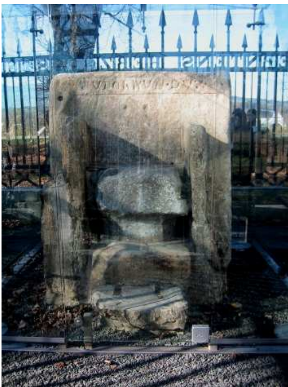
Gradbeni material je bil prinesen iz opuščene rimskega mesta Virunum.