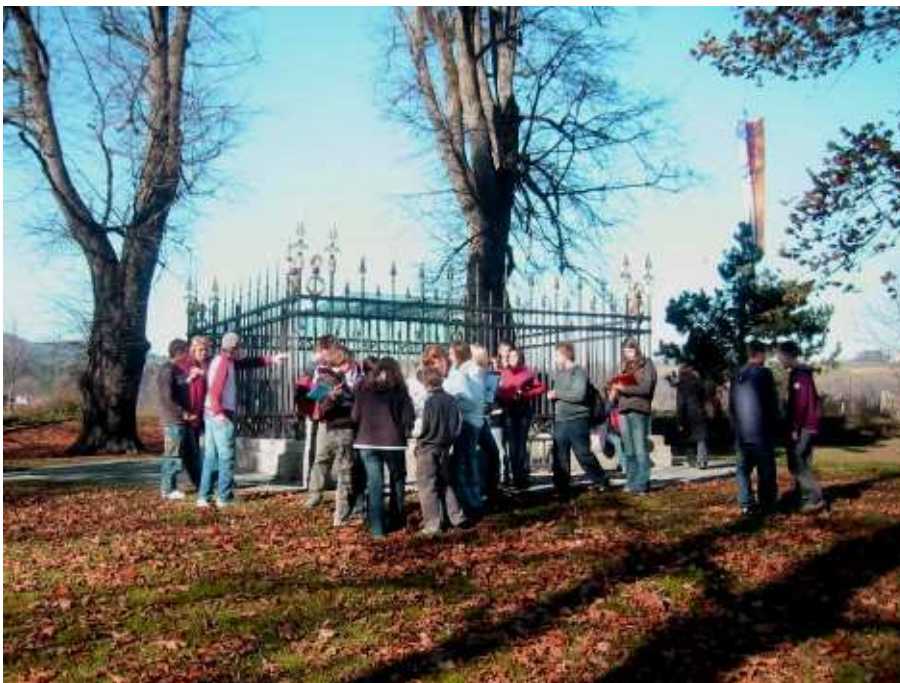
Na Gosposvetskem polju pa stoji »nemški« vojvodski prestol.