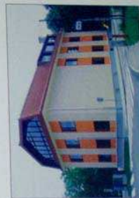
Jarška šola avgusta 2006.

Stoti rojstni dan je šola pričakala v novi preobleki, z obnovljeno fasado v vrednosti skoraj 9 milijonov tolarjev ter, končno, z otroškimi igriščem, vrednim 2 milijona tolarjev.