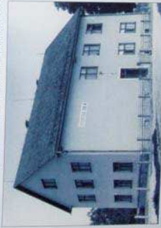
Druga jarška šola po 2. svetovni vojni.

V pritličju je razporeditev prostorov ostala enaka. Ostalo je stanovanje za učitelja, nekoliko se je spremenila le namestitost teh stanovanjskih prostorov. Kjer je bila prej učiteljeva pisarna, je bila potem kuhinja.