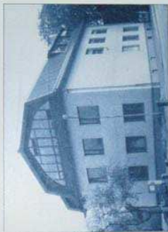
Desno: Jarška šola po obnovi leta 1983.

Predračun adaptacije je znašal nekaj več kot 15 in pol milijonov dinarjev, končni znesek je bil zaradi nepredvidenih del še za pol milijona večji. Žal je zmanjkalo denarja za zunanjo ureditev, ki so jo potem s pristojevnim delom učiteljev, otrok in staršev ter z znatno podporo KS Jarše-Rodica, dokončali leta 1985. Tisto leto so opremili tudi razdeljevalno kuhinjo in prostor za športno vzgojo.