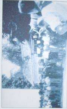
Slovesnost 14. septembra 1947 ob zaključku obnove jarške šole (arhiv D. Flajsja).

Razporeditev prostorov se v jarški šoli do 2. svetovne vojne ni spremenila. Ko so se marca 1944 v šolo vselili nemški vojaki, so zasiedli pritličje in klet, okna zabili in iz njih naredili streliške line. Šola so obdali z obdajno žičnato ograjo. V noči med 22. in 23. marecem 1944 je bila šola požgana, potem pa je brez strehe, z golimi stenami samevala do leta 1946. Tedaj so jo krajani večinoma s prostovoljnimi (udarimiškimi) delom obnovili. Ob zaključku obnovitvenih del so jo slovesno odprli 14. septembra 1947 (S. Stražar, 1988, str. 291).