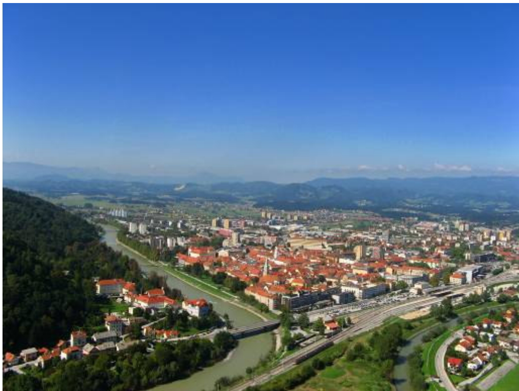
Pogled z gradu-Celje