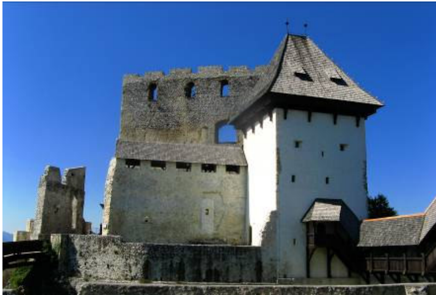
Zgornji celjski grad