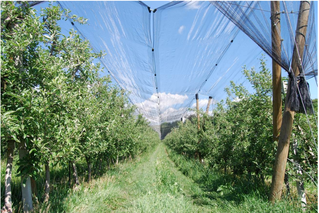
Brez sodelovanja ne gre! (Zoja Tot)