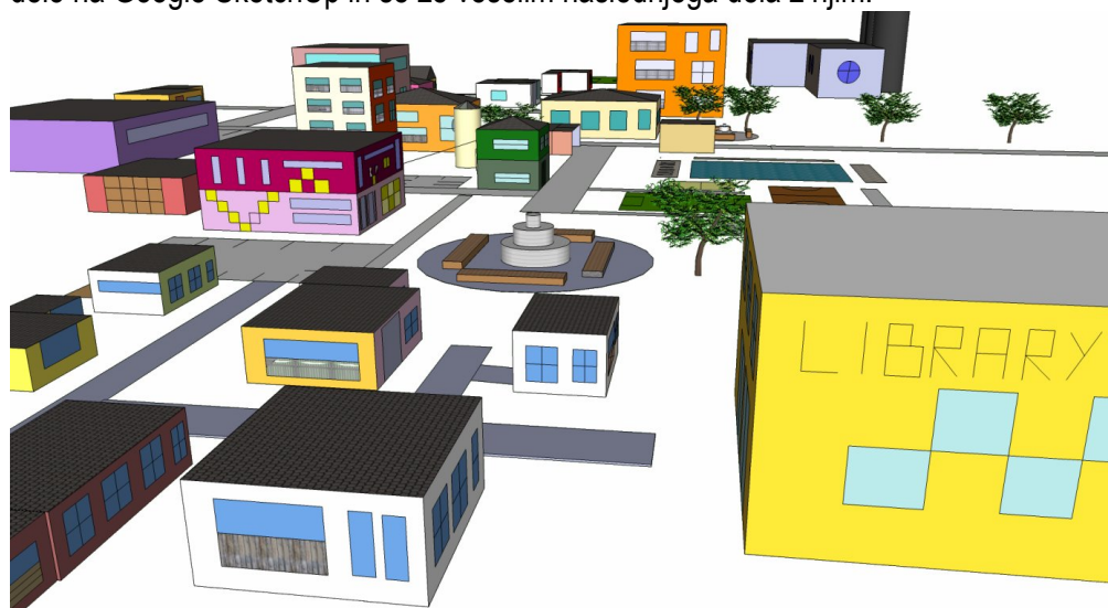
Model mojega mesta, narejenega v Google SketchUp.

Pri delanju z Google SketchUp moraš biti pazljiv in prav tako ga moraš nekaj časa že uporabljati. Pri SketchUp si nekatere stvari, npr. drevesa, nebotačnike idr. povlečeš iz spletne knjižnice 3D Warehouse. Dobivali smo zelo lepe ocene, saj smo imeli lepo pripravljene govorne nastope. Meni je bilo zelo všeč delo na Google SketchUp in se že veselim naslednjega dela z njim.