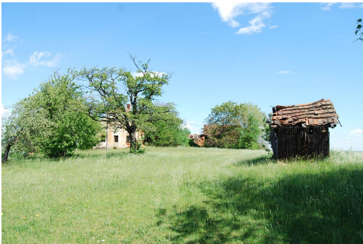
Preteklost – sedanjost! – prihodnost! (Zoja Tot)