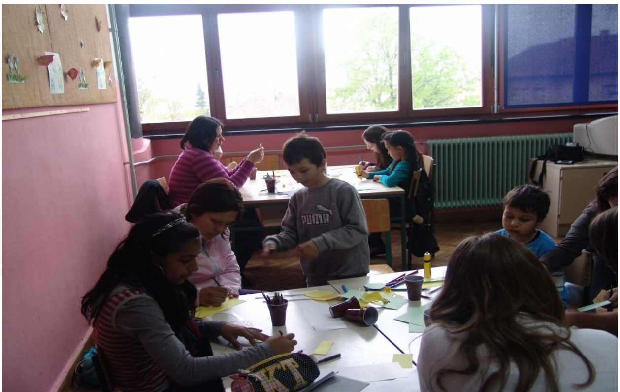
OTROCI S STARŠI USTVARJAJO.