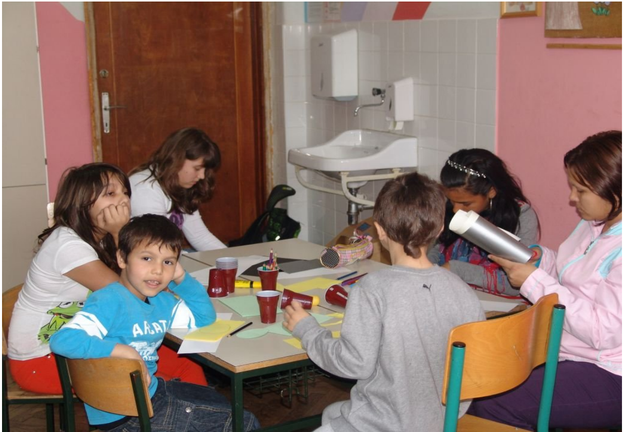
OTROCI S STARŠI USTVARJAJO.