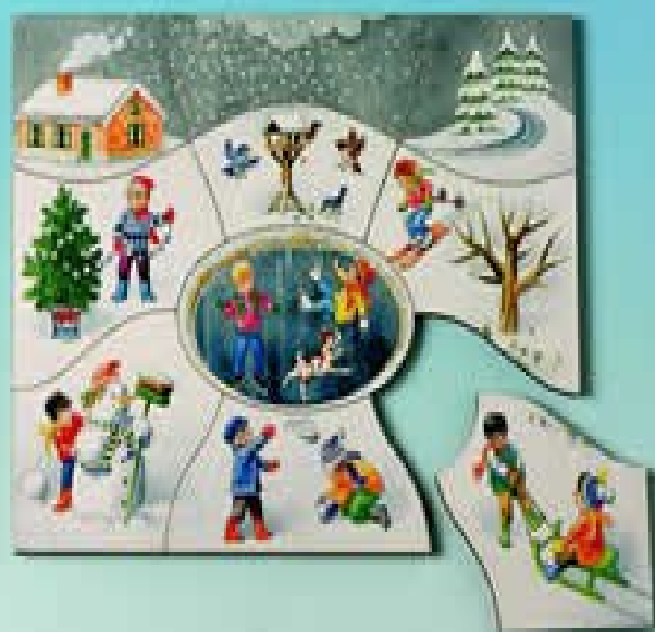
ŠTIRJE LETNI ČASI