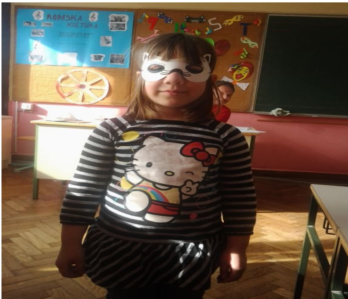
NINA Z IZDELANO PUSTNO MASKO.