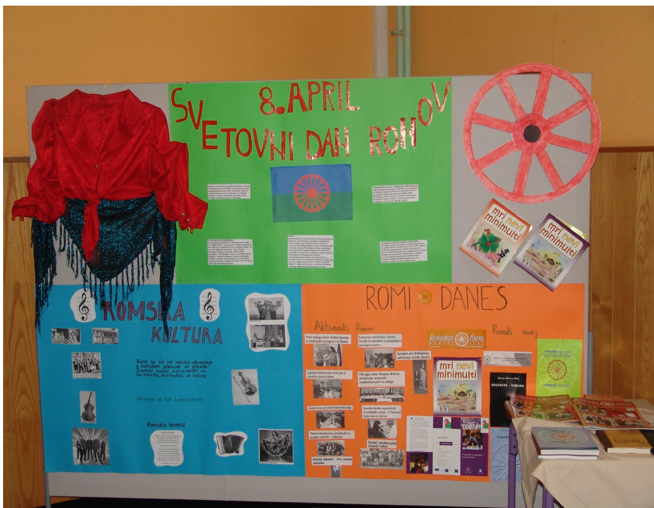
RAZSTAVA OB SVETOVNEM DNEVU ROMOV