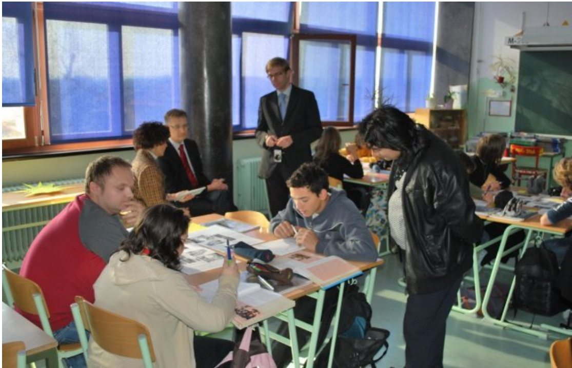
Delo romskega pomočnika v razredu.