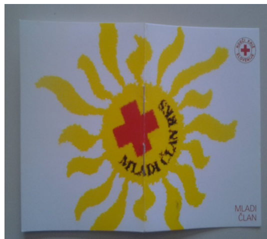
Članska izkaznica Rdečega križa.