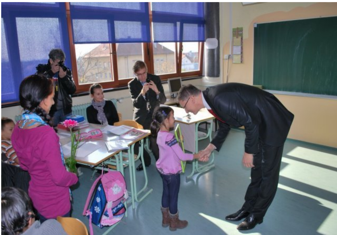
Zahvala ministru za obisk.