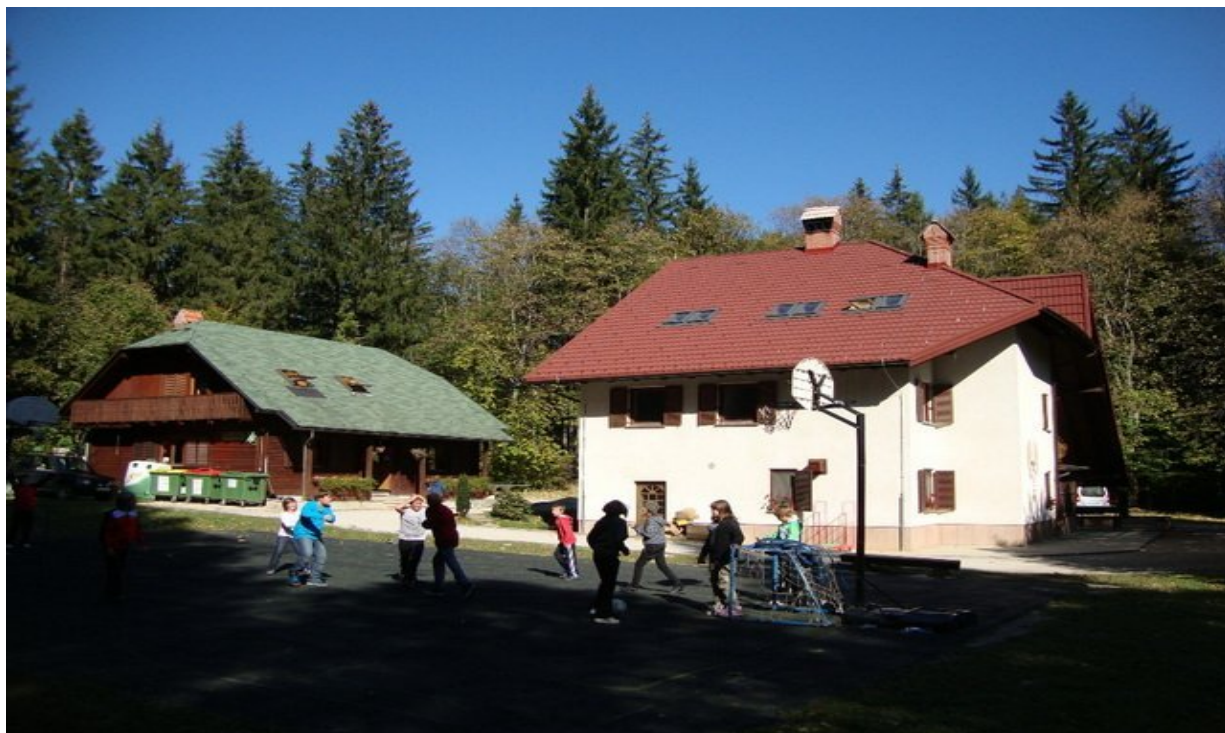
CŠOD Rakov Škocjan