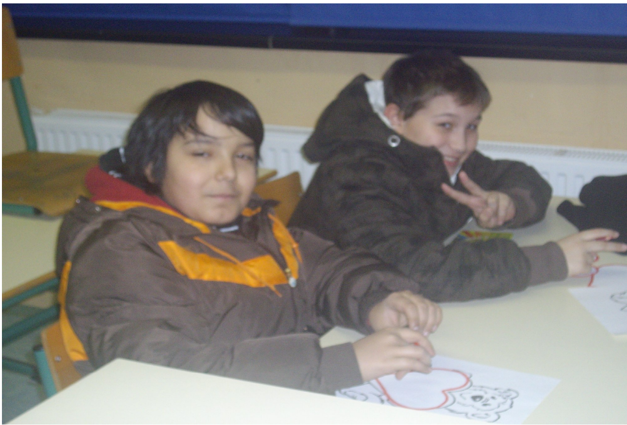
ALEN IN MARSEL USTVARJATA.