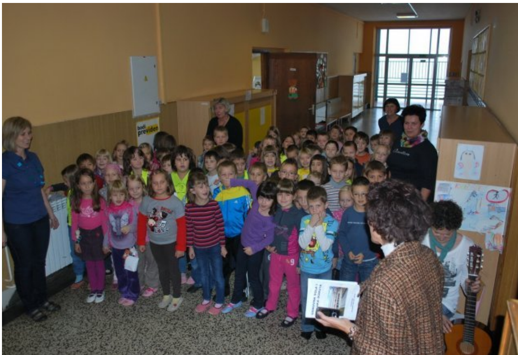
Dobrodošlica ministru s strani učencev prvih razredov.