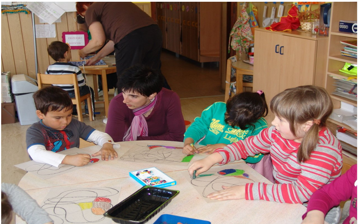
Skupno ustvarjanje z otroci iz vrta Romano.