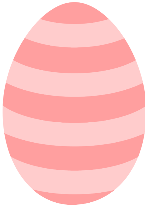
Striped Egg Template