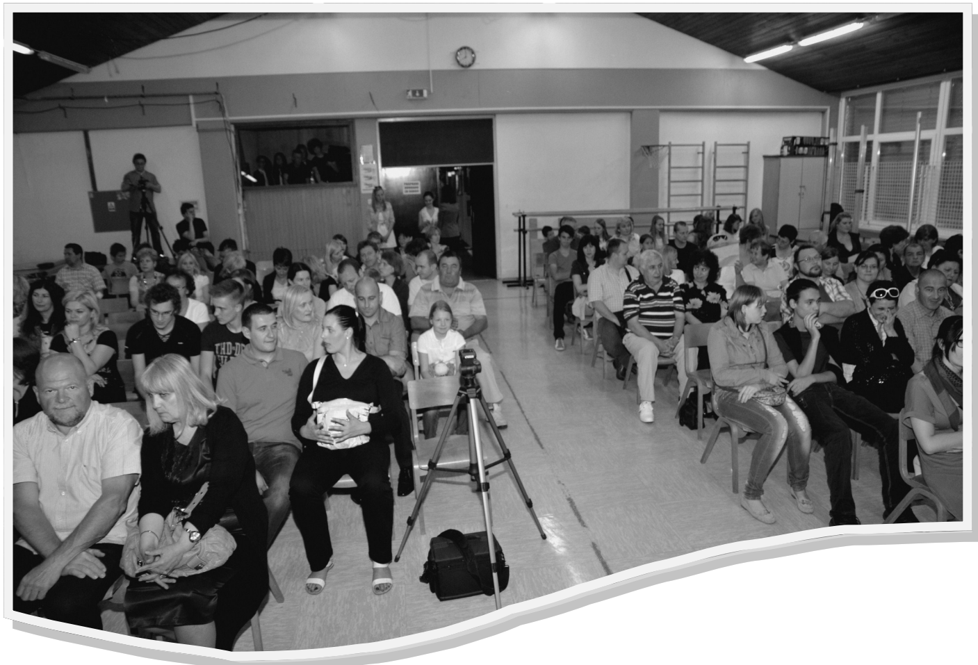
Dvorana nekdanjega Pionirskega doma je bila lepo polna.