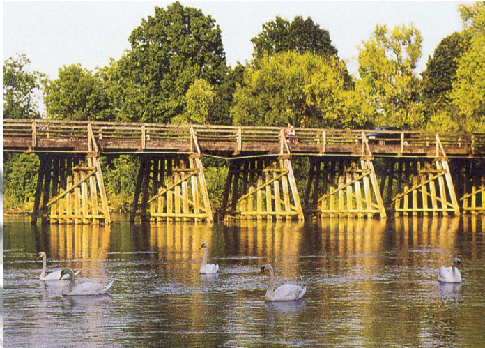
Rečna bregova Krke v bližini Podbočja povezuje leseni most.

Del Podbočja in okolice lahko spoznate in doživite, če se sprehodite po kateri od urejenih pešpoti. Na poti se lahko prepričate o bogastvu narave in gostoljubnosti domačinov.