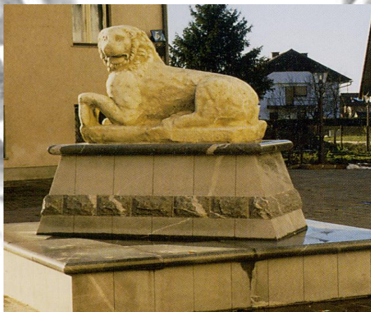
Kamniti lev v osrednjem delu vasi zraven cerkve