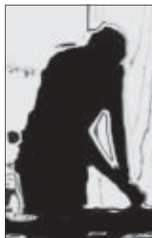
Mini Noise Fest

Masinfo - glasilo Zavoda Masovna Vpis v Evidenco javnih glasil št. 1718 Glavni in odgovorni urednik: Marko Rusjan Tehnično urejanje: Simon Markič