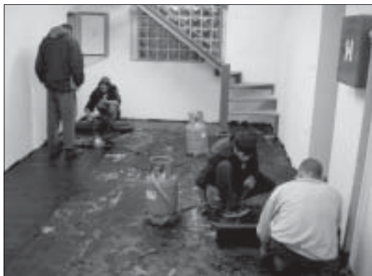
Udarniki polagajo katransko plast