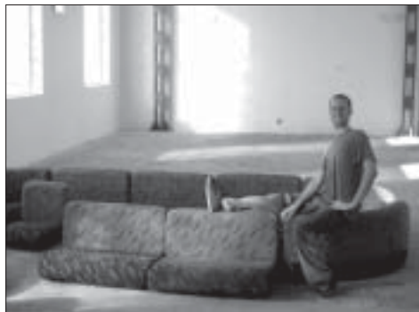
Zasačeni uzurpator Mostovne

Pripravljamo cikle predavanj (za prvi cikel glej drugje v Masinfo), debatne krožke, bralne krožke in raziskovalne skupine. Načrtujemo tudi teoretično produkcijo in izdajo knjig. Predavanja se bodo najverjetneje zgodila v kavarni. Načrtujemo tudi delavnice in tečaje za mlade.