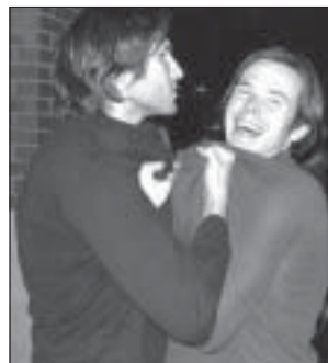
S snemanja videospota za pesem Otok , ki ga ni