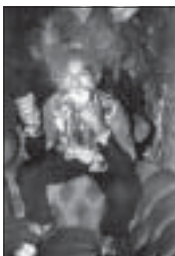
Lee "Scratch" Perry

Škofja Loka: 08.12. ob 19.00, Martinova hiša