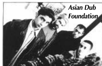
Asian Dub Foundation

25.01.01 The Offspring , Ljubljana/ Hala Tivoli ob 20.uri