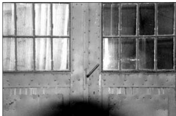
Mostovna: vrata se še niso odprla

Program delovanja se bo sestavljal vsak mesec sproti. Skupine in posamezniki bodo imeli na razpolago enako število petkovih in sobotnih večerov, ko naj bi bile najmnogičnejše prireditve. Občasno se bo program odvijal tudi med tednom glede na