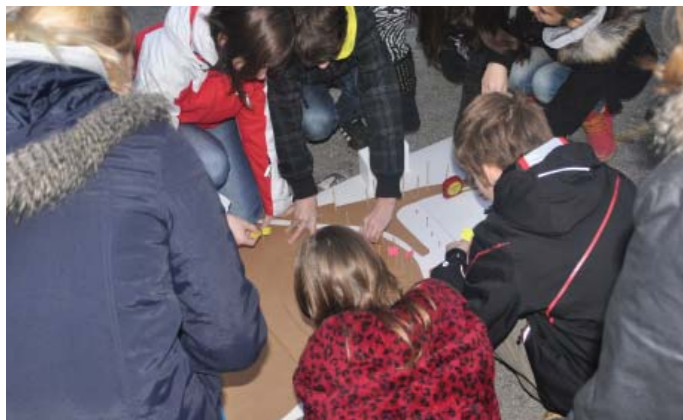
modeliranje, prenašanje merila na maketo