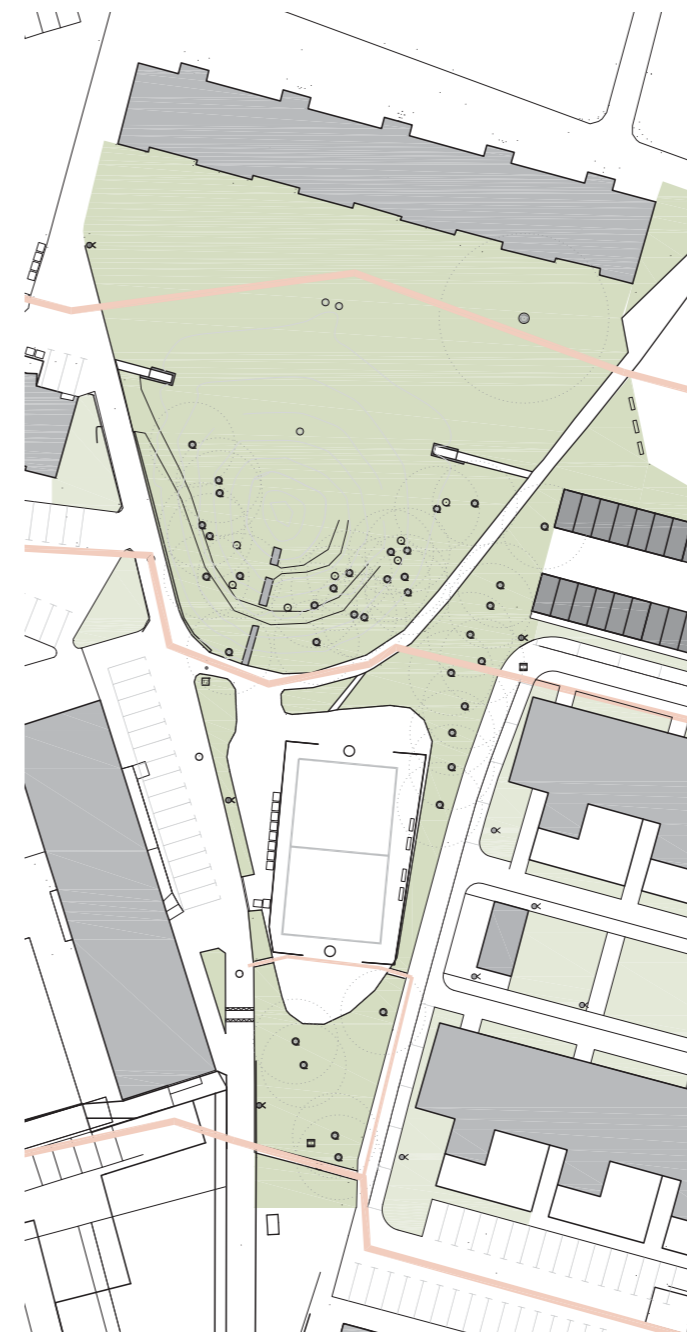
Območje hriba in športnega igrišča - trenutno stanje

Zemljišče obsega hrib, pod katerim je zaklonišče, na njem pa rastejo visokorasle robinije stare okrog 60 let. Športno igrišče južno od hriba je ograjeno in ima dva koša in štiri klopi potrebne obnove.