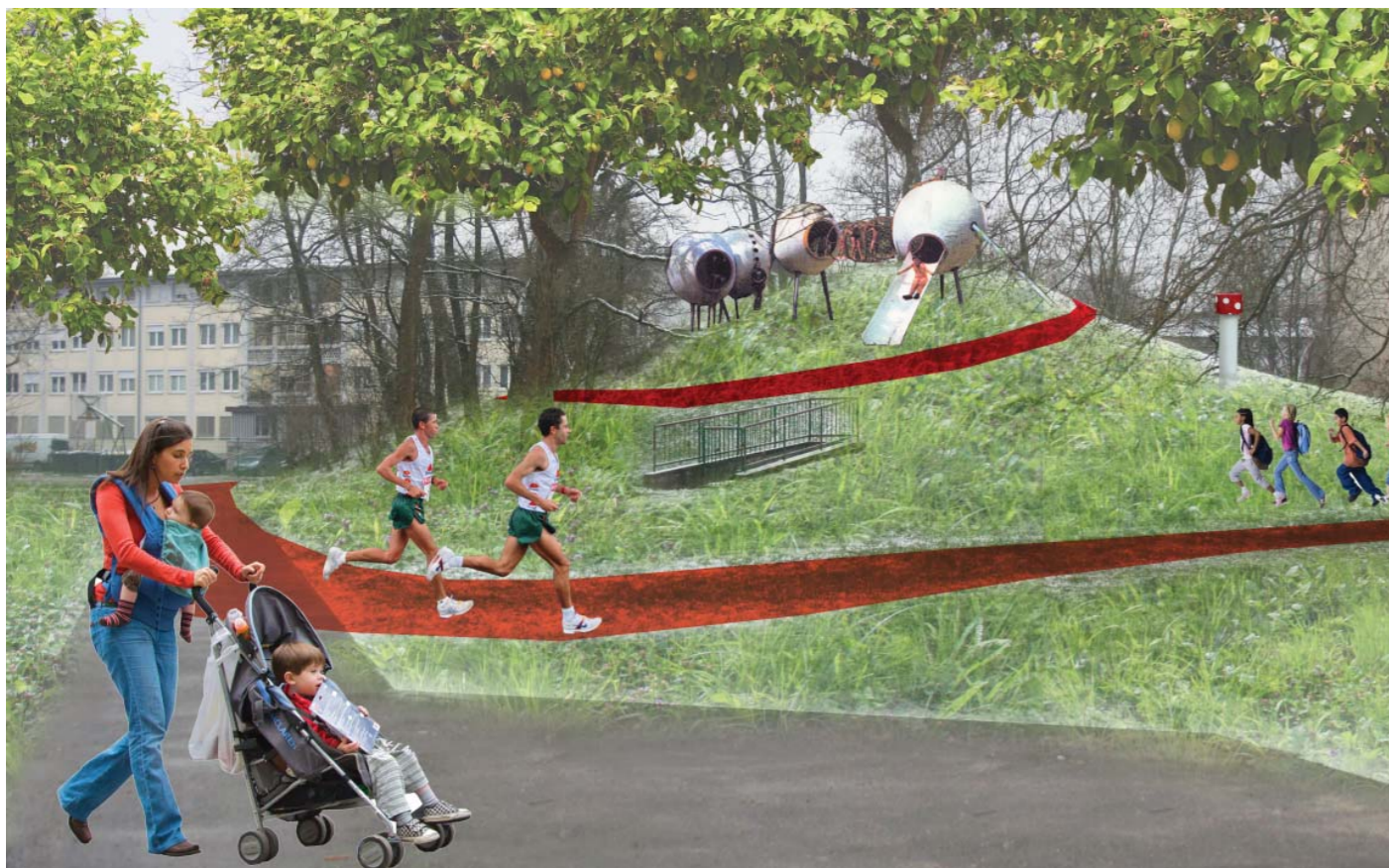
tekaška proga okrog hriba