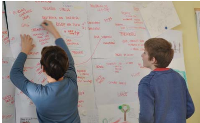
urednotenje, razvrščanje, izbiranje