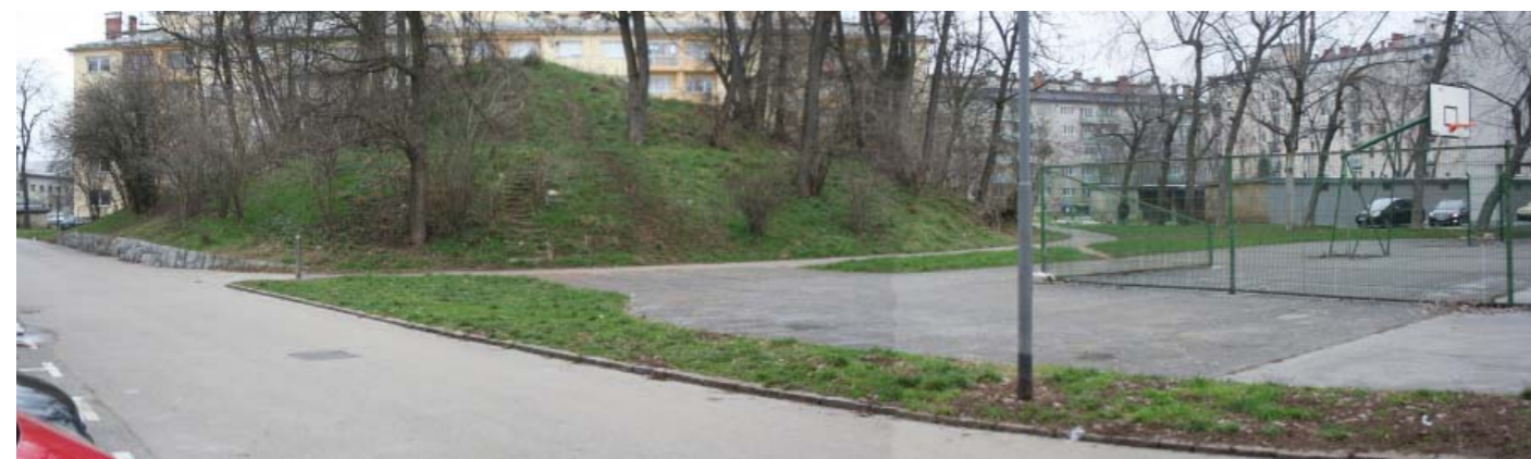
športno igrišče s hribom v ozadju