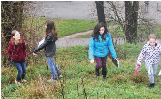
raziskovanje terena, meritve, opazovanje