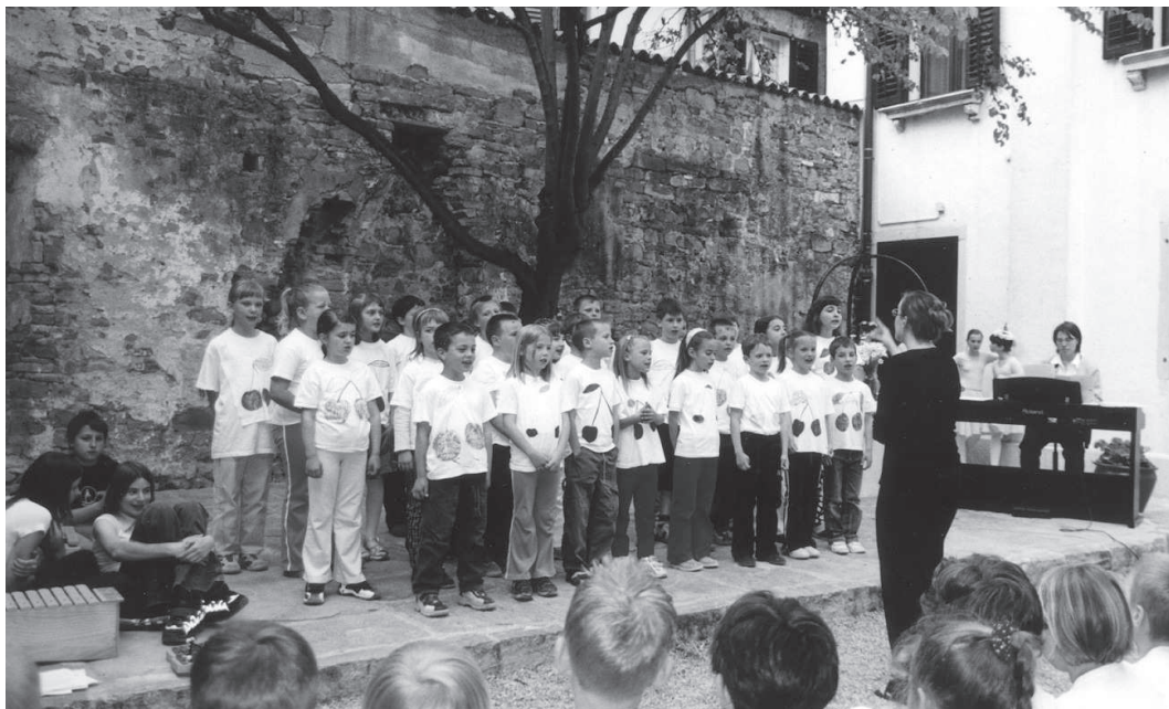
Majski vrt je kot nalašč za nastope naj- mlajših