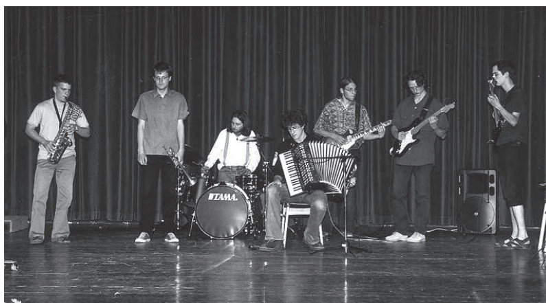
Mladi glasbeniki se na izolski glasbeni šoli združujejo tudi v jazzovski skupini