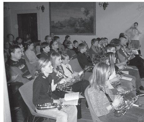
Utrinek s seminarja Saksistra