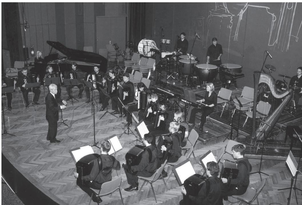
Nastop harmonikarskega orkestra ZPGŠ ob 40-letnici ZPGŠ v Auditoriju Portorož

se je predstavil s koncertom v Zagrebu, konec aprila in v začetku maja je v okviru praznovanja vstopa Slovenije v EU koncertiral v Jamljah in Novi Gorici, sredi maja je bil gost II. mednarodnega harmonikarskega tekmovanja v Trstu, junija pa je nastopil v Pulju, kjer je OKUD Istra praznoval 45-letnico delovanja. Naj še omenimo, da je bil letos orkester vključen v mednarodni projekt »Glasba brez meja« pod pokroviteljstvom Evropske unije, katere cilj sta sožitje in vse tesnejše sodelovanje med sosednjimi državami.