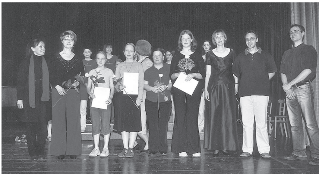
Letošnji tekmovalci, njihovi mentorji, po- močnica ravnateljice in ravnateljica na zaključnem koncertu izolske glasbene šole v Kulturnem domu Izola