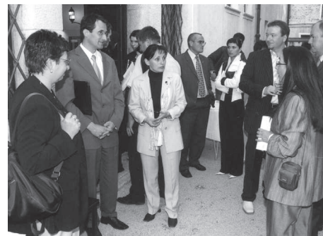
Ob otvoritvi vodnjaka na Majskem vrtu so nas počastili visoki gostje

S pomočjo MO Koper in s pomočjo Heliosa smo uspeli dvorišče/parkirišče Glasbene šole Koper preoblikovati v nov prireditveni prostor. Ponudili ga bomo tudi vsem tistim, ki bodo v toplih mesecih želeli popestriti kulturni utrip Kopra in Obale.