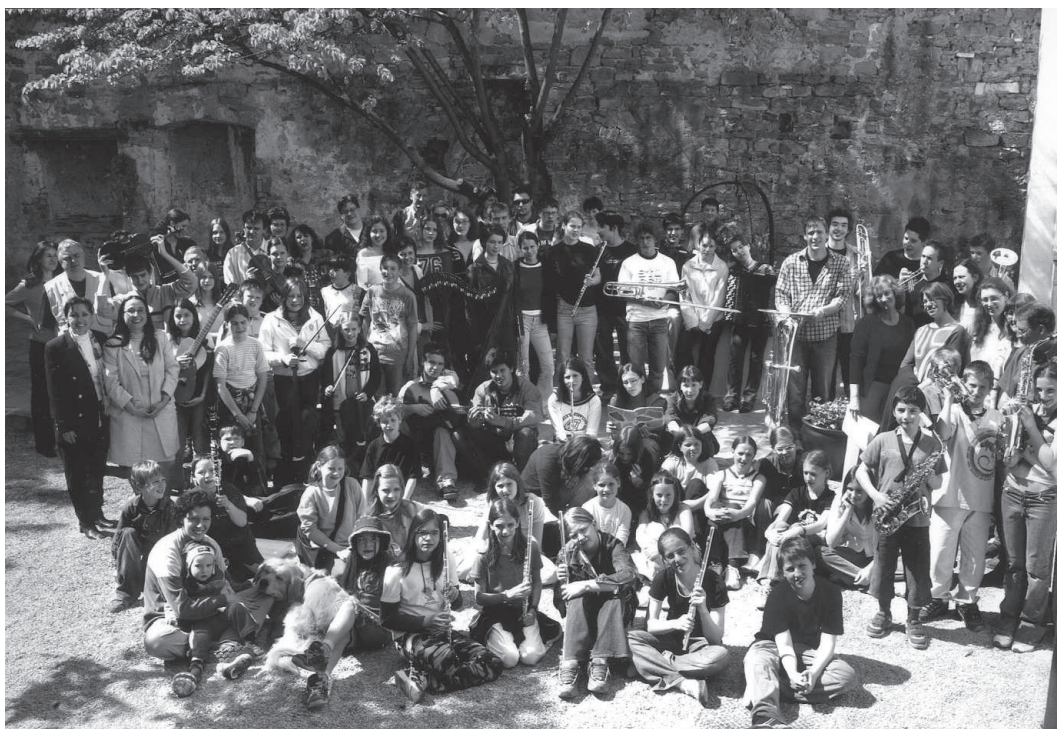
Majski vrt je zaživel: nekateri učenci, dijaki in učitelji Glasbene šole Koper