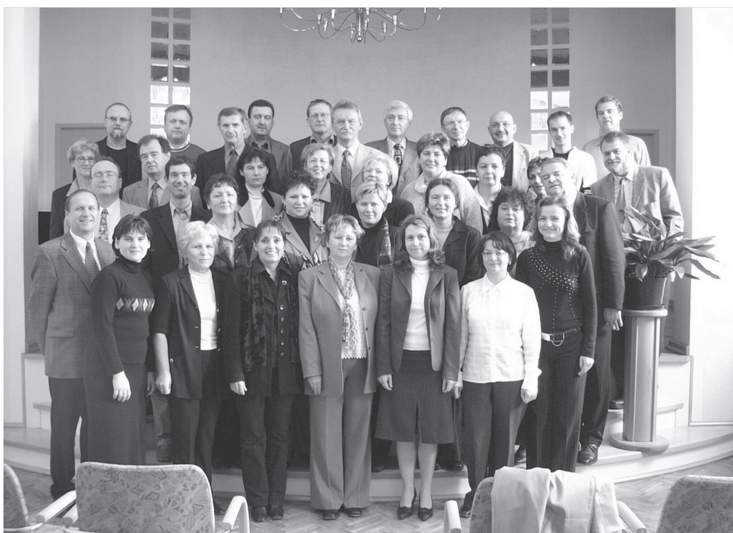
Ravnateljji slovenskih glasbenih šol na se- stanku v Ljutomeru